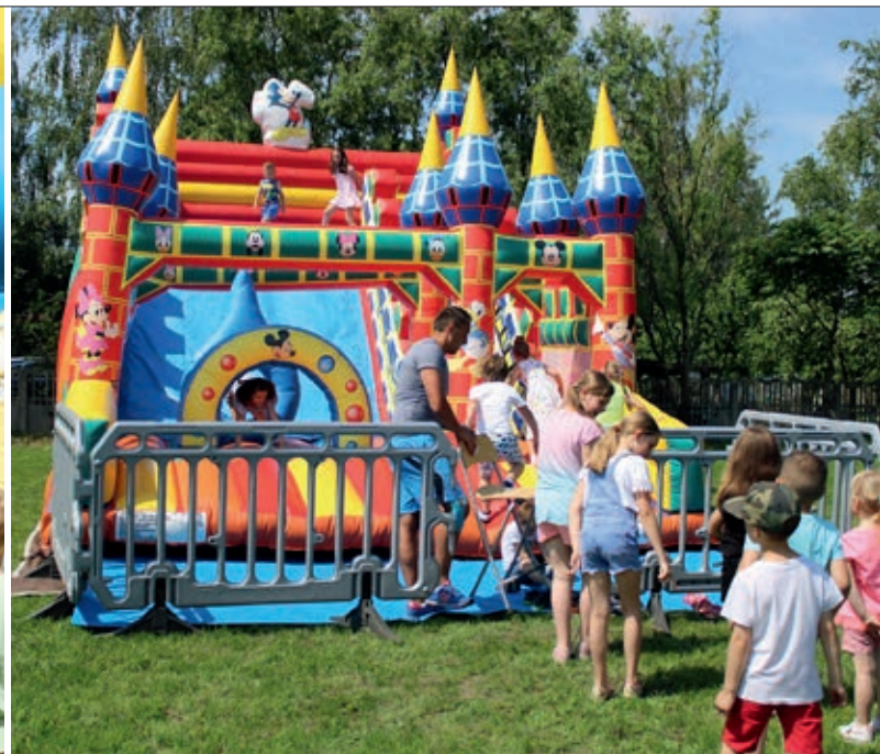
Atrakcje dla dzieci we Węgrach