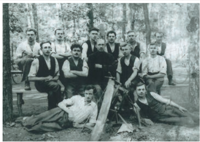
Zawody w lasku śliwnickim

Odrodzona po latach zaborów Ojczyzna borykała się z przeróżnymi problemami natury społecznej i ekonomicznej. Powszechne bezrobocie, słaby rozwój przemysłu i niski poziom gospodarki rolnej powodowały, że życie mieszkańców nie należało do najłatwiejszych. Mimo tak niesprzyjających warunków ekonomicznych, ówczesnym skalmierzyczanom nie brakowało zapału i radości życia.