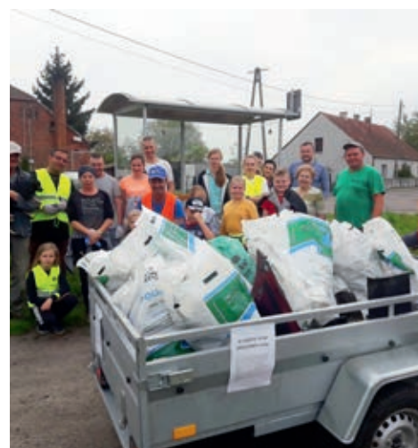
W akcjach sprzątania brali udział również młodzi mieszkańcy wsi