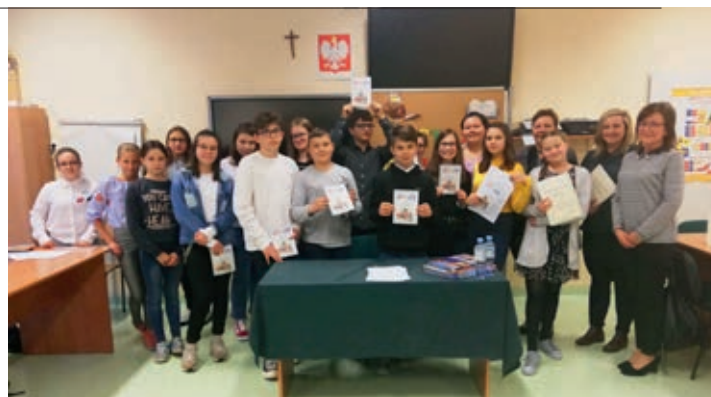
Nagrodzeni uczestnicy konkursu

Organizator konkursu: biblioteka szkolna