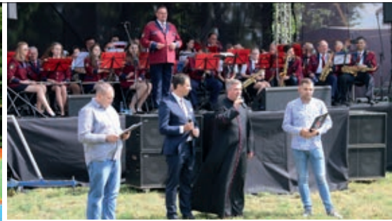
Festyn poprzedziła msza święta