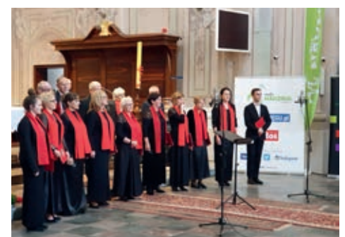
Chór św. Grzegorza podczas występu w Tykocinie