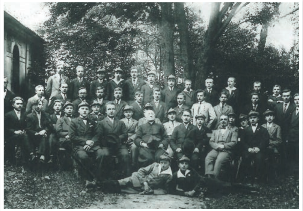
Święto młodzieży w Skalmierzycach - 1924 r.

Skalmierzycka młodzież w okresie międzywojennym nie znała telewizji, telefonów