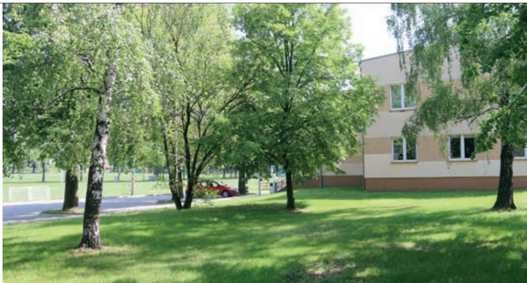
Otwarta Strefa Aktywności powstanie m.in. na Stadionie Miejsko-Gminnym

Pierwszy z kompleksów OSA, ten na miejskim stadionie, powstanie w wariantcie podstawowym. Zakłada on wyposażenie terenu elementy strefy relaksu, na którą złożą się ławka ze stołem do gry w szachy oraz piłkarszki integracyjne (przystosowane do osób