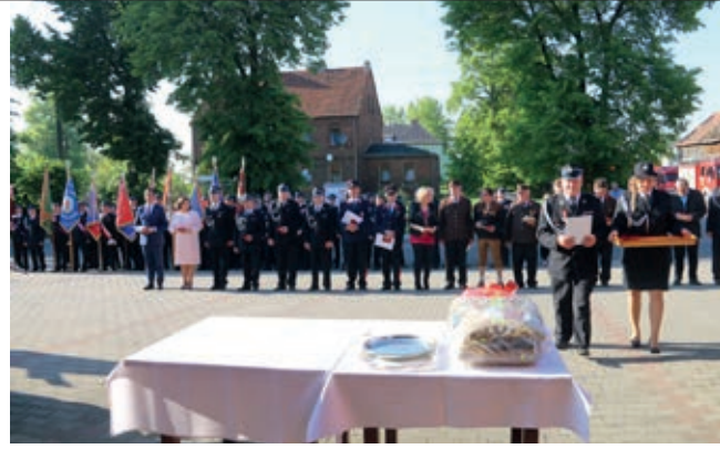
Obchody były okazją do wręczenia odznaczeń