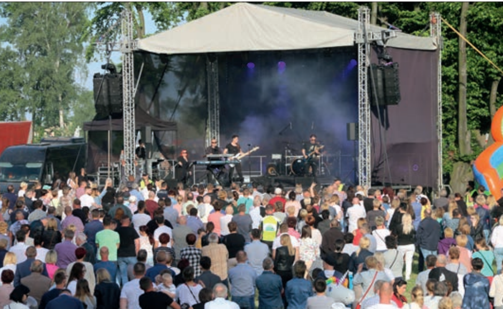
Występ zespołu Lombard