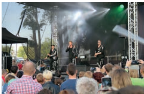
Występ zespołu Weekend