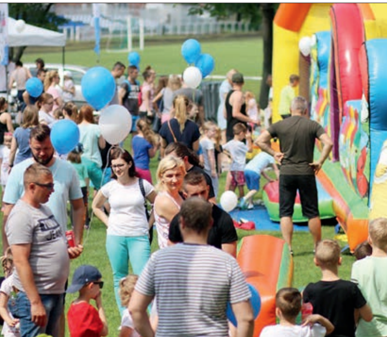
Gminny Dzień Dziecka