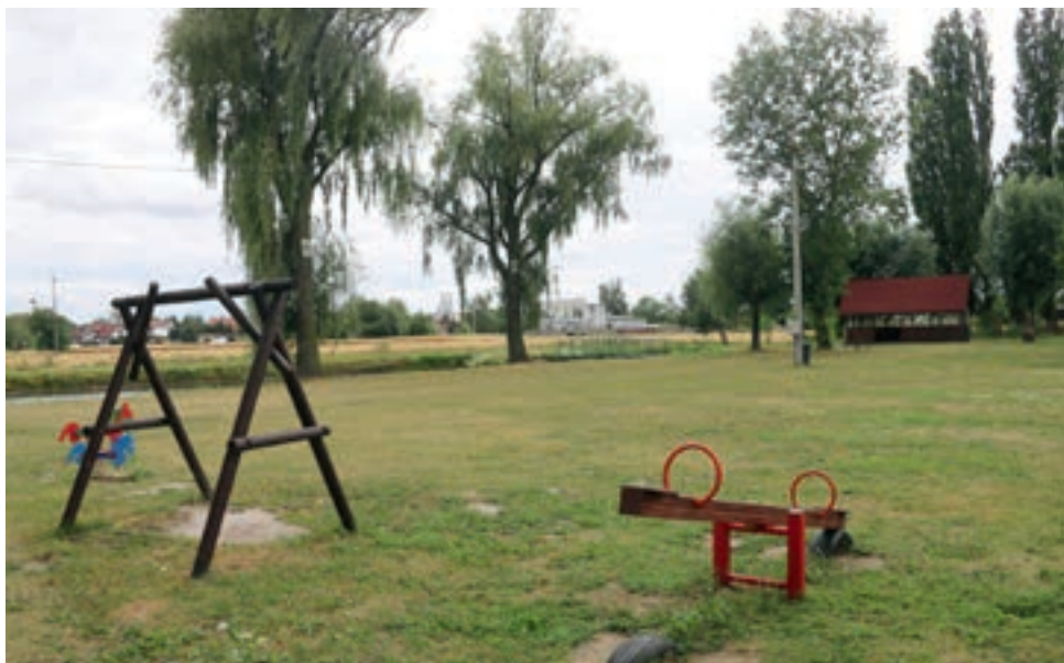
Jeden z projektów przewiduje powiększenie placu zabaw w Skalmierzycach