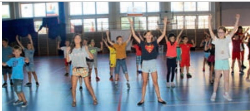
W dwóch turnusach półkolonii uczestniczyła ponad setka dzieci z terenu Gminy

nikom. Natomiast w drugim tygodniu I i II turnusu prawdziwą przygodą były wycieczki do kreatywnego parku rozrywki Mikroskala w Koninie. Niezwykłymi wydarzeniami były również warsztaty prowadzone przez kustosa Muzeum bajek, baśni i opowieści Mubabao. Uczestnicy każdego turnusu mogli nie tylko posłuchać niesamowitych historii, ale również przenieść się w krainę bajkostworów, wspólnie budować drewniane makiety, zrobić własne książki oraz tworzyć autorskie opowieści. Za nami wspólne gry, zabawy, warsztaty, treningi koszykówki z FKK Feniks z Kalisza, wizyty w Starym Kinie oraz atrakcyjne pikniki na zakończenie turnusów. Podczas pikników każdy uczestnik otrzymał upominek i dyplom oraz mógł wykonać pamiątkowe zdjęcia w fotobudce, wyszaleć się w na „dmuchańcach” zainstalowanych na szkolnym boisku, odpocząć w kawiarence.