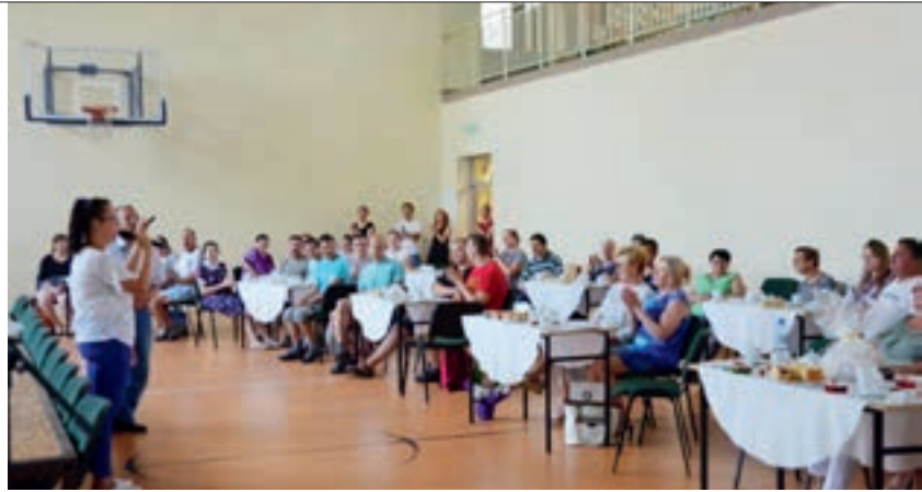
Uczniowie zaprezentowali zarówno utwory muzyczne jak i układy taneczne