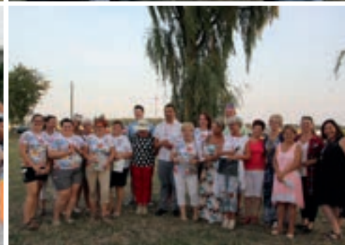
Zainteresowaniem cieszyła się akcja edukacyjna udzielania pierwszej pomocy oraz poczęstunek przygotowany przez Koło Gospodyń Wiejskich