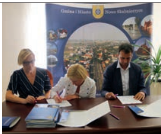
Umowy na realizację zadań podpisało 18 organizacji pozarządowych