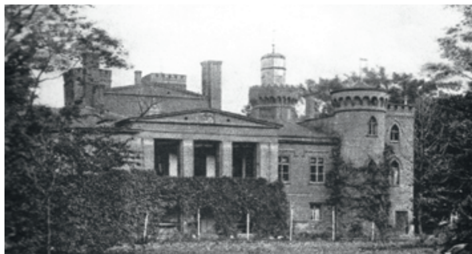
Pałac w Śliwnikach

ojca zmusiła go do powrotu w rodzinne strony, aby przejąć zarządzanie majątkami w Jedlcu i Śliwnikach oraz rozpocząć – jak to określił – „zawód obywatelski”. W pamiętnikach napisał: Po trzyletnim pobycie w Berlinie podążyłem do domu do Jedlca, do kochanej gospodarki, która w naszym rolniczym kraju, aby dobrze pojęta i spełniona, jest najważniejszym, a w dodatku najniezależniejszym zawodem. Jeszcze w trakcie studiów odbył przymusową służbę wojsko-