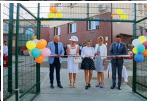
Uroczyste przecięcie wstęgi na nowym boisku