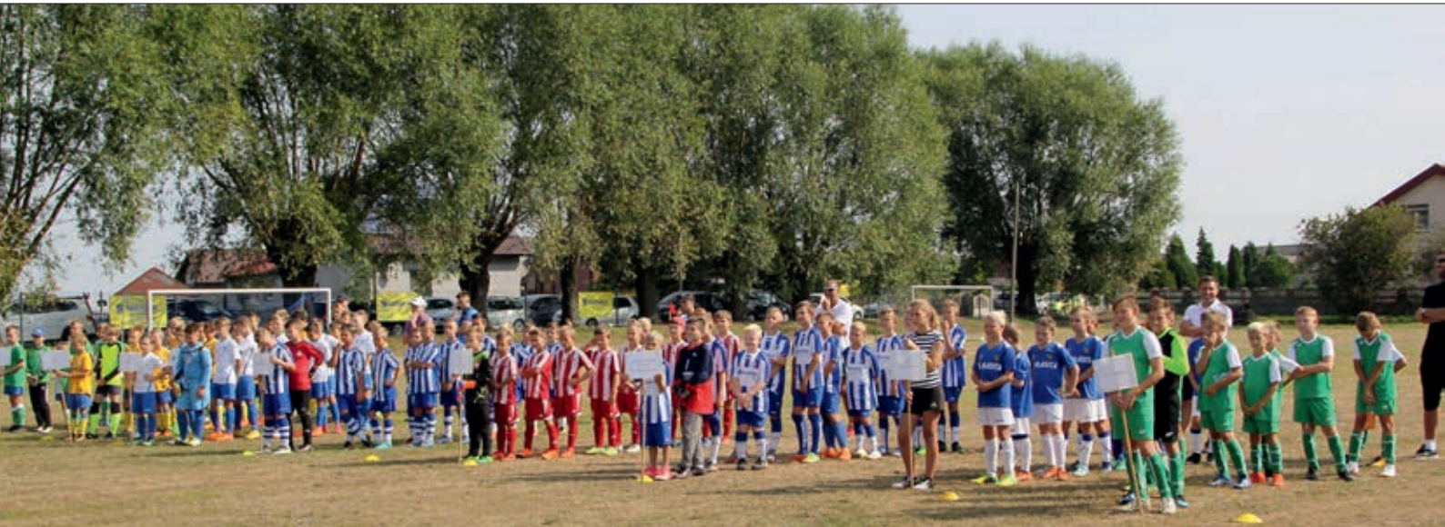
W zawodach wzięło udział osiem drużyn