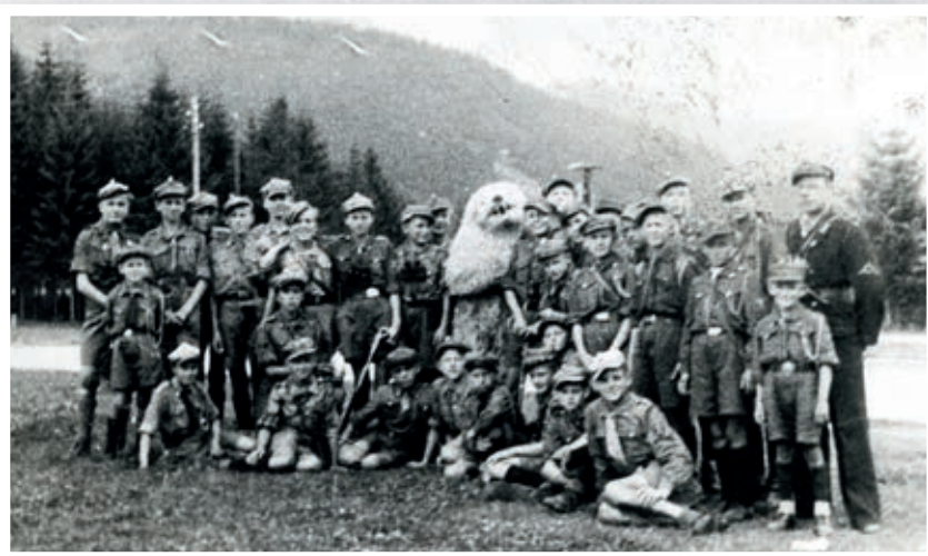
Obóz Zakopane, 1946 r.

w bliższej i dalszej okolicy, uczestniczyła również w spotkaniu w Gdyni z twórcą skautingu angielskiego, Baden-Powellem. W Poznaniu harcerze spotkali się z prezydentem Polski I. Mościckim oraz uczestniczyli w Ostrowie w zlocie hufca ostrowskiego, czego konsekwencją była inicjatywa organizacji „Dnia Harcerza” w Skalmierzycach Nowych.