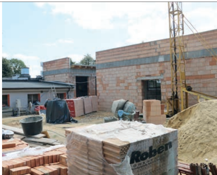
Rozbudowa szkoły w Kotowiecku