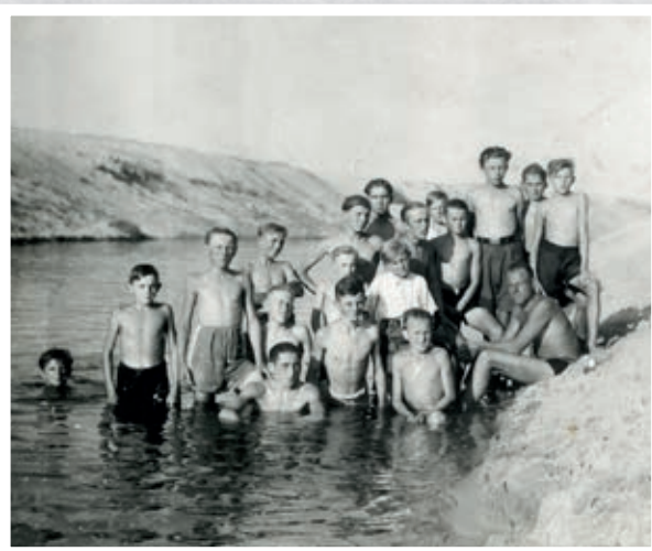
Obóz, 17.08.1933 r.

W niedzielę obozowisko ożyło już wczesnym rankiem, a zebrani harcerze pod kierunkiem komendantki hufca żeńskiego udali się na mszę św. do kościoła Bożego Ciała. Po