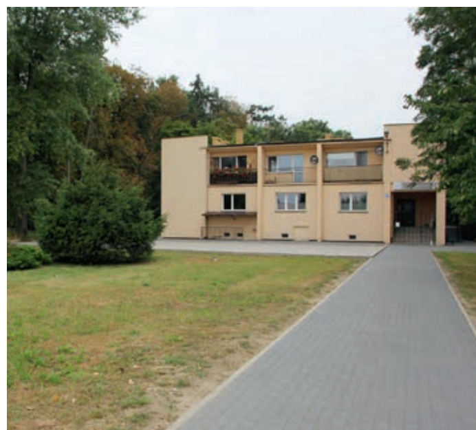
Przy Ośrodku Zdrowia w Kotowiecku powstanie świetlica

Jeszcze w tym roku wykonana będzie dokumentacja techniczna wraz z kosztorysem inwestorskim, aby docelowo przystąpić do budowy obiektu. Cieszę się bardzo, że udało się pozyskać tę działkę i tym samym wieś Kotowiecko będzie miała przygotowany grunt pod budowę kolejnej już nowej świetlicy na terenie Gminy - powiedziała Bożena Budzik.