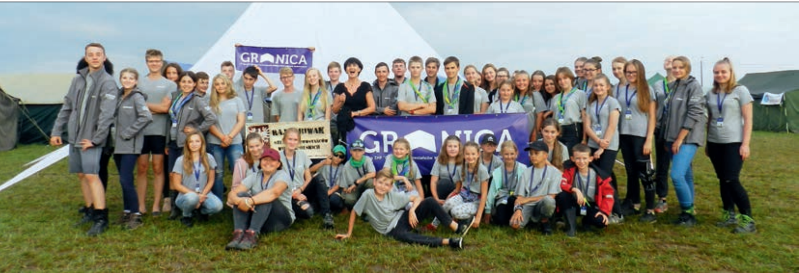
Harcerze ze szczebu ZHP „Granica” na zlocie w Gdańsku