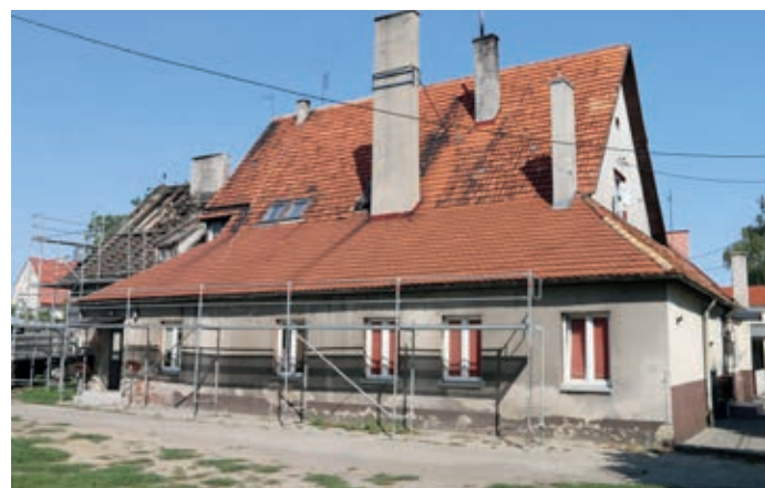
„Herberga” dawniej i dziś