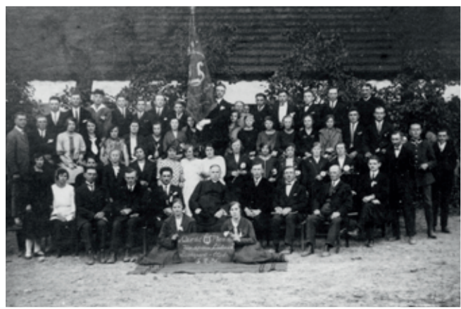
Lutnia w 1926 r., poświęcenie sztandaru