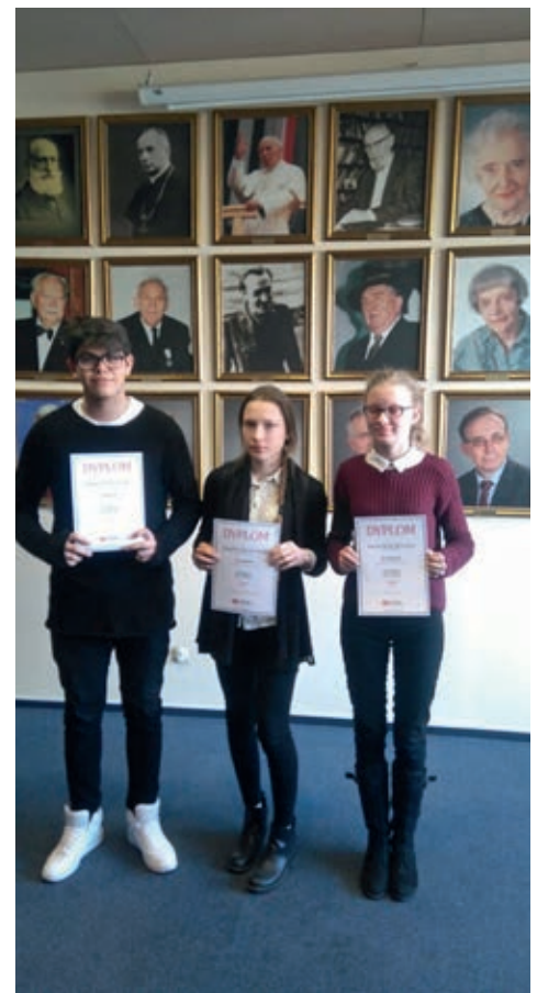
Uczniowie z Nowych Skalmierzyc zdobyli wszystkie miejsca na podium