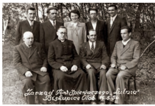
Lutnia zarząd, 1954 r.