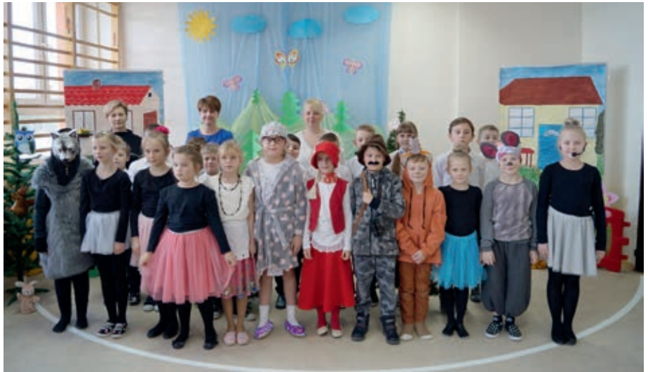
Przedokolaki przygotowały przedstawienie pt. „Czerwony Kapturek”