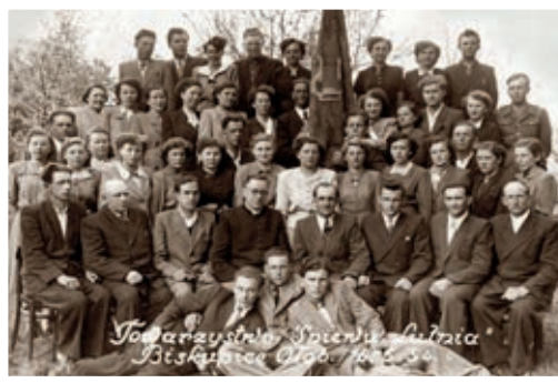
Lutnia, 1954 r.