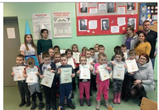
Przedszkolaki z „Jarzębinki” podczas wizyty w pracowni chemicznej

księżycy”. Wyjątkowi goście byli zafascynowani możliwością odkrywania nieznanego, a nawet niebezpiecznego świata u boku starszego, mądrzejszego kolegi. Młodzież natomiast poczuwała się do odpowiedzialności za powierzone im dzieci. Podsumowaniem spotkania było wręczenie dyplomów „Małego Chemika” oraz „czarodziejskich kulek” w ramach prezentów od prowadzących zajęcia. Warsztaty pozostaną zapewne w pamięci