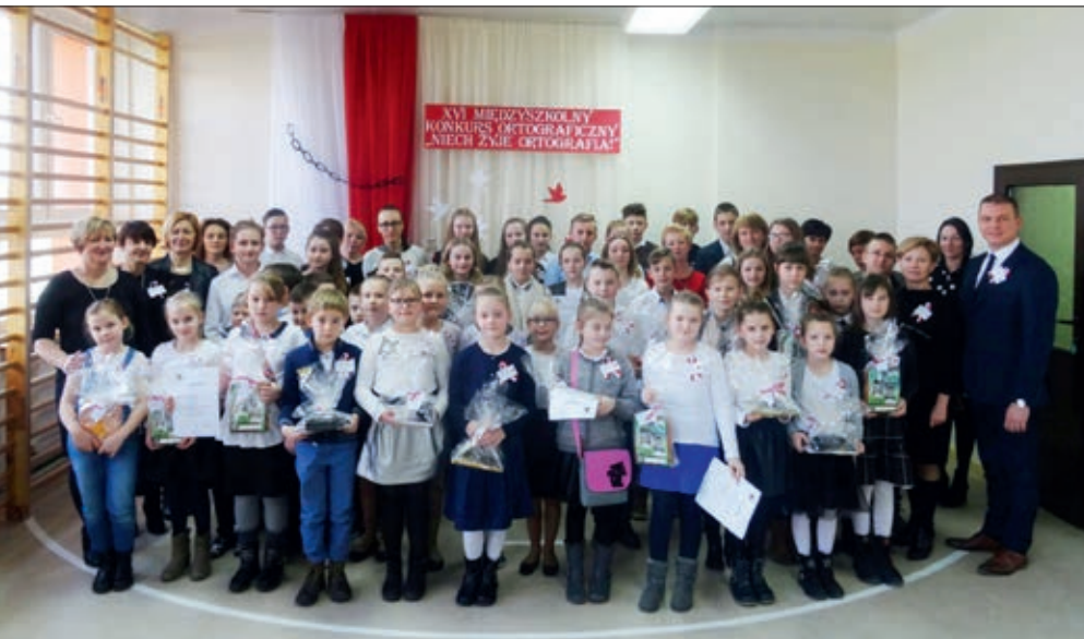
Uczestnicy konkursu ortograficznego