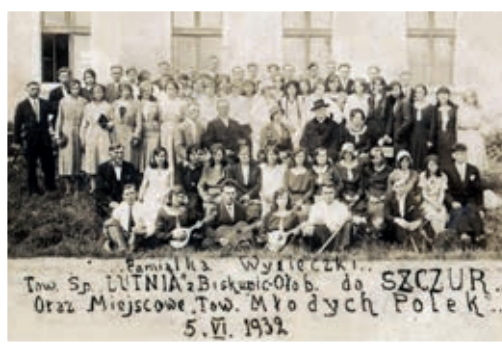
Lutnia, wycieczka do Szczur w 1932 r.