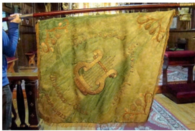
Sztandar Lutni przed renowacją