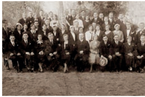
Lutnia, lata 20.

Zmiany społeczne zachodzące w latach 60. nie ominęły również Biskupic Ołobocznych. Zmniejszenie zainteresowania działalnością społeczną i niski udział młodzieży w pracach towarzystwa spowodowały, że zarząd postanowił, aby obok tradycyjnej działalności rozpocząć prace teatralne. Był to bardzo udany pomysł, bowiem grupa kilkunastu fascynatów teatru