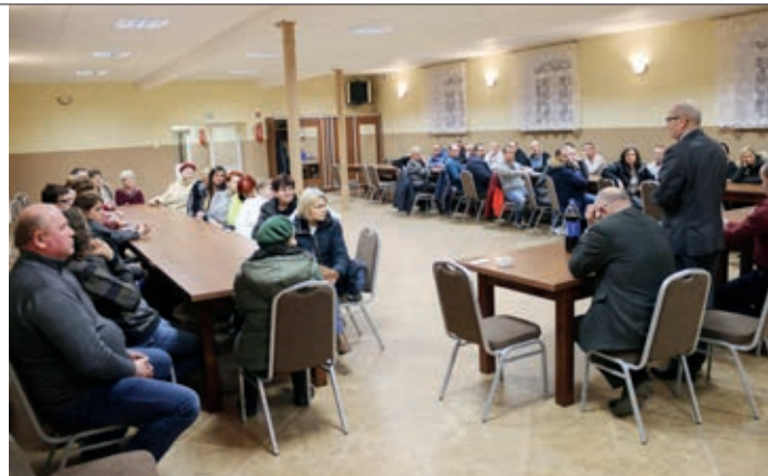
Spotkanie w Boczkowie