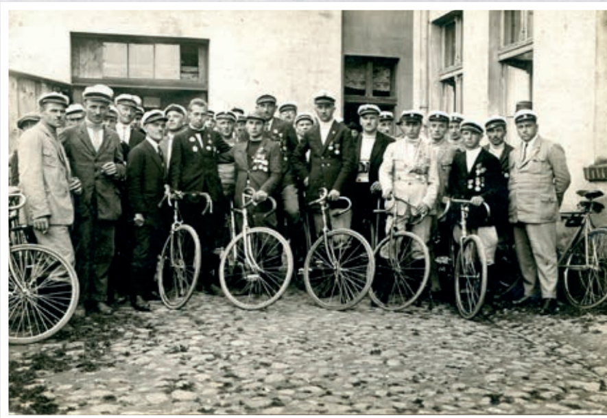
Towarzystwo Cyklistów, 1931 rok

Jako pierwszy proponuję ciekawy temat: Rok 1927 - Skalmierzycki cyklista na audyencji u papieża Piusa XI.