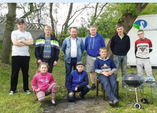
Po zakończonej pracy większość uczestników wzięła udział w małym poczęstunku