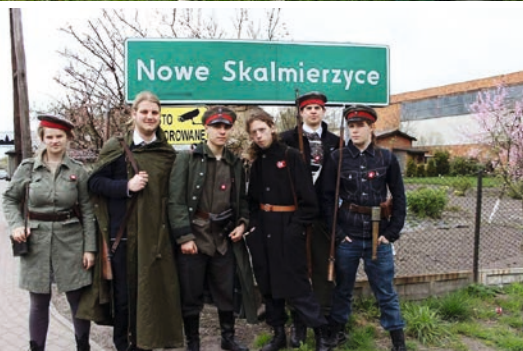
Podczas rajdu na terenie gminy można było dostrzec ludzi w epokowych strojach

piosenki nawiązujące do tamtych czasów. Odbłyło się również tradycyjne harcerskie śpiewogranie, a później czas można było spędzić tańcząc, grając w gry planszowe oraz w dalszym ciągu śpiewając.