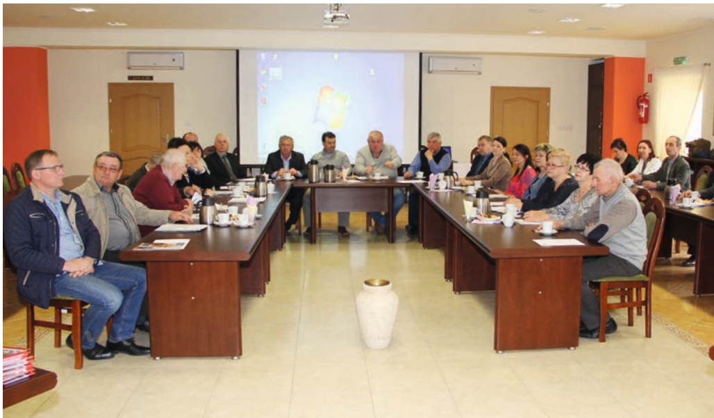
Na spotkaniu obecnych było 25 sołtysów

W gminie Nowe Skalmierzyce funkcjonuje obecnie 26 sołectw i 1 miasto. Na spotkaniu z burmistrzem obecnych było 25 sołtysów. Wśród nich dziewiętnastu będzie pełnić tę funkcję po raz kolejny. Z uwagi na brak wymaganego kworum nie wybrano