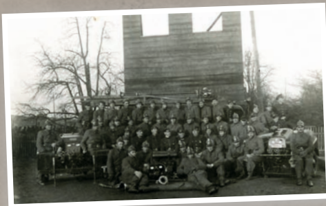
Wspinalnia na Stadionie w Nowych Skalmierzycach