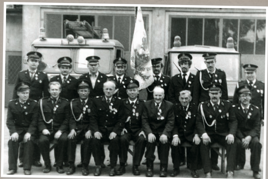
Pamiętkowa fotografia na 60. lecie OSP Skalmierzycze

niez w powiecie, wynikiem czego było zajęcie II miejsca na zawodach powiatowych w 1932 roku w Ostrowie Wielkopolskim.