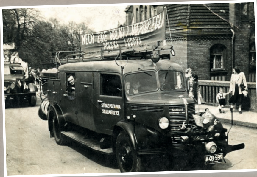
Pierwszy samochód OSP Skalmierzyce - Bedford na pochodzie pierwszomajowym

placu przy remizie. Na początku lat 80-tych straż wyposażona była w dwa samochody bojowe, trzy motopompy oraz ogólnego użytku sprzęt przeciwpożarowy. Strażacy czynnie brali udział w szkoleniach pożarniczych oraz uczestniczyli w przeglądach posesji organizowanych corocznie z okazji dni ochrony przeciwpożarowych. Lata 1984-85 to okres związany z pracami wykończeniowymi świetlicy oraz uzupełnianiem wyposażenia. Wówczas jednostka otrzymała nowoczesny, jak na owe czasy, samochód bojowy marki Jelcz, który przekazała Komenda Rejonowa Państwowej Straży Pożarnej w Kaliszu. W 1987 roku otrzymano kolejny pojazd, tym razem był to legendarny Żuk.