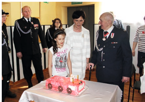
Po oficjalnej części przyszedł czas na wspólny posiłek, tort oraz pamiątkowe zdjęcie

chomość wraz z fragmentem parku dworskiego. Pierwszy pojazd z prawdziwego zdarzenia to wycofany z policji Star A-29 zakupiony w 1991 roku, który był w użyciu aż do 2012 roku, kiedy to samorząd Gminy i Miasta Nowe Skalmierzyce przekazał wóz bojowy Renault G270 Manager, służący jednostce do dzisiaj.