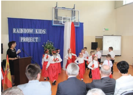
Występ dzieci z SP w Gostyczynie

W dniach 13-17 kwietnia 2015 roku odbyło się kolejne, partnerskie spotkanie nauczycieli i uczniów ze szkół podstawowych Turcji, Hiszpanii i Estonii. Gościliśmy 6 nauczycieli i 6 uczniów z Turcji, 3 nauczycieli i 9 uczniów z Hiszpanii oraz 2 nauczycieli i 3 uczniów z Estonii.