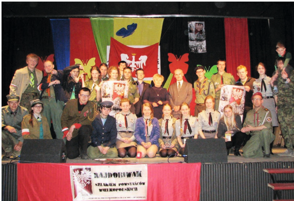
Na rajdo-biwak przyjechali harcerze z całego województwa