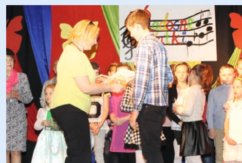
Zwycięzcy otrzymali dyplomy, nagrody książkowe oraz słodkości