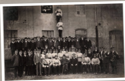
Ćwiczenia na młynie w Skalmierzycach

nia o przydział gruntu pod budowę nowej remizy. Po drodze napotkano na trudności z byłym dzierżawcą. Po uzyskaniu terenu została wykonana dokumentacja oraz zaczęto gromadzić pierwsze materiały. Gruz zwożono z rozbiórek starych murów budynków majątkowych z Boczkowa, Psar i Śmiłowa. W 1953 roku został powołany Komitet Budowy Remizy, jednak w związku z jego słabą inicjatywą ciężar budowy przejęli strażacy pod przewod-