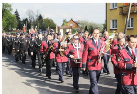
Uroczysty przemarsz do remizy w Skalmierzycach

Uroczystości rozpoczęto mszą świętą w intencji wszystkich strażaków w kościele pw. św. Katarzyny Aleksandryjskiej w Skalmierzycach. Eucharystię odprawił kapelan straży ks. kan. Sławomir Nowak, prosząc o błogosławieństwo ich patrona – świętego Floriana, którego wspomnienie przypada na dzień 4 maja. Po mszy świętej, przy dźwiękach marsza granego przez Miejsko-Gminną Orkiestrę Dętą, udano się w uroczystym przemarszu do remizy w Skalmierzycach, gdzie wszystkich zebranych oficjalnie przywitał Prezes Zarządu