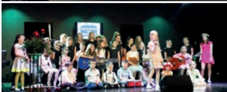
Mottem przewodnim występów były ogrody

Skalmierzycyjskie Mażoretki – uczennice klas I-III, drugi – taniec do ballady „Hallelujah” – zatańczyły ich starsze koleżanki. Nostalgiczny nastrój, w jaki wprowadziły nas ostatnie tancerki zmienił się podczas brawurowego wykonania piosenki „Do zakochania jeden krok”, w którym znów zaprezentował się szkolny zespół instrumentalno-wokalny. Tytułowy motyw ogrodów wybrzmiał również w utworze „Pamiętajcie o ogrodach”. Na zakończenie spotkania wszyscy wykonawcy towarzyszyli na scenie solistce z klasy IV, która wykonała piosenkę „Więc chodź, pomaluj mój świat” – była ona piękną i kolorową muzyczną ilustracją do plastycznych ogrodów sztuki, które można było podziwiać w holu Starego Kina.