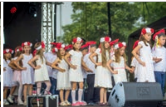
Atrakcje dla dzieci