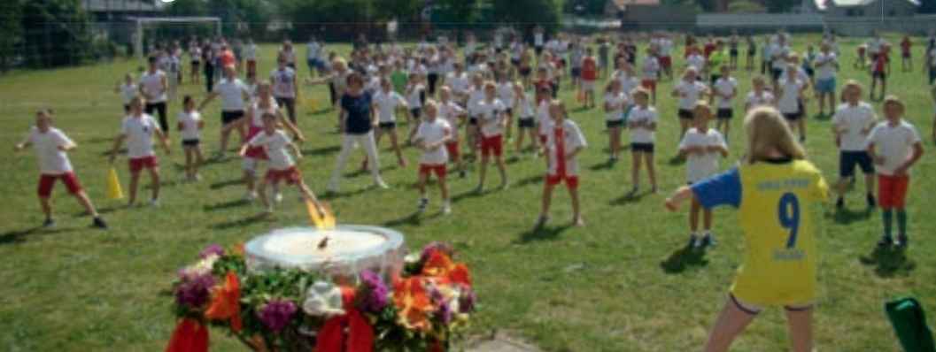
Olimpijski znicz i pokaz tańca