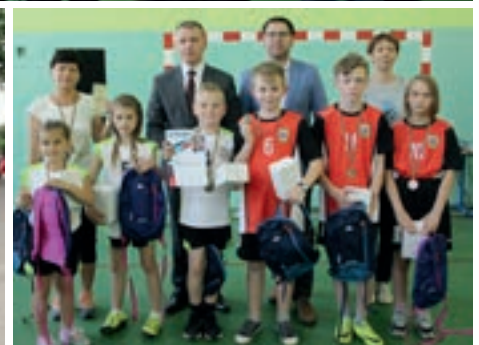
Nagrodzeni uczestnicy zmagania sportowych