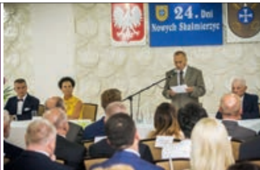
Uroczysta sesja Rady Gminy i Miasta