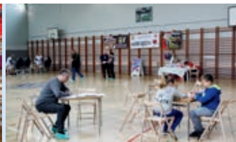
Podczas 70. akcji krew oddały 43 osoby

W akcję, która odbyła się 18 czerwca br. w hali miejskiego stadionu, włączyły się pięćdziesiąt dwie osoby chcące oddać krew, z czego po badaniach mogło to uczynić czterdzieści trzy (w tym czternaście kobiet). Swoją „cegiełkę” dołożył także Zastępca Burmistrza Gminy i Miasta Nowe Skalmierzyce