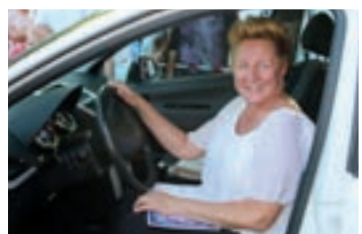
Zdobywczyni głównej nagrody