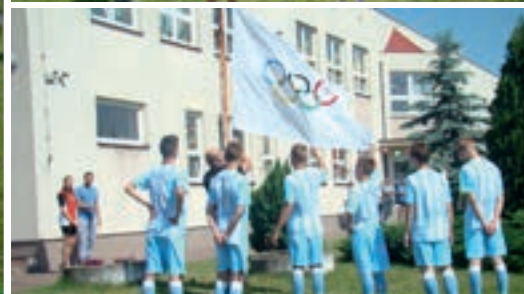
Defilada dwunastu państw i uroczyste zawieszenie flagi olimpijskiej