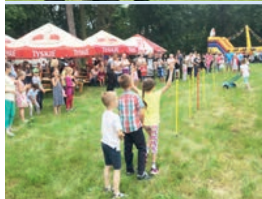
W zmaganiach brali udział dorośli i dzieci

Dzieci zamiast cukierkami zjadały się owocami i warzywami. Można było również spróbować swojskiego chleba ze smalcem i ogórkiem. Panie przygotowały kącik kawowy z ciastem, a panowie grillowali kiełbasę.