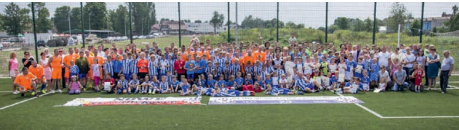
Wspólne zdjęcie drużyn skupionych wokół KS „Pogoń”

ry z ostatnich albumów. Nie zabrakło bisów, podobnie jak przy występie zespołu Enej, który zagrał na zakończenie. Energetyczne „Skrzydlate ręce”, „Tak smakuje życie” itd. tak rozgrzały publiczność, że nie dała artystom szybko zejść ze sceny. Kilka chwil po ostatnim