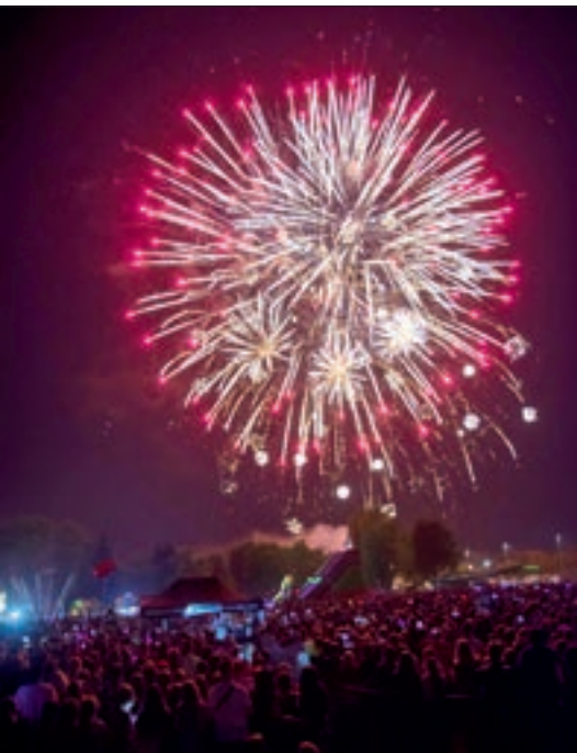
Finałowy pokaz sztucznych ogni