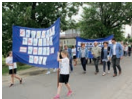
Przemarsz uczestników w kolorowym korowodzie