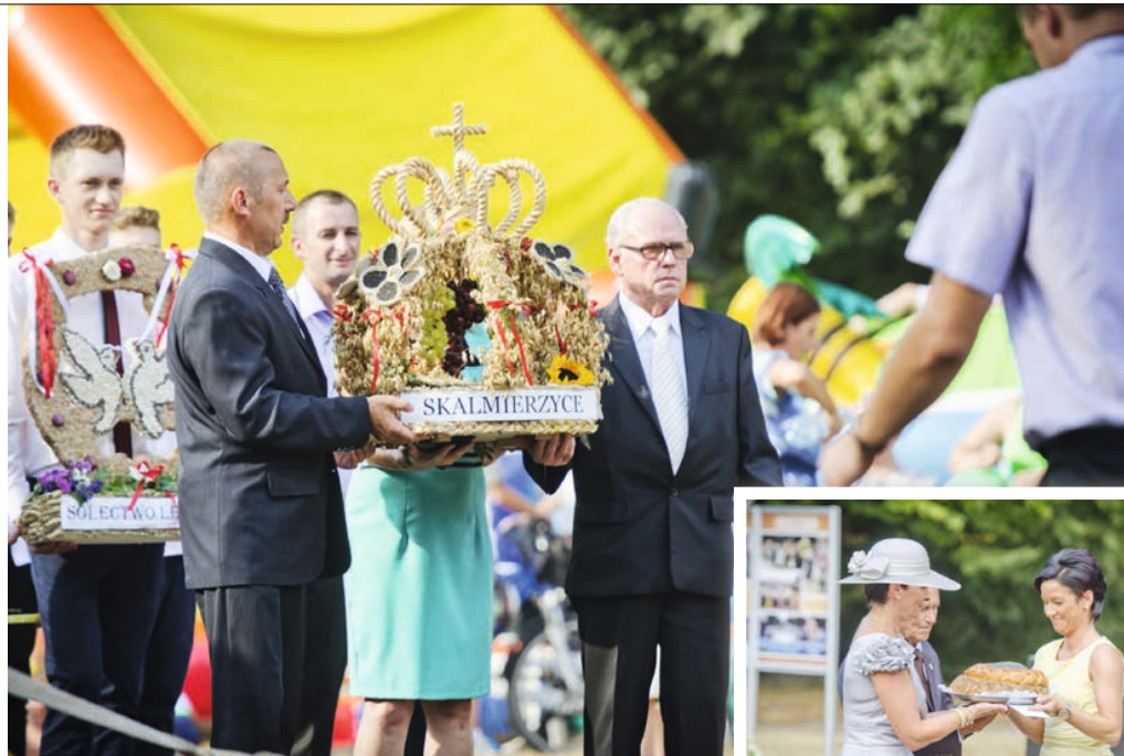
▲► Prezentacja wieńców oraz przekazanie chleba władzom samorządowym