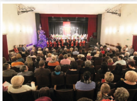
Sala współcześnie - Koncert Noworoczny

Kolejny etap funkcjonowania kina to utworzenie Miejsko-Gminnego Ośrodka Kultury przy Radzie Narodowej Miasta i Gminy w Nowych Skalmierzycach, powołanego 27