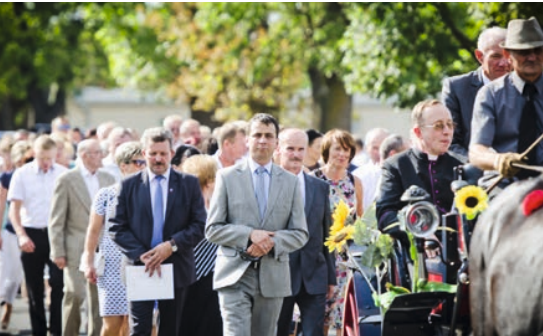
▲ Korowód dożynkowy przy dźwiękach muzyki Miejsko-Gminnej Orkiestry Dętej