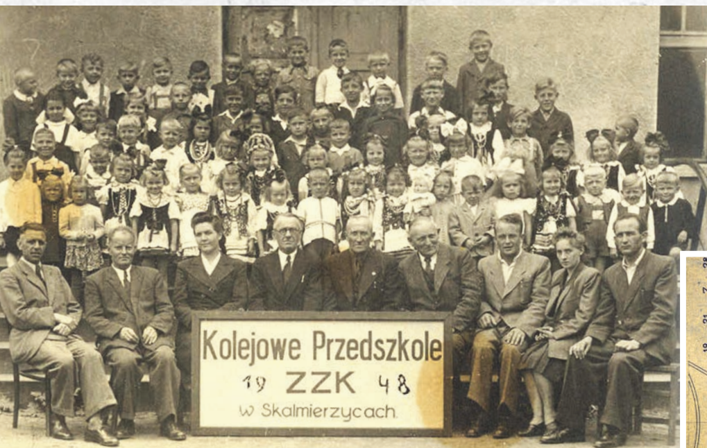
Członkowie Związku Zawodowego Kolejarzy z dziećmi z przedszkola kolejowego w roku 1948 - fotografia wykonana przed świetlicą