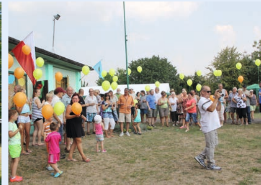
Wypuszczono 60 balonów symbolizujących 60 lat istnienia ogrodu ▲