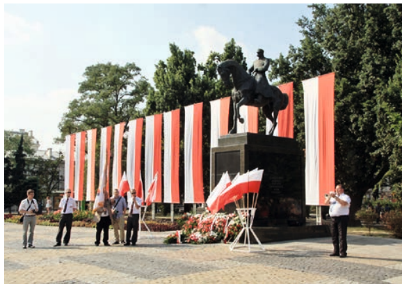
Przed Pomnikiem Józefa Piłsudskiego

Uroczystości rozpoczęły się mszą św. w Bazylice oo. Dominikanów. Oprawę muzyczną zapewnił hejnaliści z Wielkopolski reprezentujący Nowe Skalmierzyce,