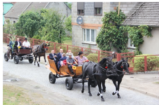
▲ Uroczysta msza św. oraz korowód dożynekowy