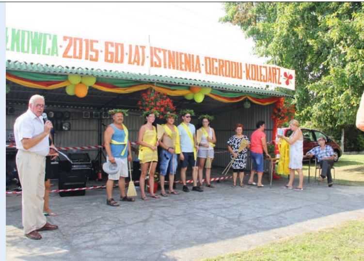
▲▼ Uczestnicy festynu mogli wziąć udział w licznych konkursach

Wspólna zabawa integrująca wszystkich przybyłych trwała do późnych godzin nocnych.