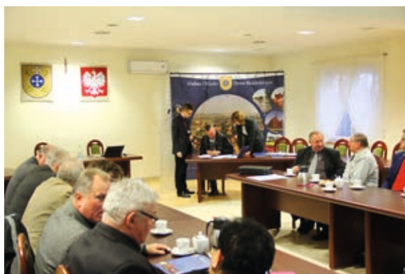
W spotkaniu wzięli udział przedstawiciele organizacji pozarządowych

ganizacja i prowadzenie procesu szkolenia sportowego dzieci i młodzieży w popularnych dyscyplinach sportowych - 12.000 zł, Miejsko-Gminny UKS „Pogoń” Nowe Skalmierzyce - organizacja i prowadzenie procesu szkolenia sportowego dzieci i młodzieży w dyscyplinie szachy w szkołach podstawowych i gimnazjach oraz na terenie gminy i miasta Nowe Skalmierzyce - 7.500 zł,