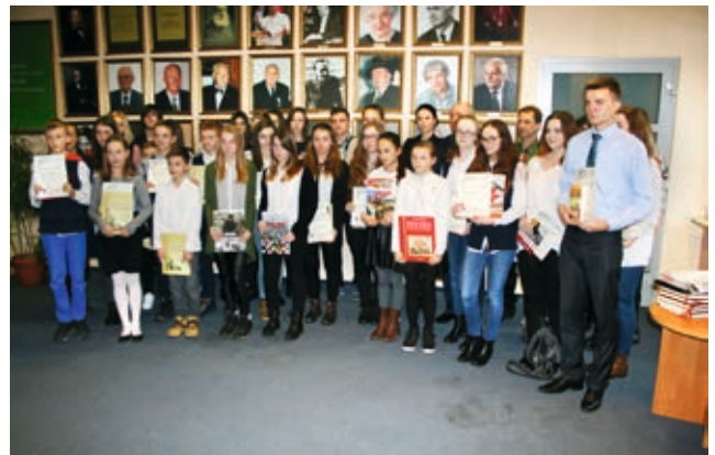
Nagrodzeni uczestnicy konkursu w bibliotece w Ostrowie Wielkopolskim

Serdecznie gratulujemy laureatkom, a wszystkim uczestnikom konkursów bibliotecznych życzymy zapału w dalszych zmaganiach.