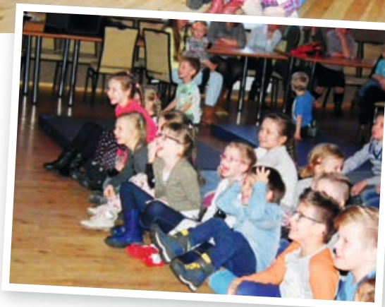
Przygody Majki i Grubcia wywoływały żywą reakcję małych widzów