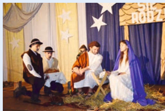
Jasełka w wykonaniu uczniów gimnazjum w Nowych Skalmierzycach

Już za nami kolejne Boże Narodzenie – czas życzeń, miłości i rodzinnego ciepła. Czas narodzin Syna Bożego. Ale to dopiero początek historii Jezusa. Ona nadal trwać będzie w naszych sercach, duszach. Każdy z nas, tak jak Jezus, przeżywa drogę do Betlejem i spotyka na niej radość, smutki i wielkie nadzieje. Lecz są takie chwile, gdy