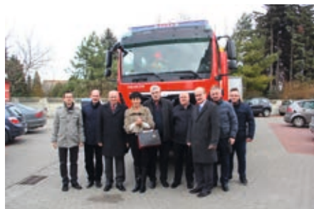
Połowę kosztów wozu stanowiły środki z budżetu gminy

Jest to w sumie już ósmy wóz sfinansowany przez samorząd od 2012 roku. Tym razem trafił do jednostki OSP w Gostyczynie, która jest w Krajowym Systemie Ratowniczo-Gaśniczym. Przy okazji zakupu zmodernizowano garaż w jednostce.