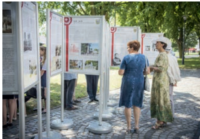
Wystawa pt. „Ludzie Niepodległości”

Dziękuję dyrektorom szkół, przedszkoli i żłobka, że daliśmy wspólnie radę wdrażając na przestrzeni lat dwie reformy oświaty.