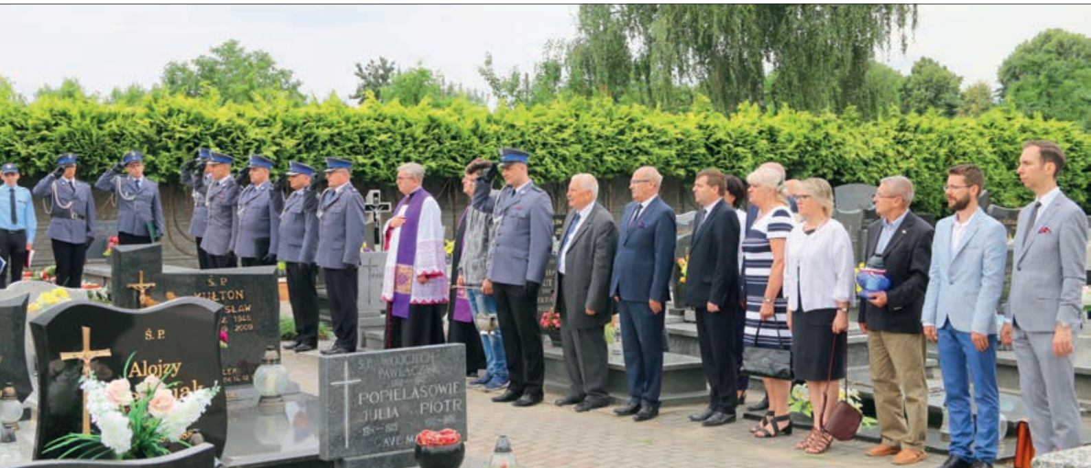
Uroczystość poświęcenia odnowionego nagrobka Jana Stachelskiego na cmentarzu w Nowych Skalmierzycach