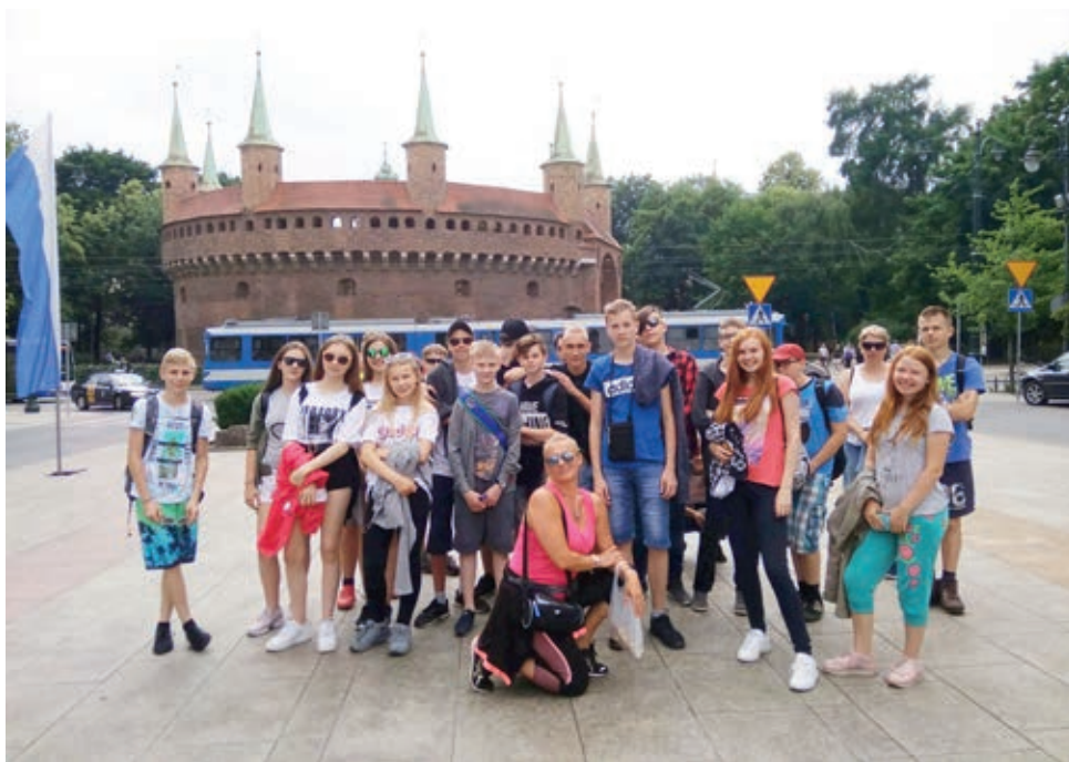
Uczniowie zwiedzili również starówkę w Krakowie