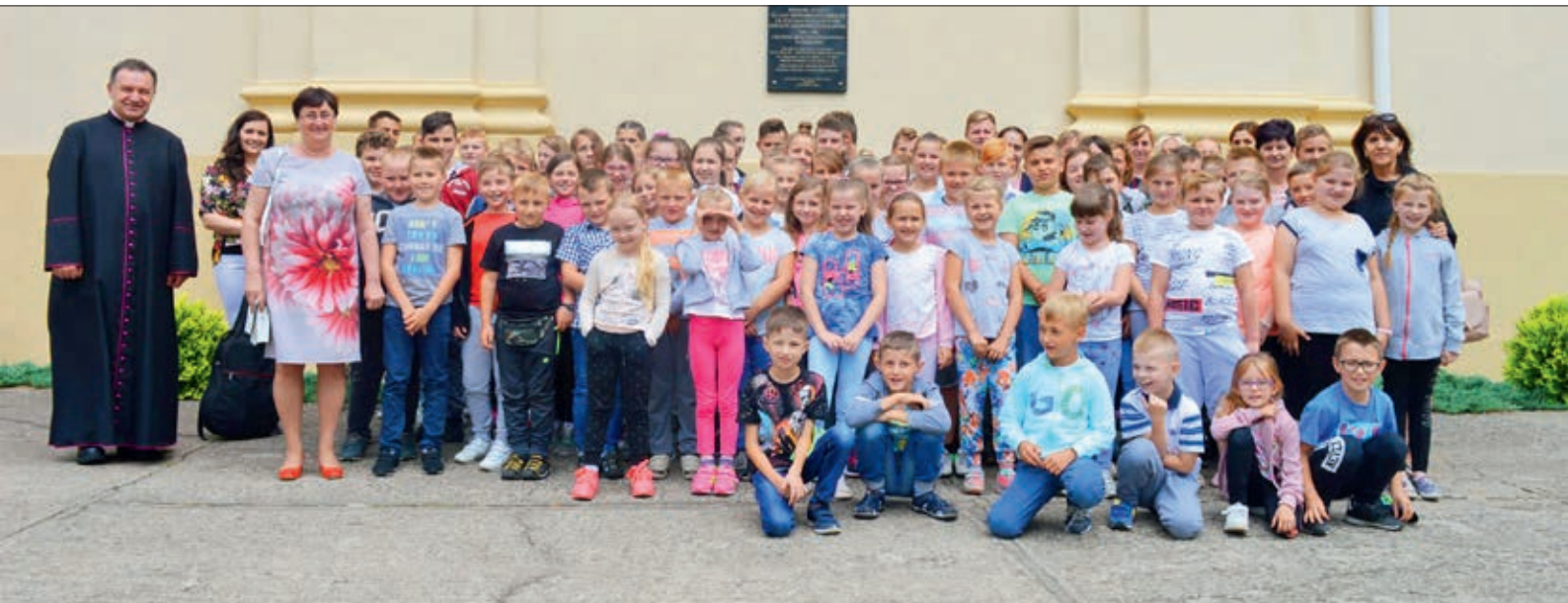
Uczniowie poznawali w Żerkowie sylwetkę patrona szkoły - Jana Nepomucena