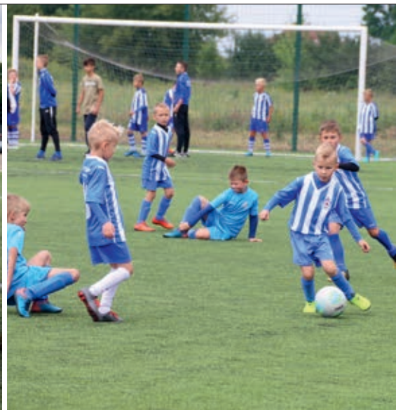
Turniej o Puchar Burmistrza Gminy i Miasta Nowe Skalmierzyce