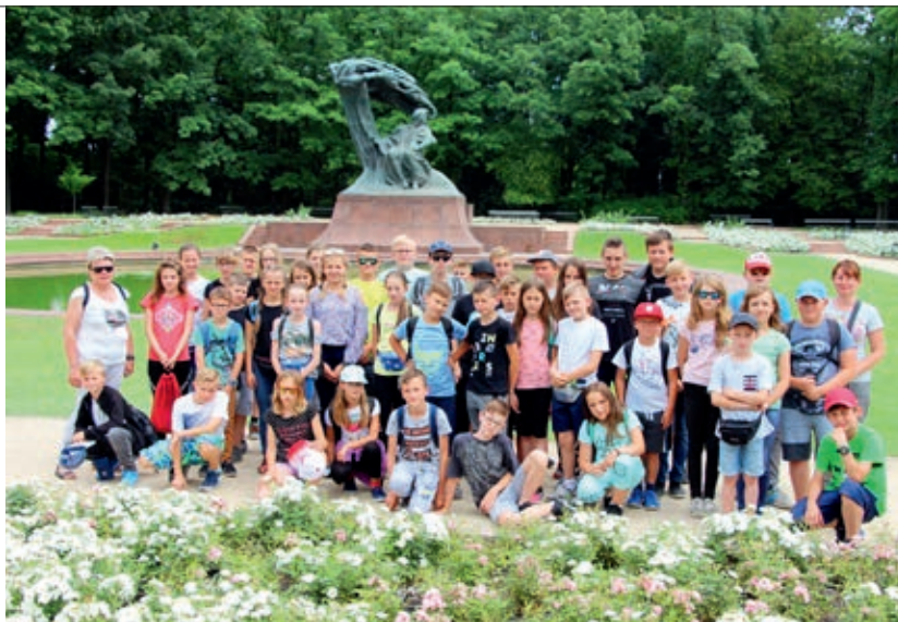
Uczniowie pod pomnikiem Fryderyka Chopina w Warszawie

Uczniowie klas IV-VII natomiast zwiedzili