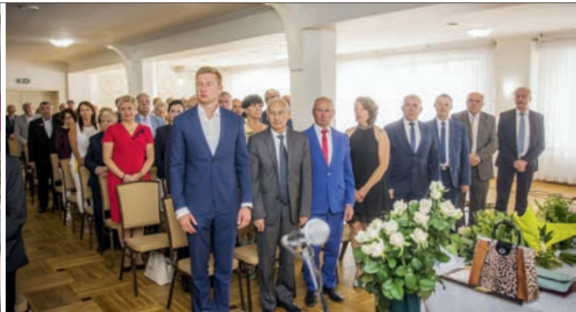
Uroczysta sesja Rady Gminy i Miasta