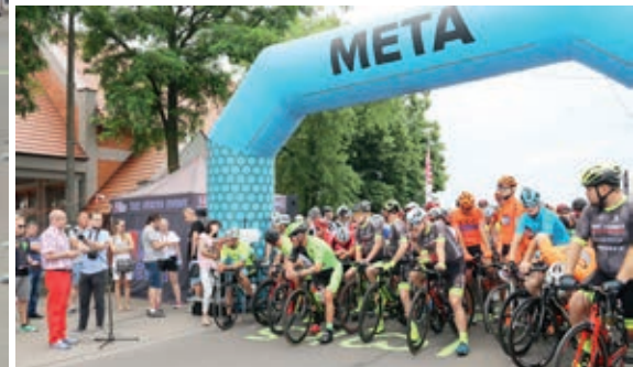
W wyścigu wzięło udział 161 kolarzy z całej Polski