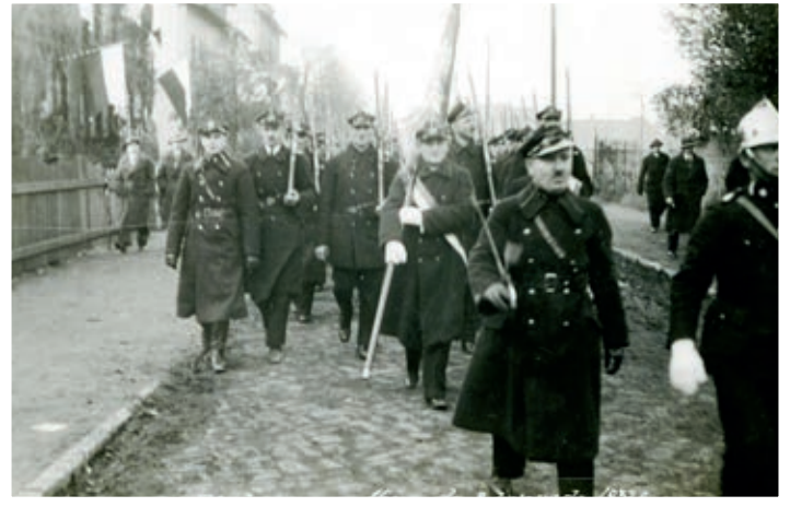
Powstańcy wielkopolscy w procesji podczas poświęcenia kościoła

ciele różnych organizacji składali stosowne podziękowania i życzenia. Na zakończenie akademii ks. Jeliński wygłosił przemówienie oraz zaintonował pieśń „My chcemy Boga”. Całe popołudnie i wieczór wypełniła zabawa taneczna w ogrodzie oraz sali KPW.