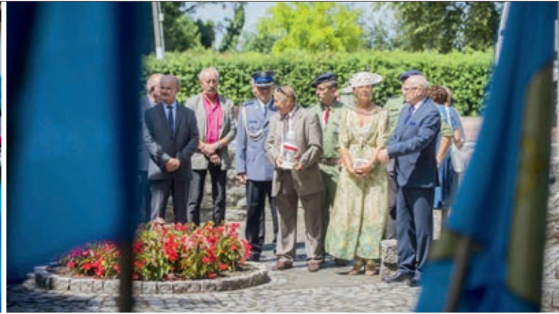
Złożenie kwiatów przy pomniku Powstańców Wielkopolskich

i zakończony pierwszy etap modernizacji stadionu wraz z nowoczesnym boiskiem treningowym o nawierzchni ze sztucznej trawy. Kończymy budowę hali sportowej przy szkole podstawowej Powstańców Wielkopolskich. Powstaje kolejne boisko o sztucznej nawierzchni w Skalmierzycach. Nowego blasku nabiera również szkoła podstawowa w Biskupicach Ołobocznych.