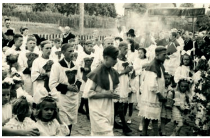
Procesja Bożego Ciała na ul. Hallera - obecnie Wyszyńskiego