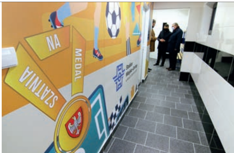
„Szatnia na medal” jest już gotowa na nadchodzący sezon