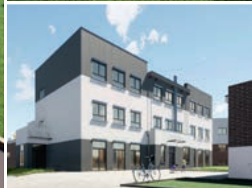
Nowe skrzydło szkoły będzie przeznaczone dla najmłodszych uczniów