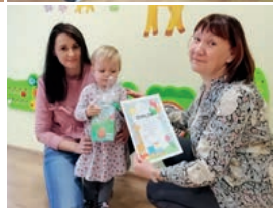
Wszystkie maluszki otrzymały pamiątkowe dyplomy

Gratulujemy wszystkim uczestnikom pięknych i kreatywnych prac.