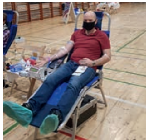
W czasie akcji 60 osób oddało łącznie 27 litrów krwi