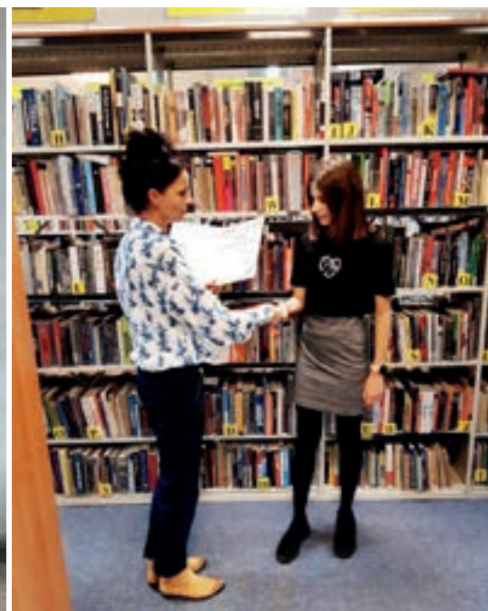
Laureatki konkursu „Opowiedz mi bajkę” w Bibliotece Publicznej w Ostrowie Wlkp.