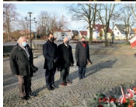
Po mszy św. złożono kwiaty pod pomnikami w Boczkwie i Nowych Skalmierzycach