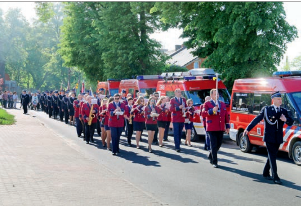
Przemarsz przy dźwiękach Miejsko-Gminnej Orkiestry Dętej