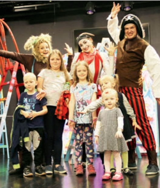
Atrakcje dla dzieci w Starym Kinie

W tzw. majowy weekend nie zapomniano także o najmłodszych mieszkańcach Gminy, dla których samorząd przygotował atrakcje w Starym Kinie. 1 maja dzieci wzięły udział w dwóch spektaklach teatralnych – „Fabryce zabawek” oraz „Koziołku Matołku i Jego Przygodach”, natomiast 2 maja wyświetlono dla nich bajkę. Wieczór zaś zarezerwowany był dla starszych, którym przedstawiono ubiegłoroczny hit kinowy „Twój Vincent” opowiadający o życiu i tajemniczej śmierci Vincenta van Gogha.