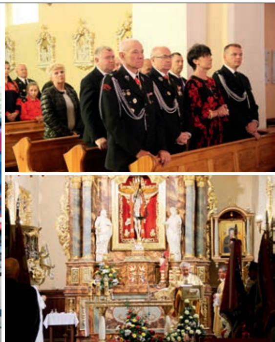
Uroczysta msza święta