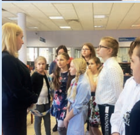
Wycieczka była okazją, aby zobaczyć funkcjonowanie banku w praktyce