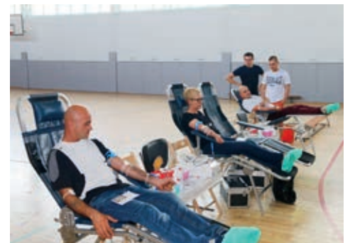
W trakcie akcji krew oddało 49 osób

Do turnieju piłkarskiego zgłosiło się piętnaście drużyn