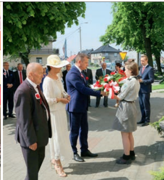
Złożenie kwiatów pod tablicą 100-lecia miasta