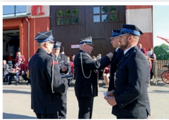
Przyznanie odznak dla strażaków

slugi, jak i Złotym Znakiem Związku. Za Panią dni, miesiące i lata, które zostały zapisane w strażackich kronikach. Za wszystkie te dni, miesiące i lata serdecznie dziękuję i zapewniam zarazem, że strażacka rodzina