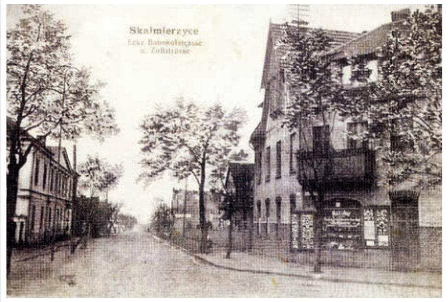
Księgarnia Maxa Josta