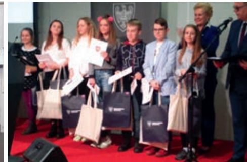
Laureaci podczas wręczenia nagród w Poznaniu

senki francuskie w wykonaniu uczniów poznańskich liceów. Na zakończenie wszyscy wspólnie zatańczyli taniec francuski.