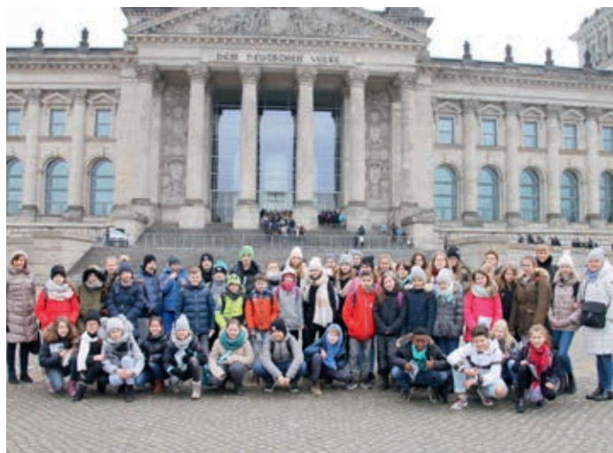
Uczniowie ze szkoły podstawowej w Nowych Skalmierzycach przed niemieckim parlamentem

16 marca od rana udaliśmy się do Poczdamu, gdzie zwiedzaliśmy imponujący Pałac Sanssouci. Po południu czas spędzaliśmy wyjątkowo w szkole – czas minął nam na wspólniej zabawie, występach i rozmowach.