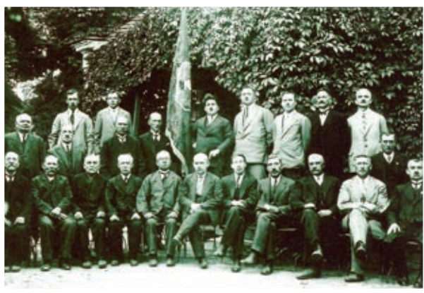
Towarzystwo Przemysłowców, Skalmierzyce