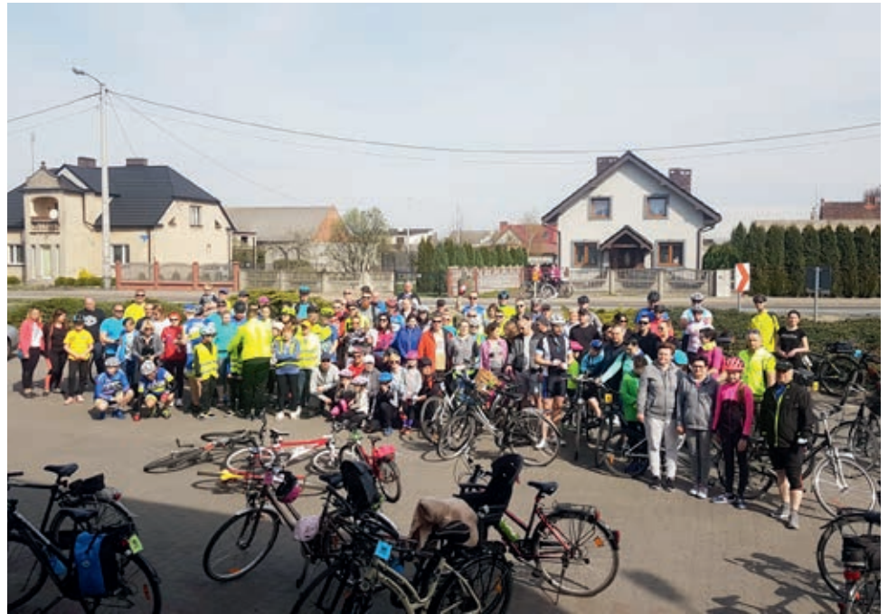
W otwarciu sezonu wzięło udział 113 rowerzystów

Dla nas jako organizatorów rajd okazał się bardzo dużym przedsięwzięciem logistycznym i organizacyjnym. Zostaliśmy zaskoczeni tak dużą frekwencją. Wpłynęło to na nas bardzo mobilizująco. Jesteśmy zado-