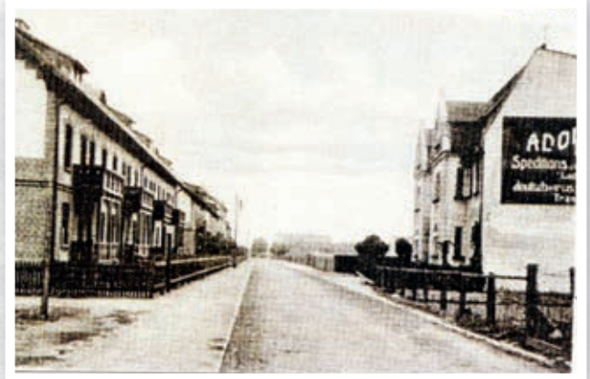
Ul. 3 Maja, dom Adolfa Imbacha

rocin, Pleszew i Ostrów i każda z nich miała wyznaczony limit pasażerów. Pociąg ten miał charakter wojskowy, dlatego podróżni cywile musieli zaopatrzyć się w stosowne pozwolenia. Ze Skalmierzyc wyruszał kolejny pociąg do Warszawy skomunikowany z pociągami poznańskim. Z dniem 1 października 1921 roku uruchomiono na trasie Poznań – Skalmierzyce już normalny pociąg osobowy nr 516 oraz pociąg zwrotny nr 515. Z Poznania pociąg wyjeżdżał o godz. 18 05 i docierał do Skalmierzyc o godz. 21 58 . Pociąg nr 515 odjeżdżał ze Skalmierzyc rano o godz. 6 40 , a w Poznaniu był o godz. 10 27 . Wszystkie pocią-