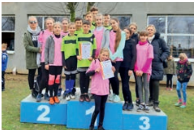
Zawody w Raszkowie