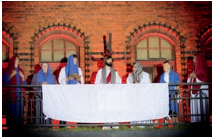
Misterium odbyło się przy budynku skalmierzycyjskiego dworca kolejowego

Pierwsze misterium odbyło się 15 kwietnia 2007 roku i stało się niezapomnianym przeżyciem zarówno dla uczestników, jak i organizatorów. Od tego momentu liczba biorących udział w uroczystości z roku na rok rośnie. Początkowo wiele osób wątpiło w sukces przedsięwzięcia, które oparte