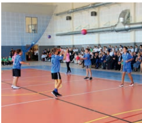
Otwarcie uświetniły pokazy artystyczne i sportowe w wykonaniu uczniów szkoły