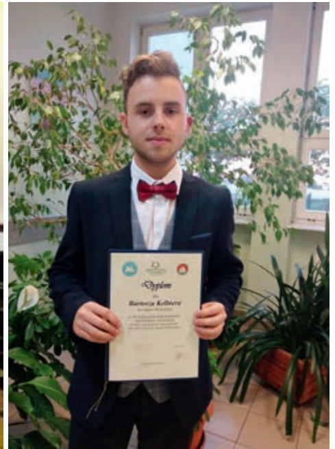
Laureaci konkursu historyczno-literackiego