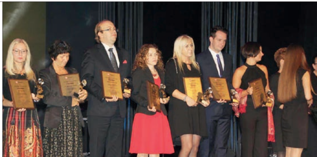
Wyróżnieni nauczyciele otrzymali pamiątkowe statuetki, dyplomy oraz nagrody finansowe