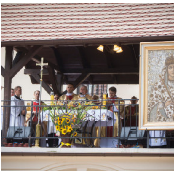
Dożynki Skalmierzyce 2