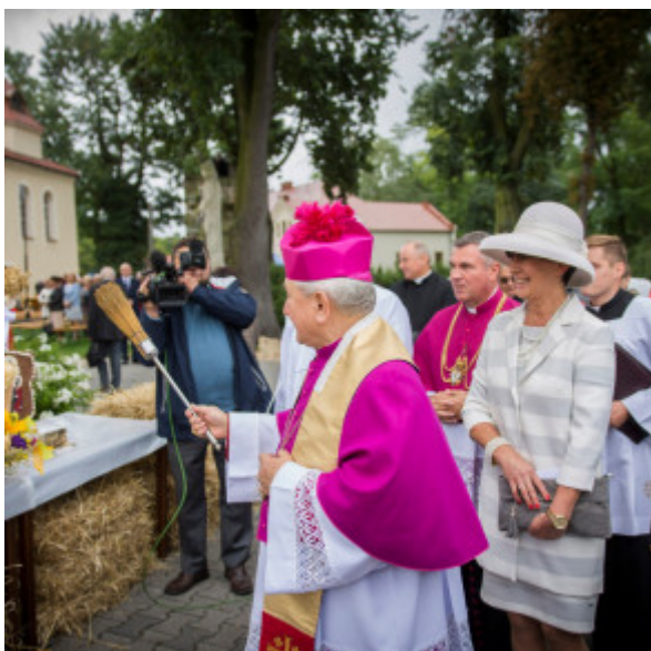
DSC 1370 1