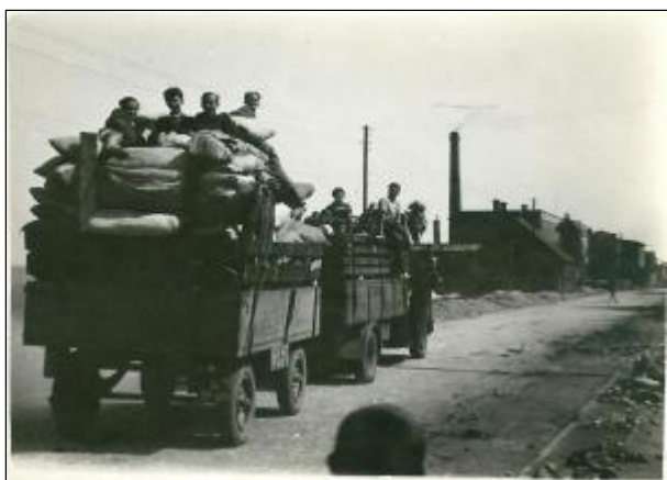
[2]Przed II wojną światową Skalmierzyce

Nowe liczyły około 2900 mieszkańców i zajmowały obszar 114,5 ha. Na tym terenie znajdowały się 153 budynki mieszkalne, w zdecydowanej większości należące do PKP. Infrastruktura komunalna obejmowała sieć kanalizacyjną przy budynkach kolejowych o łącznej długości 5840 mb. Kolejowe budynki mieszkalne posiadały sieć kanalizacyjną bez sieci wodociągowej, która prowadzona była tylko ulicami, a przy chodnikach znajdowały się punkty czerpalne wspólne dla kilku domów. Jeszcze w latach sześćdziesiątych ubiegłego wieku przy ulicach stały drewniane budki z kranami wodnymi, osłoniętymi na okres zimowy słomą, skąd mieszkańcy czerpali wodę. Większość ulic nie posiadała nawierzchni utwardzonej a chodniki z płytkami betonowymi o łącznej długości 500 m posiadały jedynie Plac Wolności (Plac Pierackiego) i ulica 3 Maja, na odcinku od ówczesnej ul. Hallera do Kaliskiej. Łączna długość dróg utwardzonych brukiem kamiennym wynosiła około 3000 m. Ulice oświetlały 44 lampy elektryczne, a wraz z nadejściem zmroku najwięcej światła dawało oświetlenie stacji kolejowej.