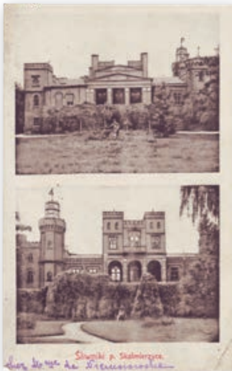
Pałac w Śliwnikach na pocztówce z początku XX w.

ciwnie był pułkownikiem w armii pruskiej? Powszechnie wiedziano, że był społecznikiem i działaczem, potomkiem powstańców, a nawet lewego skrzydła powstańców, prawnikiem albo pra-prawnikiem deputowanego z Koła Kaliskiego. Na ciemnym surducie nosił jakieś odznaczenia – może był Kawalerem Maltańskim? – i nade wszystko sobie cenił, gdy tytułowano go pułkownikiem, co chętnie czyniono”.