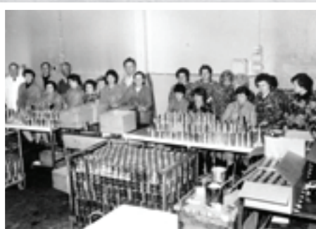
Pakowanie konserw mięsnych dla wojska