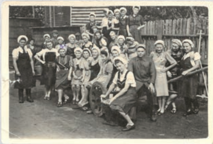
Pracownicy przetwórnicy mięsnej

W centrum Nowych Skalmierzyc przy ulicy 3 Maja znajduje się zakład o być może najdłuższej historii skalmierzycyckiego przemysłu, który po wielu przekształceniach i perturbacjach własnościowych stał się producentem karmy dla zwierząt pod nazwą „Pupil Foods”.