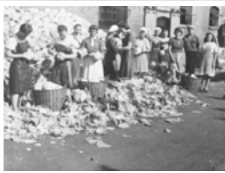
Pracownicy przetwórcy przy obieraniu kapusty