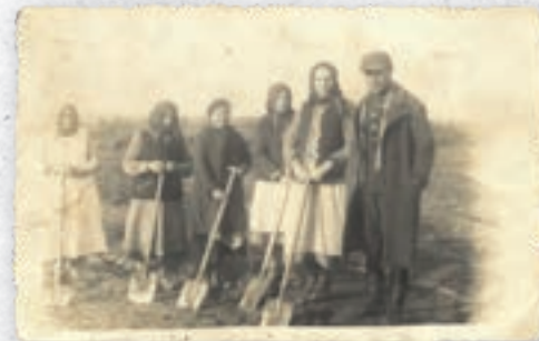
Pracownicy przetwórnicy przy pracach polowych