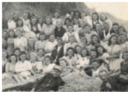
Pracownicy przetwórcy przy pracach polowych