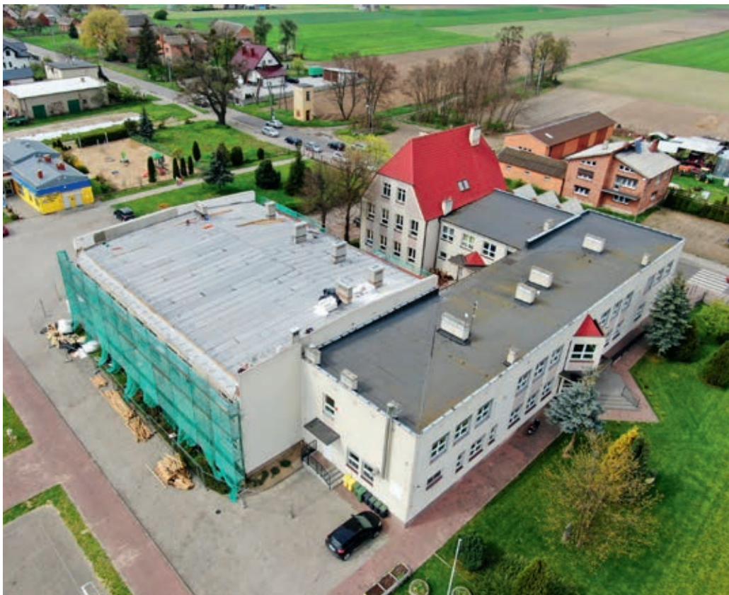
Remont dachu zakończy się przed kolejnym nowym rokiem szkolnym