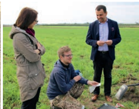
Podczas wykopaliisk znaleziono starożytne monety, zapinki i rzeczy codziennego użytku