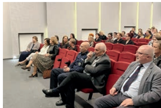
Głównym celem konferencji było podniesienie świadomości w obszarze problemu przemocy wobec najmłodszych

Przemoc wobec dzieci jest zjawiskiem wpływającym na jego wszystkie sfery rozwojowe. Rozróżnić możemy krzywdzenie fizyczne, psychiczne, zaniedbywanie i wykorzystywanie seksualne. Jest to podział teoretyczny, gdyż w praktyce wszystkie rodzaje krzywdzenia często występują łącznie i przenikają się. Należy zwrócić uwagę na fakt, że o maltretowaniu dzieci mówimy zarówno wtedy, gdy działania i zaniechania podejmowane są w sposób intencjonalny, jak i niezamierzony.