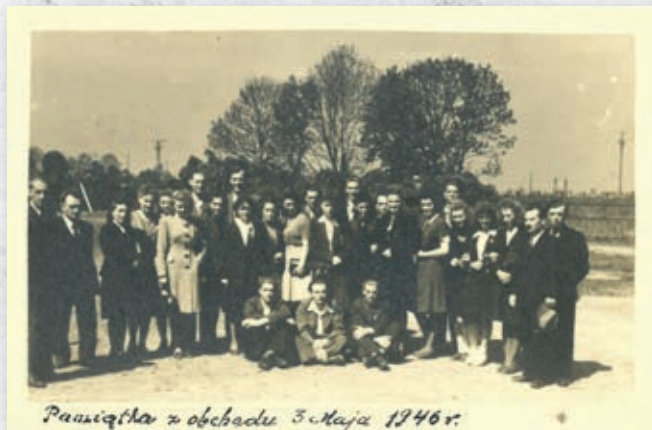
Pamiętnik z obchodu 3 Maja 1946 r.