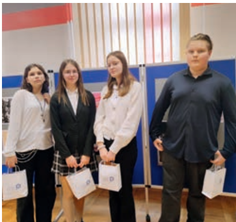
Laureaci konkursu poetyckiego podczas gali w ZSU w Ostrowie Wielkopolskim

Podczas uroczystej gali, która odbyła się 28 marca w Zespole Szkół Usługowych w Ostrowie Wielkopolskim, miał miejsce koncert poetycki połączony z prezentacją jubileuszowego tomiku, w którym znalazły się najlepsze wiersze dziesięciolecia, a wśród nich teksty absolwentów naszego