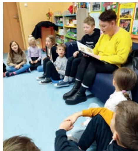
Celem projektu jest zachęcanie dzieci do samodzielnego czytania

Czytanie poszerza wiedzę o świecie i człowieku, doskonali pamięć, rozwija świat uczuć i myśli, uczy myślenia. Jedno-