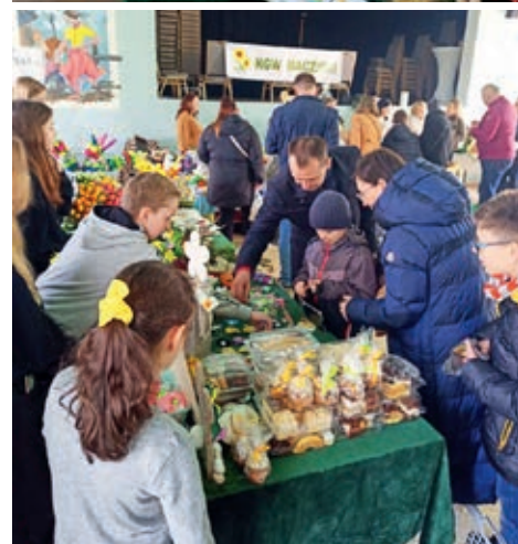
Podczas kiermaszu można było nabyć ozdoby wielkanocne wykonane przez uczniów