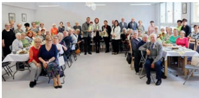
Wielkanoc w Klubie Senior+

– za każdym razem mamy możliwość włączenia się czynnie do rozmowy. Większość Seniorów zgodnie stwierdziła, że mimo iż czas powojenny był bardzo trudny, to ludzie byli dla siebie dobrzy i życzliwi i za tym Seniorzy tęsknią.