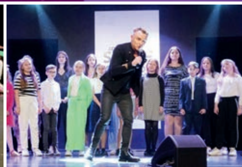
Koncert w Starym Kinie był rezultatem warsztatów wokalnych