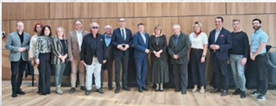
Uczestnicy zebrania w dniu 17 kwietnia 2026 roku, podczas którego reaktywowano Towarzystwo Miłośników Ziemi Skalmierzyckiej

Ochrona dziedzictwa kulturowego regionu skalmierzyckiego przybrała w ostatnim czasie na sile. Przed kilkoma miesiącami władzom gminy udało się pozyskać środki na rewitalizację zabytkowego dworca kolejowego w Nowych Skalmierzycach, a w maju bieżącego roku swoje podwoje otwiera Izba Pamięci Ziemi Skalmierzyckiej. Kolejnym sukcesem na tym polu jest reaktywacja Towarzystwa Miłośników Ziemi Skalmierzyckiej, która miała miejsce 17 kwietnia br.