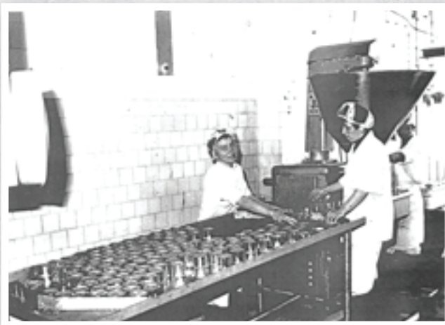
Produkcja konserw mięśnych

W tych jakże trudnych powojennych czasach, szczególnie w sferze zaopatrzeniowej w żywność, dostrzec można wyjątkową rolę skalmierzycy przetwórnicy w dostarczaniu na rynek spożywczy wielu wartościowych i poszukiwanych towarów. Niezwykle pozytywny wydzźwięk posiadają informacje o wielkości i asortymencie produkcji. W skali całego kraju dopiero od 1 listopada 1948 roku zniesiono reglamentację chleba. Problem zaopatrzenia był od dawna niezwykle istotny w gminie Skalmierzyce Nowe, gdyż wielu z czytelników zapewne pamięta długie kolejki i godziny wyczekiwania za chlebem przed piekarnią przejętą przez GS od rodziny Pussaków przy ul. 3 Maja. Także w piekarni B. Stasiaka już od godz. 5.00 rano ustawiała się kolejka po chleb, jeszcze w okresie stanu wojennego.