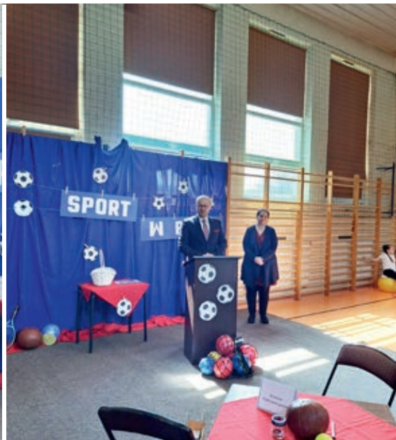
Szkoła Podstawowa w Gostyczynie jest organizatorem konkursu od 17 lat