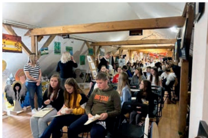
Uczestnicy musieli zmierzyć się z pytaniami dotyczącymi historii miejscowości z terenu gminy