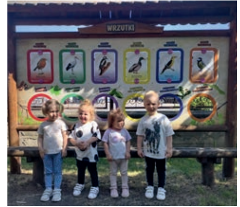
Dzieci uczestniczyły w różnorodnych aktywnościach związanych z bocianem białym

Podsumowując: obchody były doskonałą okazją do integracji dzieci z naturą, rozwijania ich zainteresowań przyrodniczych oraz rozwijania kreatywności i zdolności manualnych. Dzieci z zapałem angażowały się w różnorodne aktywności, które nie tylko dostarczały im radości, ale także uczyły wartości związanych z poszanowaniem środowiska. To kolejny dowód na to,