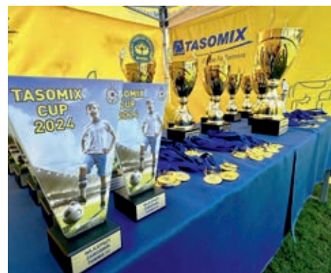
W turnieju wzięło udział łącznie 20 drużyn