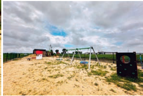
W pobliżu drewnianej altany w Gniazdowie pojawił się plac zabaw