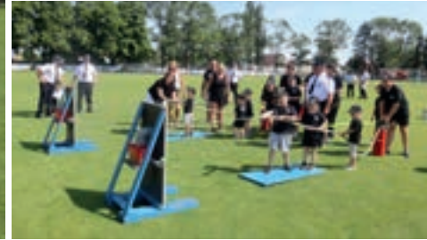
W zawodach wzięło udział 15 drużyn z 6 jednostek OSP