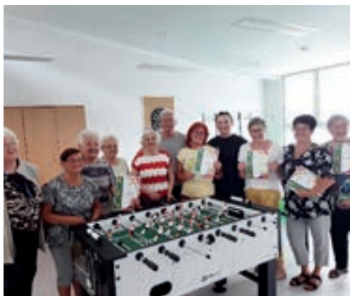
Sportowe Mistrzostwa Seniorów