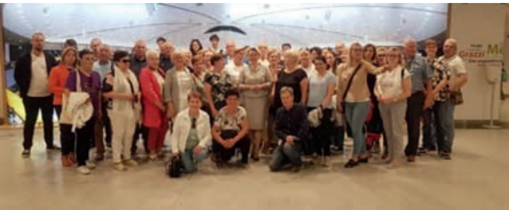
Wycieczka do Brukseli