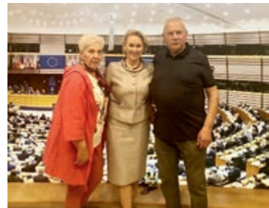
Wycieczka do Brukseli