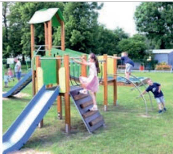
Po części oficjalnej dzieci zabrały się do testowania nowych urządzeń