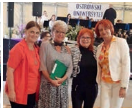
Jubileusz 15-lecia OUTW