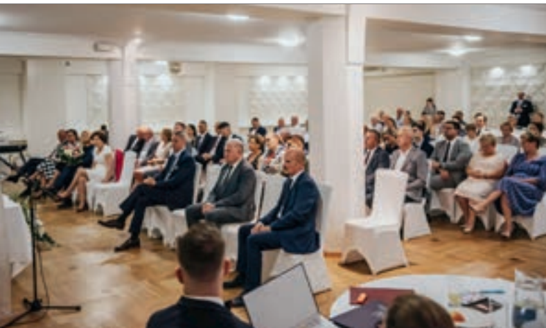
Sesja Rady dla uhonorowania osób zaangażowanych w rozwój Gminy i Miasta:...