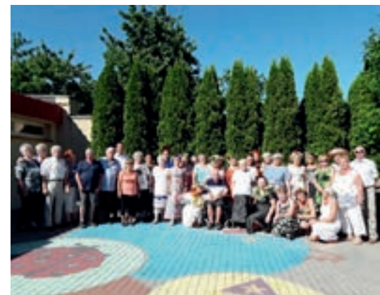
Piknik Nocy Świętojańskiej