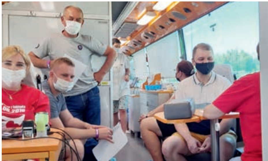
W dniu akcji krew oddało 27 osób