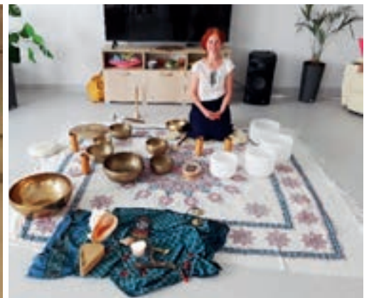
Koncert mis tybetańskich i kryształowych