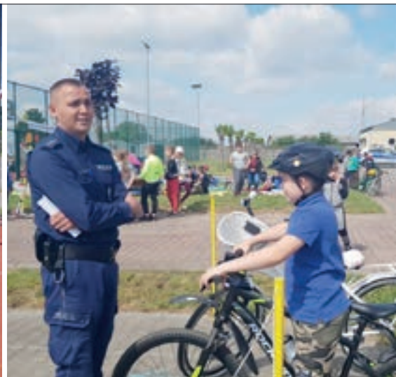
Policjanci nadzorowali bezpieczny przejazd na specjalnie przygotowanym torze