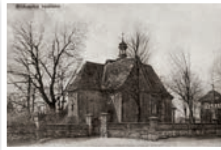
Kościół 1913 r. Biskupice Szalone