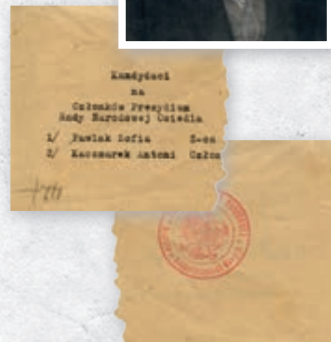
Kartka do głosowania Prezydium Rady Narodowej osiedla w Skalmierzycach Nowych