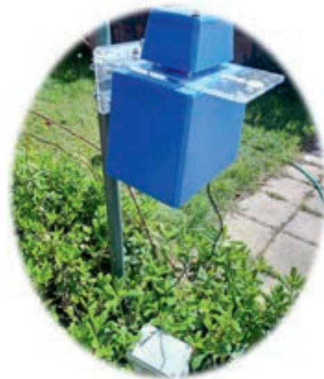
Urządzenie rejestrujące zanieczyszczenia atmosfery