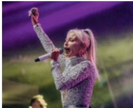
Występ zespołu MEJK

poczęto akcentem sportowym. W obrębie drużyn KS „Pogoń” rozgrywano mecze w ramach Dnia Piłkarza, a w turnieju pod patronatem burmistrza rywalizowali ze sobą szachiści – od kilkuletnich dzieci po najstarszego zawodnika liczącego 78 lat. W kategorii open zwyciężył Ukrainiec Dmy-