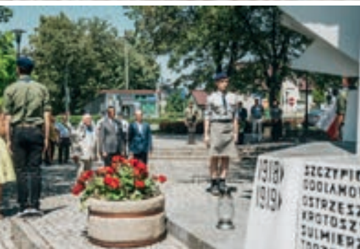
Złożenie wiązanek pod pomnikiem Powstańców Wielkopolskich