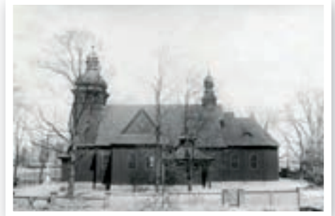
Kościół po rozbudowie - koniec lat 40. XX wieku