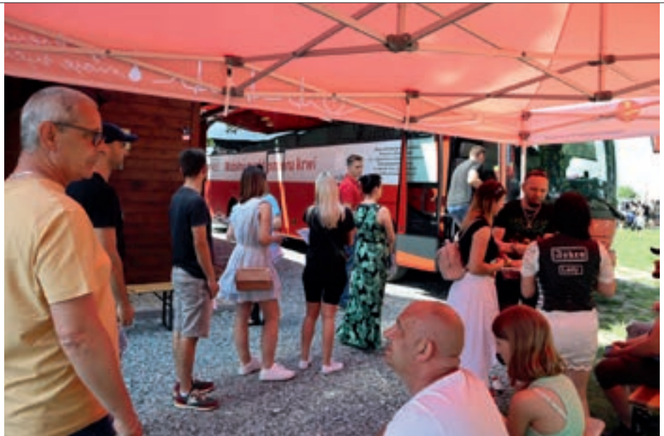
Akcja ma na celu propagowanie idei honorowego krwiodawstwa