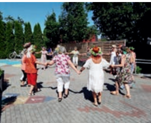
Piknik Nocy Świętojańskiej