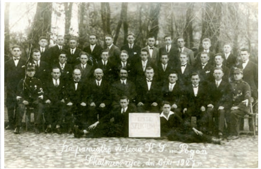
VI-lecie KS „Pogoń”, Skalmierzyce, 6.11.1927

Wraz z powstaniem KPW w Skalmierzycach Nowych w jego struktury wszedł Klub Sportowy „Pogoń”. Kierownictwo KPW, kładąc duży nacisk na propagowanie sportu, postanowiło rozbudować miejscowy stadion. Z pomocą materialną pospieszyły władze kolejowe, przekazując na ten cel 18-morgową działkę przylegającą do terenów sportowych „Pogoni”. Władze administracyjne starostwa ostrowskiego oraz województwa poznańskiego udzieliły wsparcia finansowego, zatrudniając na dwa miesiące grupę 45 bezrobotnych. Także pracownicy kolejowi przepracowali bezinteresownie 3600 godzin przy niwelacji i plantowaniu boisk oraz pozostałych obiektów sportowych. Przy ogromnym zaangażowaniu miejscowej społeczności kolejowej udało się wybudować boisko do piłki nożnej, siatkowej i koszykówki. Powstały tereny pod korty tenisowe, płotki do ćwiczeń fizycznych, skocznie i bieżnia lekkoatletyczna. Rozbudowano też strzelnicę sportową otoczoną trzymetrowym wałem zabezpieczającym oraz trzypiętrową wspinalniami do ćwiczeń drużyn strażackich. Za tymi obiektami przygotowano teren pod budowę otwartego basenu pływackiego, który zrealizowano dopiero w połowie lat pięćdziesiątych. Do tego czasu korzystano z kąpeli w znajdującym się tam zbiorniku wodnym należącym do pobliskiego folwarku Podkoce. Duże wrażenie na uczestnikach uroczystości otwarcia stadionu zrobili