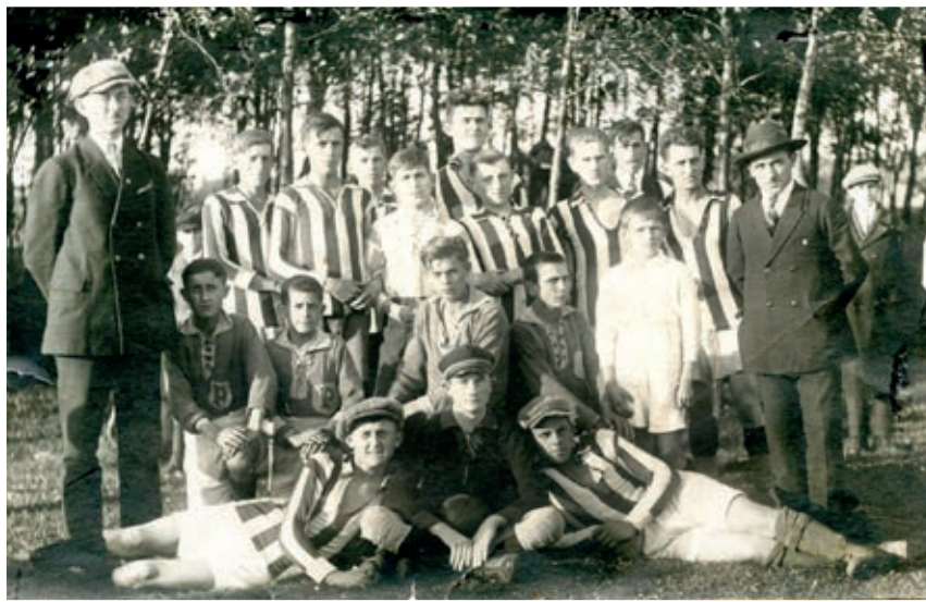
Klub Sportowy „Legia”