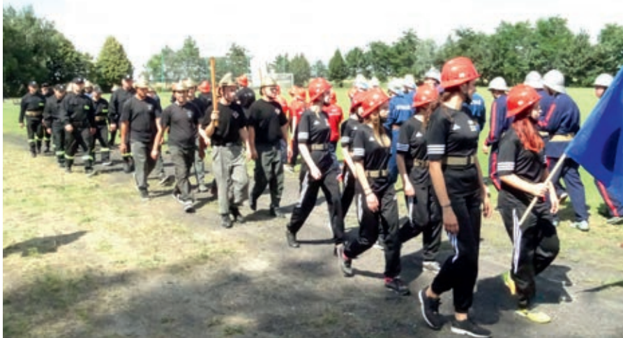
W turnieju wzięło udział kilkanaście drużyn

8 lipca 2018 r. na boisku sportowym w Raszkowie odbyły się 15. Powiatowe Zawody Sikawek Konnych, w których udział wzięło kilkanaście 7-osobowych drużyn ochotniczych straży pożarnych, w tym zespoły z jednostek OSP z terenu Gminy i Miasta Nowe Skalmierzyce – Biskupic Ołobocznych, Boczkowa i Gostyczyń.