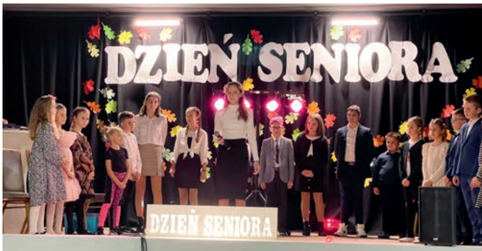
Program artystyczny w wykonaniu uczniów szkoły w Skalmierzycach

Wszystkim wciąż młodym duchem seniorom złożono najserdeczniejsze życzenia i wręczono kwiaty, jednak największy entuzjazm wywołał program artystyczny w wykonaniu uczniów Szkoły Podstawowej im. Adama Mickiewicza w Skalmierzycach. W słowach wierszy i piosenek wnułkowie złożyli podziękowania dziadkom za ich rady, pomoc i uśmiech, doceniając w ten