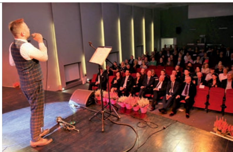
Galę uświetnił występ zespołu jazzowego Gentle Swing

Nr 2 „Pod Kasztanami” w Nowych Skalmierzycach