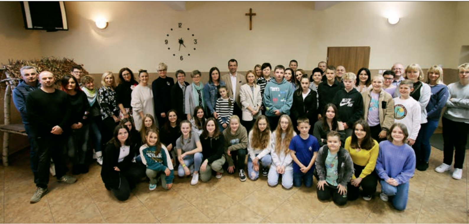
Spotkanie podsumowujące pobyt