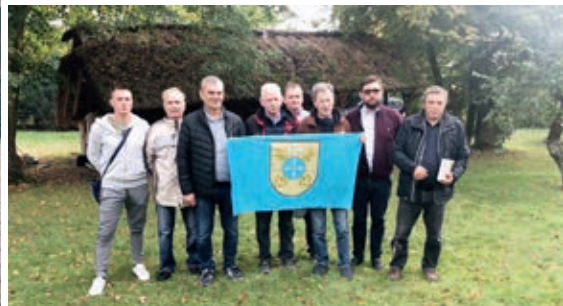
Wyjazd był okazją do wymiany doświadczeń oraz zgłębienia wiedzy na temat hodowli pszczół