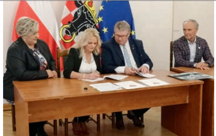
Dofinansowanie do mobilnej kuchni otrzymało KGW Leziona