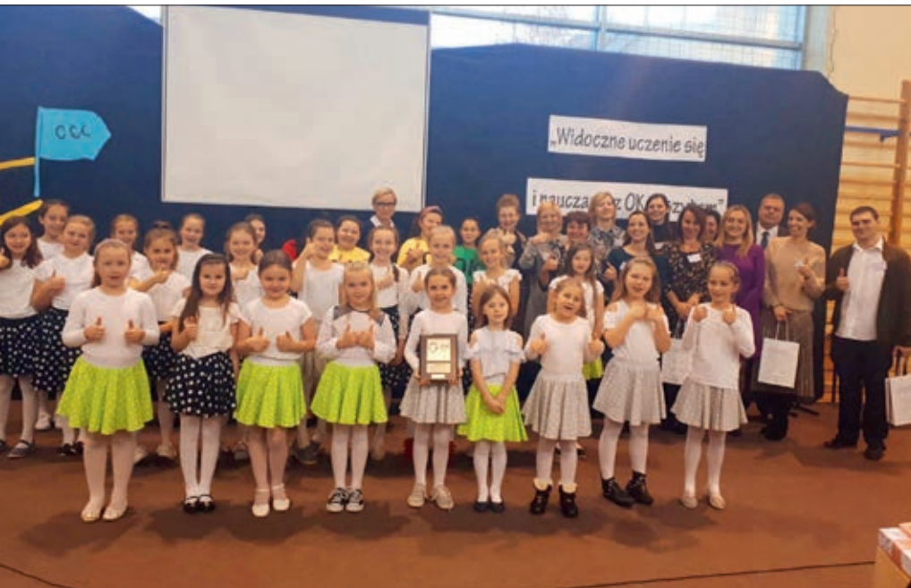
To już druga konferencja o OK zeszytach w ramach programu Szkoła Ucząca Się