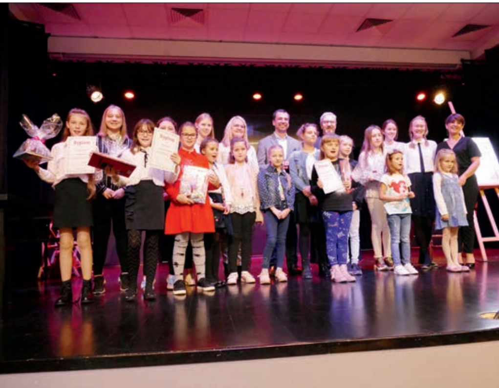
Laureaci konkursu plastycznego