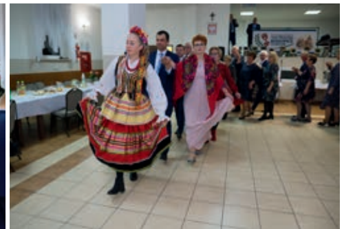
W zabawie w Biskupicach Ołobocznych wzięło udział 120 osób

ficie korzystamy z ich życiowej mądrości. Nic więc dziwnego, że postać sędziwego mędrca znalazła trwałe miejsce w światowej kulturze. Wrażliwość na osoby starsze jest istotną cechą cywilizacji. Cywilizacja będzie się rozwijała, jeśli potrafi szanować rozsądek, mądrość osób starszych.