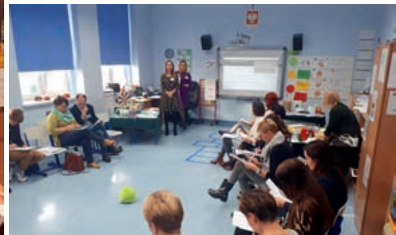
Warsztaty dla nauczycieli