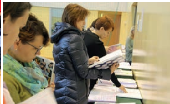
Uczestnicy mogli obejrzeć wystawę uczniowskich OK zeszytów

i rozwiązania metodyczne także wzbudziły zainteresowanie i często stanowiły pretekst do dzielenia się warsztatem pracy. Podsumowując, relacje, wymiana doświadczeń, rozmowy, wzajemne uczenie się, to najlepsza droga do rozwoju, zarówno nas dorosłych, jak i naszych uczniów.