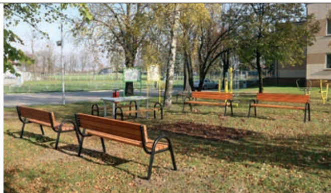
OSA to miejsca rekreacji i aktywności ruchowej, mające sprzyjać integracji mieszkańców