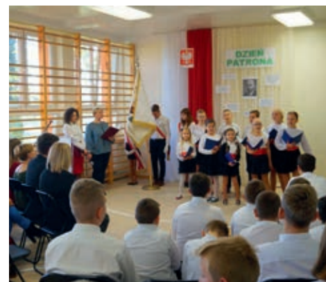
Część artystyczna dotycząca patrona szkoły

Kulminacyjnym punktem uroczystości okazały się poprowadzone w klasach przez wychowawców warsztaty. Zadaniem każdej klasy było wykonanie wspólnie z rodzicami prac dotyczących życia i pracy patrona. Owocem tych działań stała się niepowtarzalna i wyjątkowa wystawa w postaci gze-