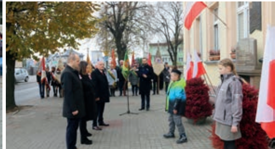
Złożenie wiązanek kwiatów pod tablicą upamiętniającą odzyskanie niepodległości