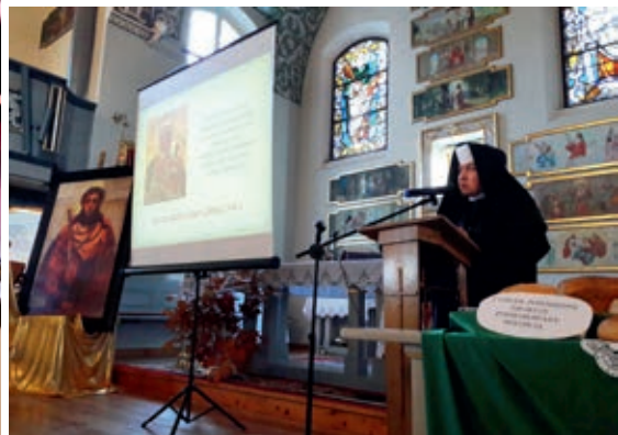
Prelekcja dot. św. Brata Alberta