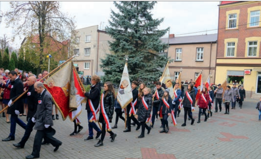
Przemarsz pocztów sztandarowych