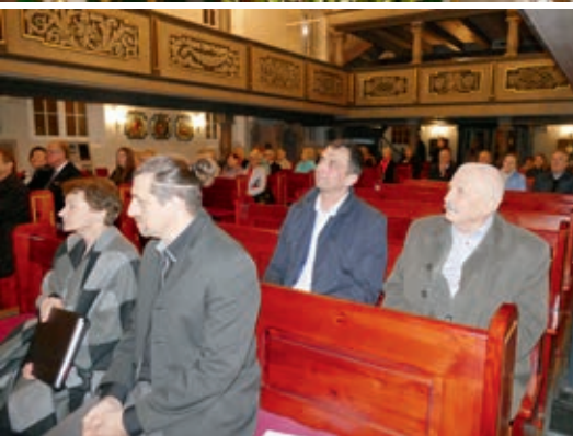
Spotkanie zakończyło się mszą świętą