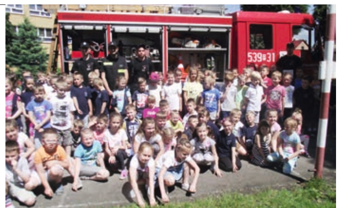
Dzieci mogły obejrzeć z bliska wóz strażacki

Spotkanie było dobrą okazją do utrwalenia poznanych numerów alarmowych i sposobu zgłaszania wypadków. Wizyta przebiegała w miłej i wypełnionej emocjami atmosferze. Wśród dzieci byli chłopcy, którzy po spotkaniu snuli marzenia, jak dzielnymi strażakami będą w przyszłości. Miłym gościom