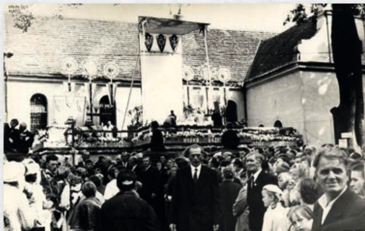
Podium zbudowane na potrzeby koronacji