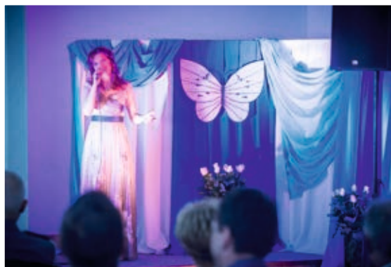
Uroczystą sesję Rady Gminy i Miasta zakończył recital piosenek Anny German