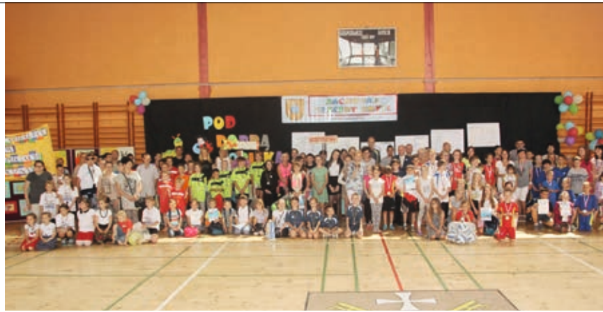
Uczestnicy 16. finału kampanii „Zachowaj Trzeźwy Umysł”