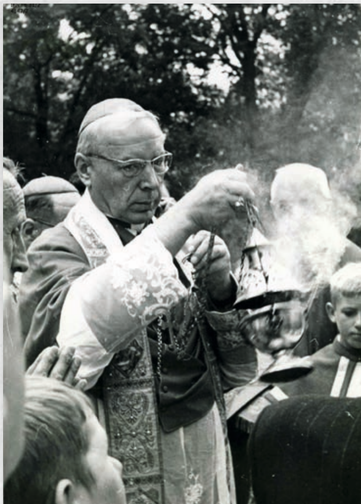
Ks. kard. Stefan Wyszyński