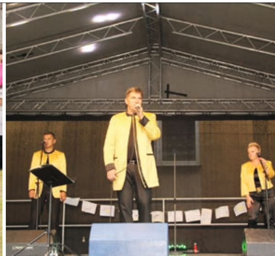
Koncert zespołu Bayer Full

Nie brakowało innych atrakcji. Wszystkie dzieci mogły zaszaleć we wspólnym