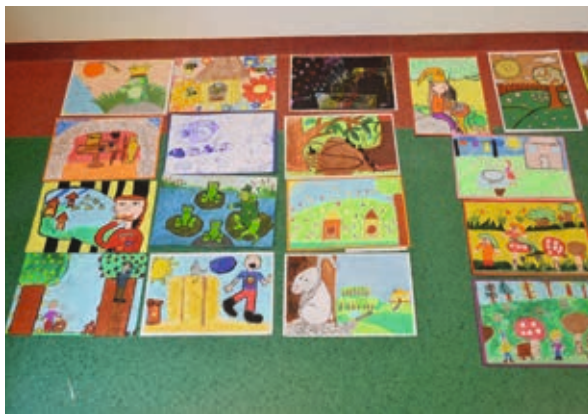
Prace biorące udział w konkursie