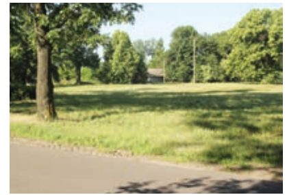
Teren przeznaczony pod budowę świetlicy w Kurowie

Specyfikacje techniczne obydwu świetlic zakładają wybudowanie praktycznie dwóch jednakowych obiektów. Będą to parterowe budynki o długości 7,23 metra