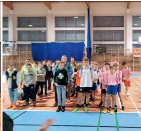
Uczestnikami turnieju było sześć szkół z terenu gminy