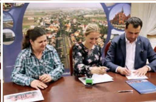
Podpisano 32 umowy na projekty organizacji pozarządowych

danie pt. „Festyn pn. „Spotkanie pokoleń – od najmłodszych po najstarszych”