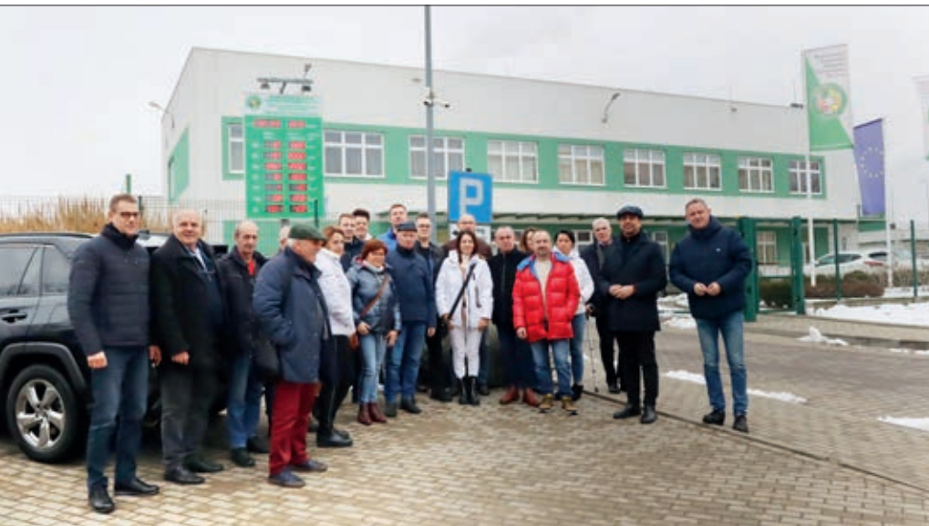
Radni wraz z burmistrzem odbyli wyjazd studyjny do spalarni odpadów w Koninie. Podobne wyjazdy planowane są dla mieszkańców