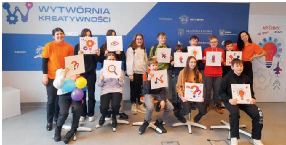
Uczniowie podczas wycieczki do Wytwórni Kreatywności w Kaliszu