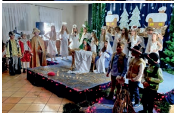
Na scenie panował wyjątkowo świąteczny nastrój