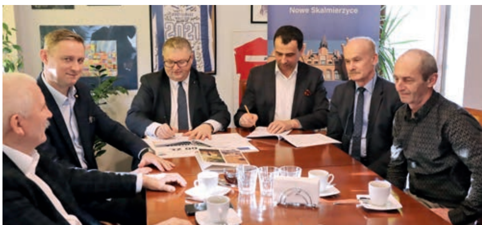
W Czachorach powstanie nie tylko plac zabaw, ale i drewniana wiatra oraz siłownia

Pierwsze ze wspomnianych zadań zakłada montaż drewnianej wiaty, siłowni zewnętrznej oraz urządzeń zabawowych. Jak podkreśla burmistrz podobne inwestycje