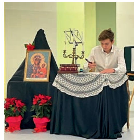
Uczniowie przygotowali inscenizację przybliżającą życie patrona szkoły