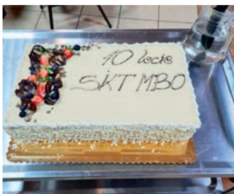
Jubileusz był okazją do podsumowania dziesięcioletniej działalności stowarzyszenia