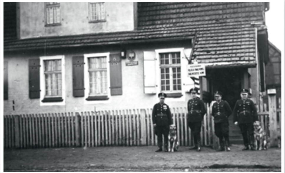
Policjanci przed posterunkiem

Rok 1928 był czasem wielkiego kryzysu gospodarczego i zastoju w gospodarce, co przekładało się na wzrost przestępczo-