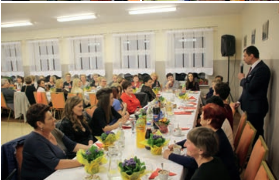
Tego dnia Dzień Kobiet obchodzonego w pięciu miejscowościach Gminy i Miasta Nowe Skalmierzyce