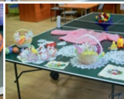
Seniorki wykonały koronkowe ozdoby wielkanocne