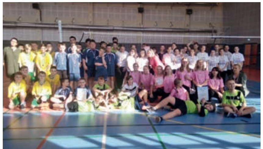
W zawodach rywalizowały trzy szkoły podstawowe z terenu gminy