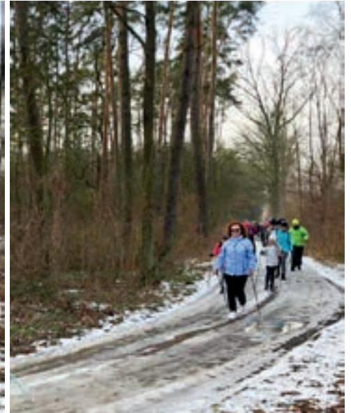
W inauguracji sezonu kijkowego wzięło udział ponad 60 osób