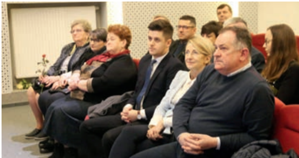
Uczestnicy spotkania obejrzeni również film o „Żołnierzach Wyklętych”