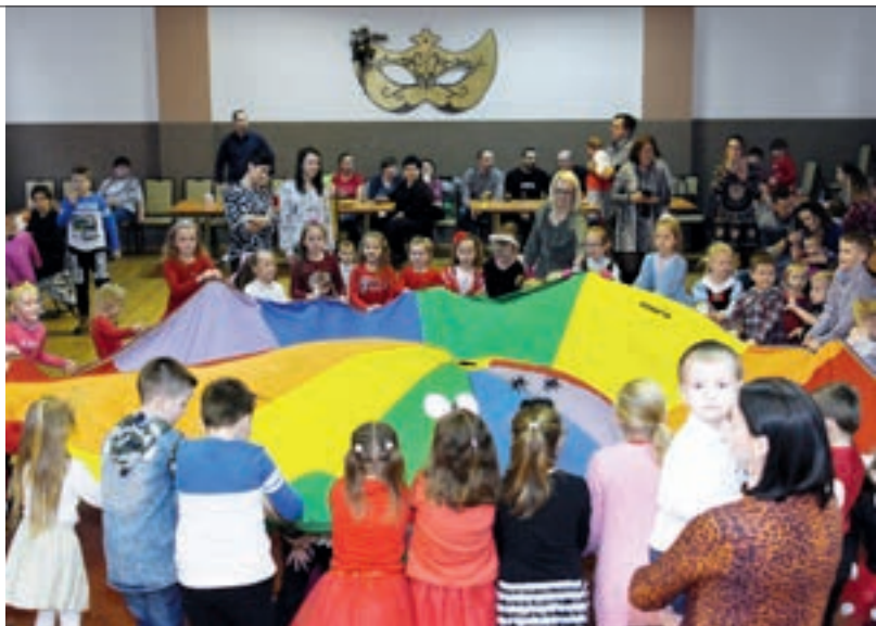
W zabawie walentynkowej wzięło udział około 90 dzieci