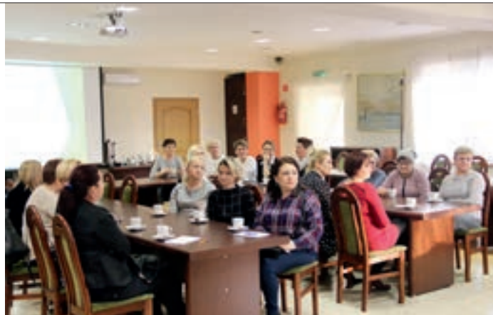
Na terenie Gminy i Miasta Nowe Skalmierzyce działa czternaście zarejestrowanych kół