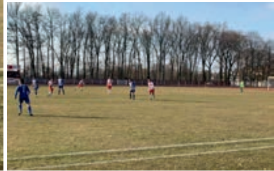
KS Pogoń Nowe Skalmierzyce wygrała mecz z MKS Olimpia Koło 2:1