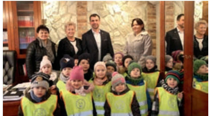
Przedkolaki z „Jarzębinki” odwiedziły burmistrza Gminy i Miasta Nowe Skalmierzyce