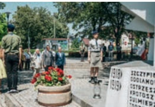
Złożenie wiązanek pod pomnikiem Powstańców Wielkopolskich