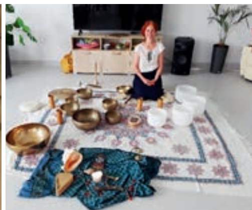
Koncert mis tybetańskich i kryształowych