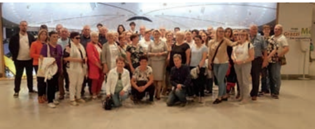
Wycieczka do Brukseli