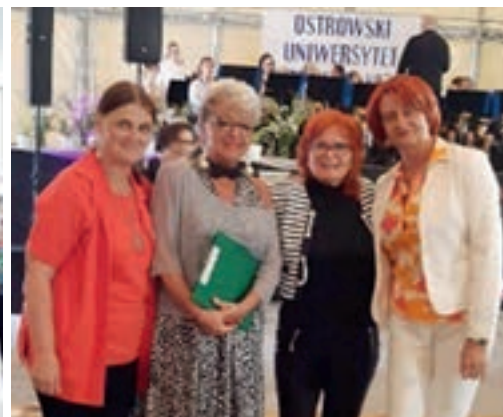
Jubileusz 15-lecia OUTW