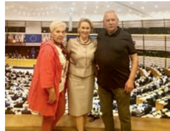
Wycieczka do Brukseli