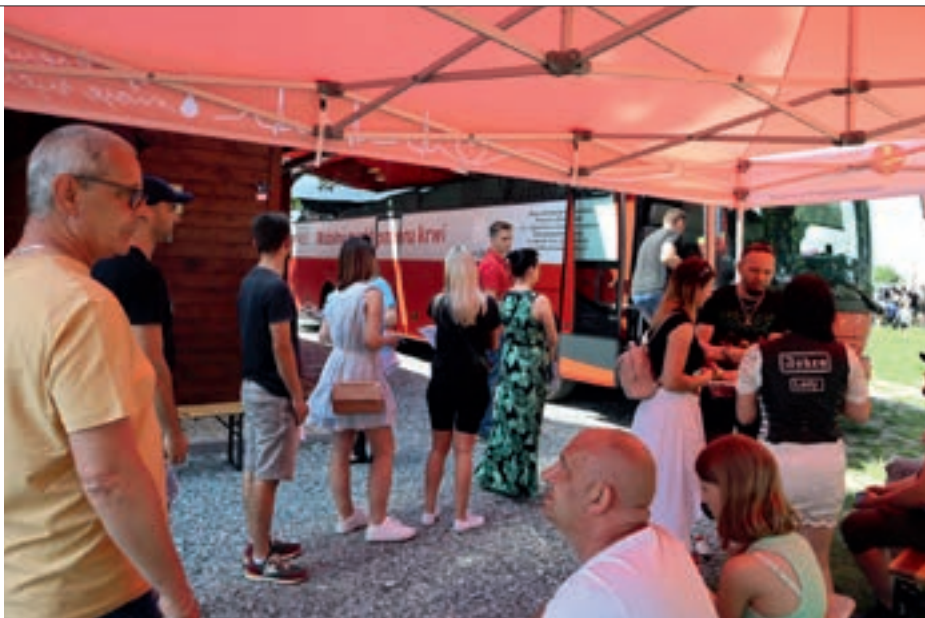
Akcja ma na celu propagowanie idei honorowego krwiodawstwa