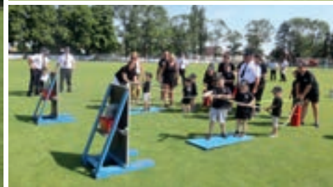
W zawodach wzięło udział 15 drużyn z 6 jednostek OSP