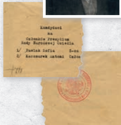
Kartka do głosowania Prezydium Rady Narodowej osiedla w Skalmierzycach Nowych