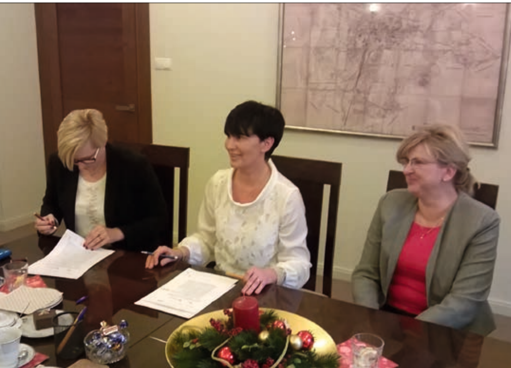
Akt notarialny dotyczący przekazania dworca podpisano 29 grudnia 2015 r. w Poznaniu