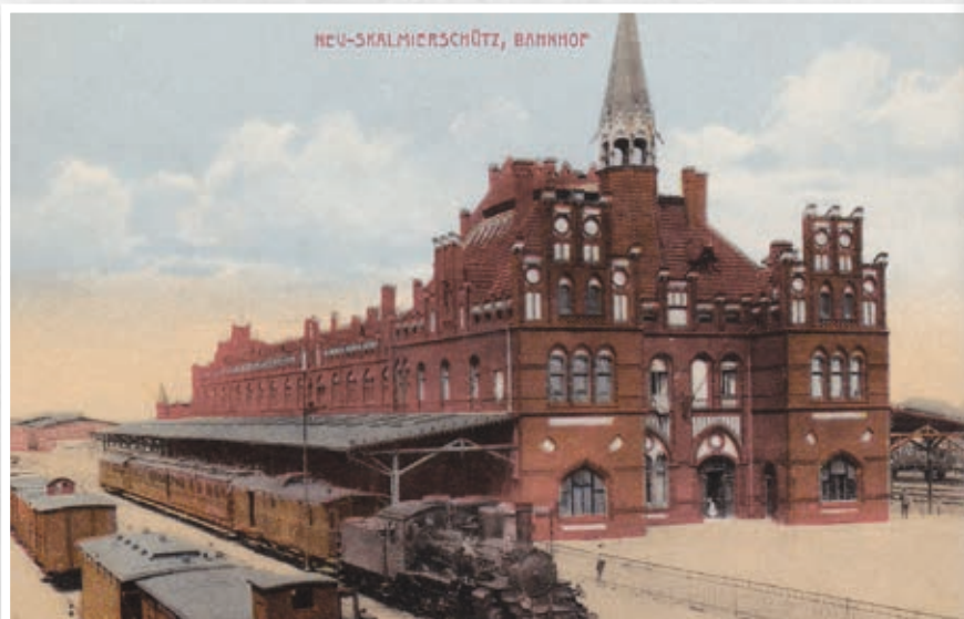
Dworzec na pocztówkach z początku XX wieku