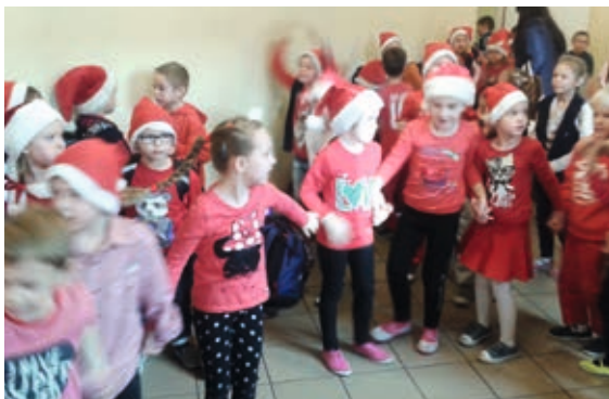
Dzień Czerwonych Mikołajków

Następne zadanie to konkurs „Świąteczny Aniołek” zorganizowany dla dzieci z klas I – VI. Prace mogły być wykonane w dowolnej technice i z dowolnych materiałów. Kreatywność i zapał twórczy dzieci zaowocował oryginalnymi pracami, które można było podziwiać na wystawie szkolnej już od 6 grudnia. Na świątecznym apelu poznaliśmy uczestników i laureatów konkursu, którzy otrzymali dyplomy i nagrody.