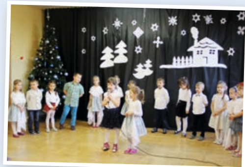
Przedszkolaki z grupy „Jaworowej” przygotowały przedstawienie o tematyce bożonarodzeniowej