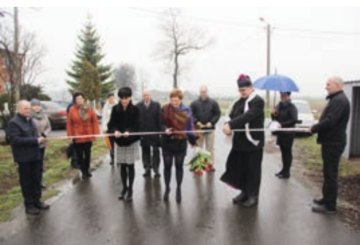
Uroczyste otwarcie drogi