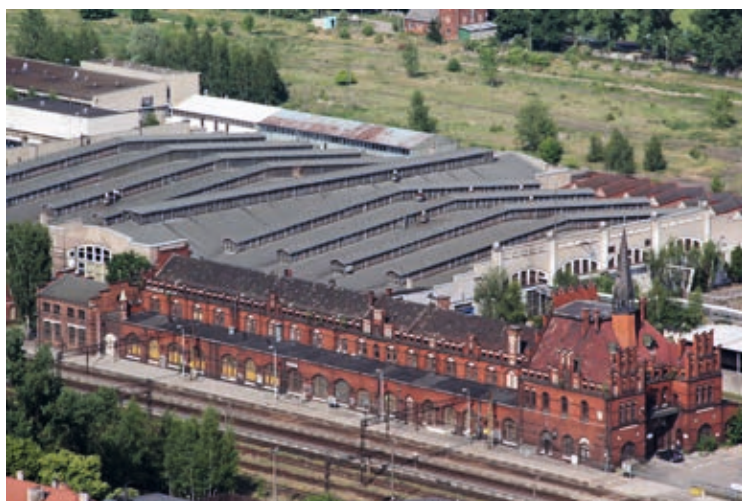
Koszty doprowadzenia budynku do świetności szacowane są na kilkadziesiąt milionów złotych

ni ponad 3000 m 2 zachwyca mnogością detali architektonicznych, kunsztem wykonania a także bogatą historią. Ten wyjątkowy budynek, zaliczany do grupy najpiękniejszych dworców, kończy w 2016 roku 110 lat. Skąd taki budynek w tym