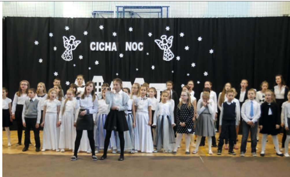
Świąteczny występ uczniów Szkoły Podstawowej im. A. Mickiewicza w Skalmierzycach