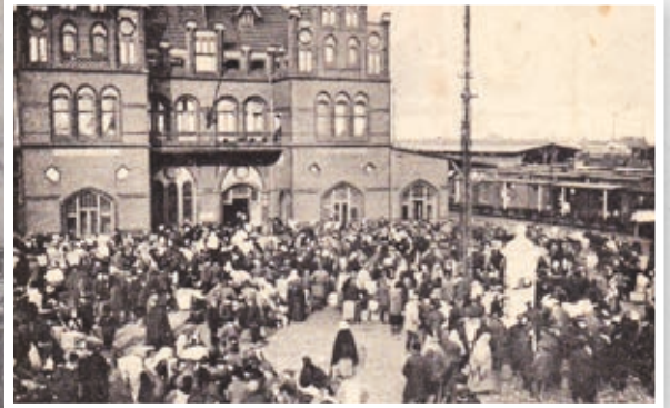
Luksusowa poczekalnia I oraz II klasy oraz plac przed dworcem