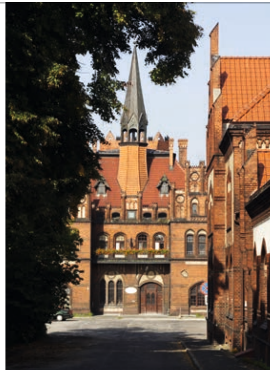
Po remoncie dworzec miałby pełnić funkcje m. in. kulturalne