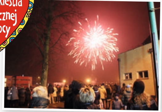
Skalmierzyckie świątełko do nieba