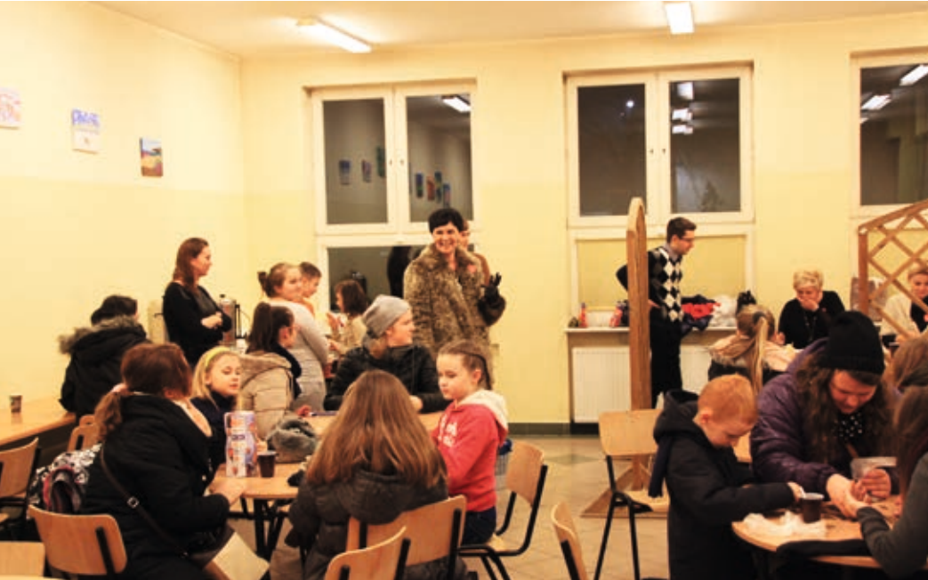
Sztab akcji mieścił się w gimnazjum