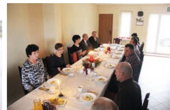
Po części oficjalnej udano się do świetlicy na poczęstunek