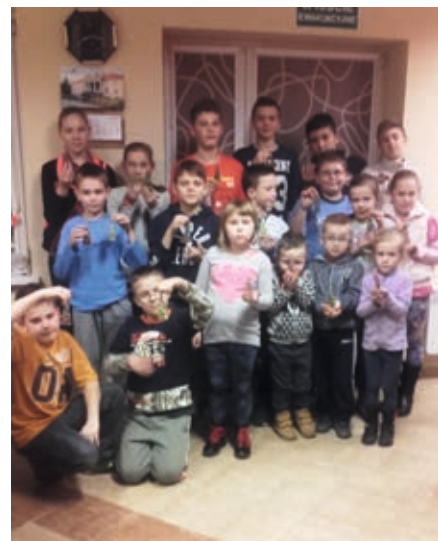
Dzieci z Miedzianowa ze swoimi pracami