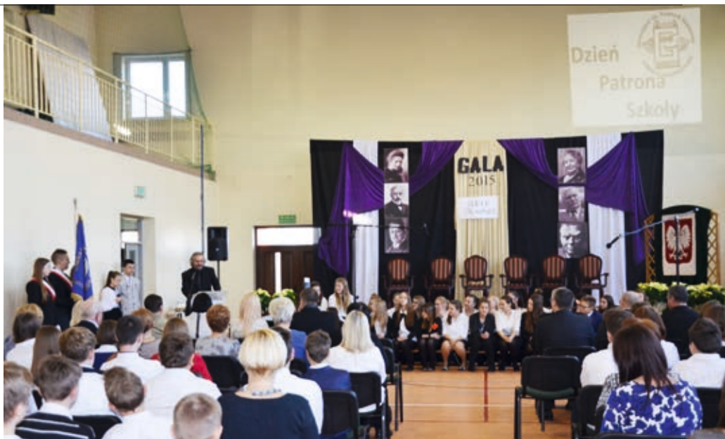
Obchody zakończyło przedstawienie „Super Henryki”

Tradycją jest, że Dzień Patrona to okazja do wyróżnień uczniów szczególnie zaangażowanych w życie szkoły i społeczności lokalnej. Tytuł „Osobowość Roku 2015”