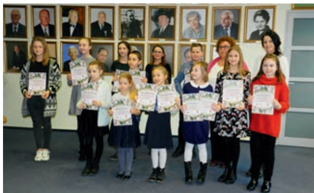
Laureaci Powiatowego Konkursu Literackiego w ostrowskiej bibliotece