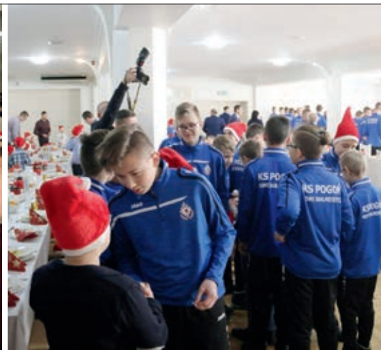
Wspólny opłatek w gronie piłkarzy i trenerów