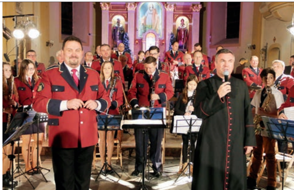
Miejsko-Gminna Orkiestra Dęta wystąpiła w Skalmierzyckim Sanktuarium Maryjnym z repertuarem kolęd

Wszystkie te opowieści stanowiły piękne tło dla wygrywanych przez orkiestrę w sposób doniosły i radosny utworów – głównie polskich kolęd („Gdy się Chrystus rodzi”, „Dzisiaj w Betlejem”, „Anioł pasterzom mówił”,