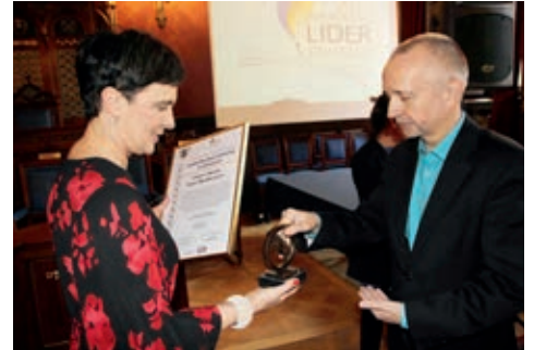
Wręczenie nagrody „Lider Bezpieczeństwa w Oświacie”

Pragniemy pogratulować Państwu sukcesów w dziedzinie lokalnej polityki oświatowej, w tym nowatorskich pomysłów, twórczych rozwiązań, oryginalnych projektów, zaangażowania w sprawy uczniów i nauczycieli oraz wrażliwości na problemy społeczne w sferze edukacji, które w warunkach reformowania oświaty stają się szczególnie ważne. Czujemy