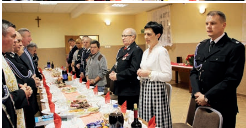
Uczestnicy spotkania opłatkowego