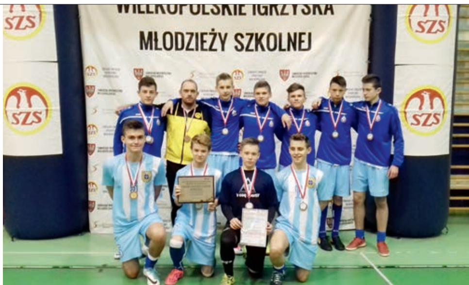
Brązowi medaliści wojewódzkiego turnieju w piłce nożnej halowej

W finale zagraliśmy z naszym grupowym rywalem - SP 2 Ostrzeszów. Mecz również