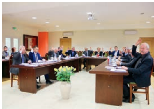
Głosowanie nad budżetem