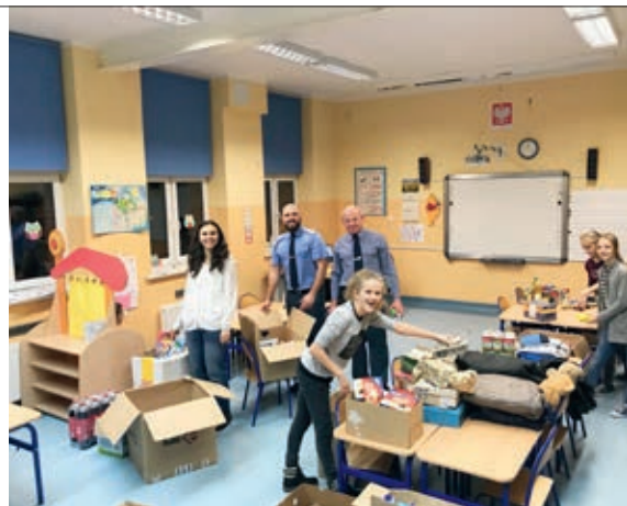
Uczniowie zaangażowali się w akcję po raz drugi