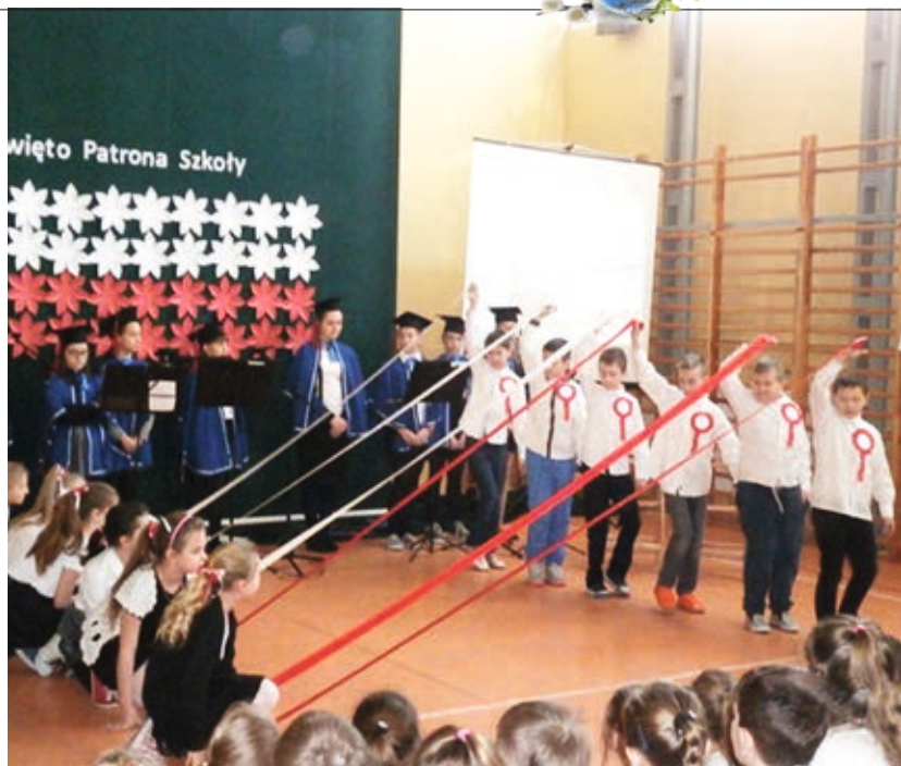
Akademia z okazji Dnia Patrona Szkoły