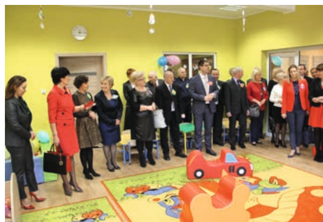
Budowa żłobka kosztowała ponad 1 mln 550 tys. zł