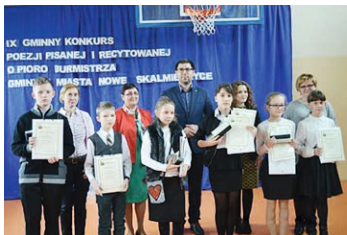
Celem konkursu było m.in. promowanie czytelnictwa wśród dzieci

roczny konkurs poświęcony był powyższej tematyce.