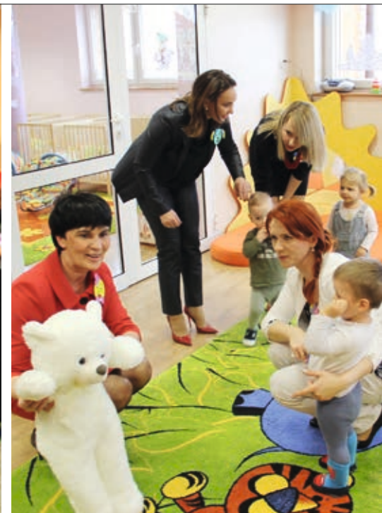
Goście przekazali dzieciom podarki i zabawki ▲ ◀Przecięcie wstęgi