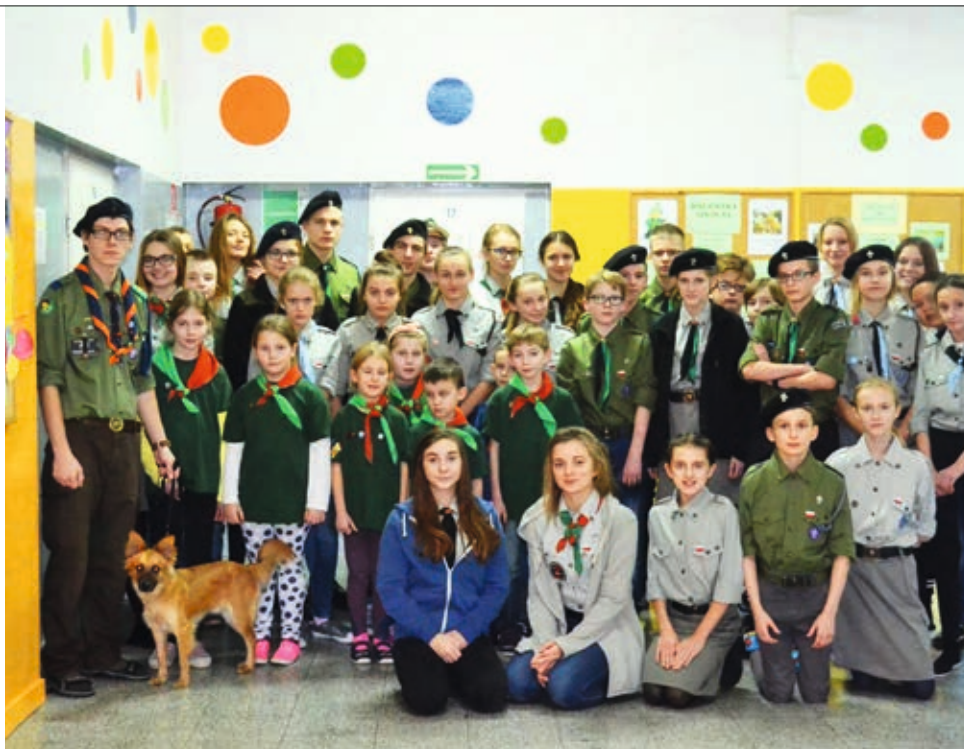
Uczestnicy harcerskiego zimowiska

Obozowicze przybyli na peron 9 i 3/4, a po przekroczeniu magicznych drzwi znaleźli się w świecie czarów. Po zakwaterowaniu zasiedli w wielkiej Sali Hogwartu, gdzie swoje przemówienie wygłosił dyrektor Szkoły Magii i Czarodziejstwa Albus Dumbledore, a następnie zostali przydzieleni do czterech książkowych domów. Dzień zakończono projekcją filmu o najsłynniejszym czarodzieju. W kolejnych uczniowie brali udział w wielu fascynujących zajęciach, takich jak np. zie-