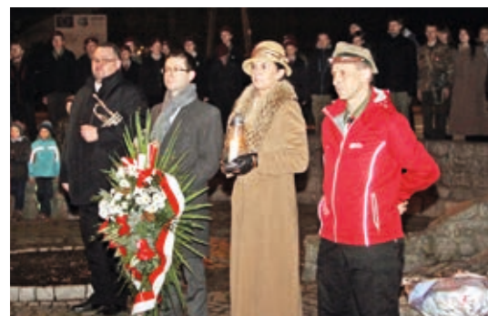
Złożenie wieńców pod Pomnikiem Powstańców Wielkopolskich

Imprezę zorganizowali harcerze Szczepu im. Powstańców Wielkopolskich w Nowych Skalmierzycach. Rajdo-biwak odbywa się regularnie od dziesięciu lat, w tym roku połączono go z obchodami 90-lecia harcerstwa na Ziemi Skalmierzyckiej. Z roku na rok przybywa uczestników chcących wziąć udział w tej żywej lekcji historii. Na początku uczestniczyły w nim tylko drużyny szczepu oraz zaprzyjaźnione drużyny z hufca, z czasem jed-