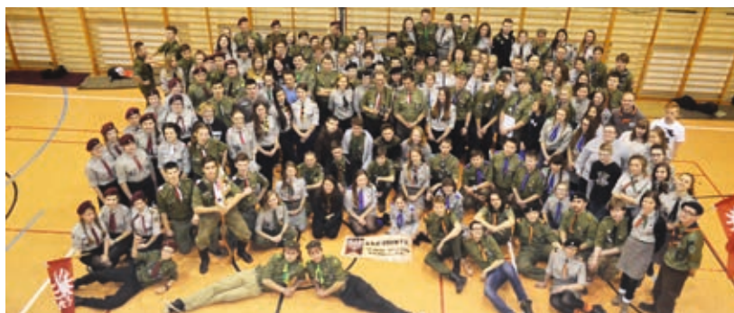
W rajdzie wzięto udział 180 harcerzy z całej Polski