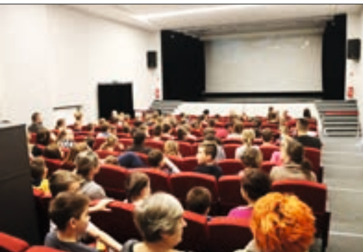
Projekcje filmowe w Starym Kinie