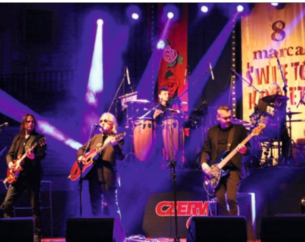
Koncert Czerwonych Gitar