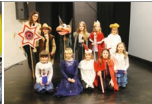
Aktorzy szopki noworocznej zorganizowanej w ramach działalności Stowarzyszenia Przyjaciół Jarzębinki