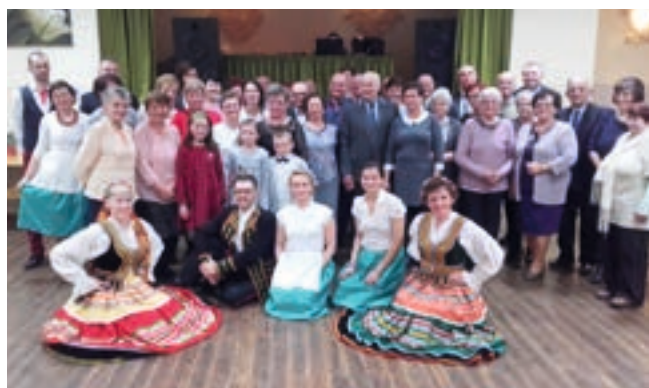
Uczestnicy spotkania wraz z zespołem „Dziewuchy”