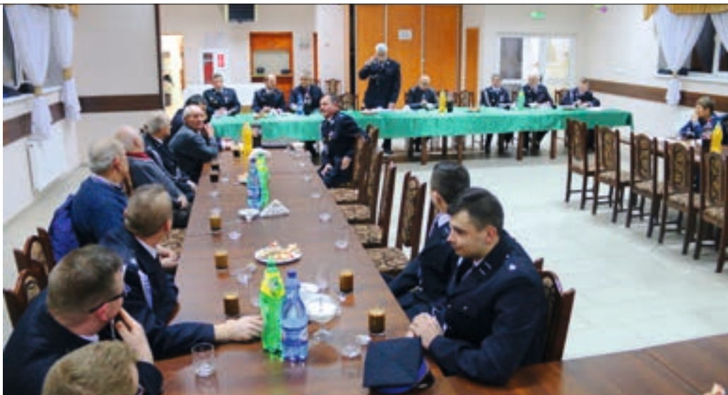
Podczas spotkania w OSP w Gostyczynie podsumowano działalność jednostki w 2016 roku