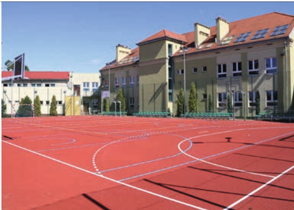
Gimnazjum im. Polskich Noblistów zostanie przekształcone w szkołę podstawową

W przypadku dwóch szkół podstawowych w Nowych Skalmierzycach zdecydowano o wyodrębnieniu nowych granic obwodów związanych z miejscem zamieszkania dziecka. Na ul. Okólną do Szkoły Podstawowej im. Powstańców Wielkopolskich będą uczęszczać mieszkańcy Śliwnik, Mącznik, Węgier, Skalmierzyc (tylko ul. Podkocka) a także Nowych Skalmierzyc z ulic 25 Stycznia, 3 Maja, Narutowicza, Kamiennej,