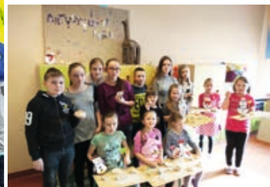
W szkole w Droszewie zorganizowano zajęcia artystyczne i sportowe