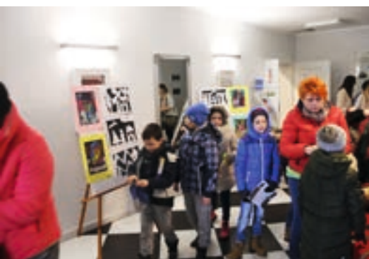
Wernisaż prac przygotowanych przez uczestników zajęć z kultury i sztuki

W urozmaicenie czasu wolnego zaangażowało się również działające przy nowoskalmierzyskim przedszkolu nr 1 Stowarzyszenie Przyjaciół Jarzębinki, które w pierwszy tydzień ferii zaprosiło dzieci do uczestnictwa w zajęciach z kultury i sztuki (warsztaty plastyczne oraz teatralne zakończone wernisażem prac oraz szopką noworoczną), a drugi przeznaczyło głównie na gry logiczne i zabawy sportowe rozgrywane w hali Stadionu Miejsko-Gminnego. Ponadto w czasie całych ferii działała prowadzona przez to stowarzyszenie świetlica przy ul. 3 Maja.