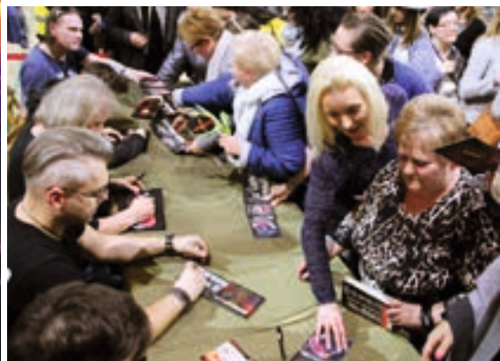
Po koncercie zespół rozdawał autografy i pozował do wspólnych zdjęć