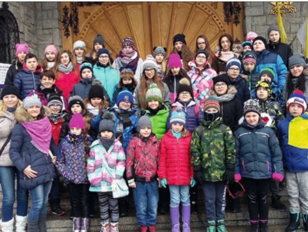
Już siódmy raz dzieci z SP w Nowych Skalmierzycach ferie spędziły w górach jeżdżąc na nartach i łyżwach, a wieczorami spotykając się przy ognisku. Na trasie ich zwiedzania pojawił się też Kraków.