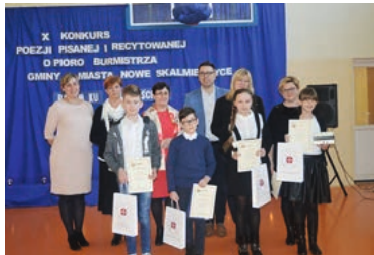
Laureaci konkursu z nagrodami