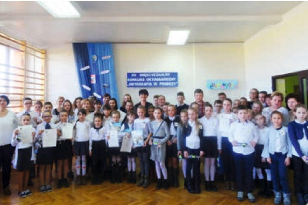
W konkursie wzięli udział uczniowie ze wszystkich szkół z terenu gminy