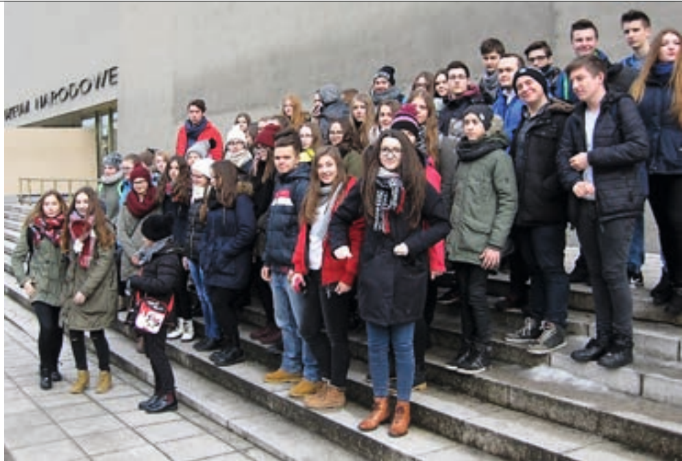
Uczniowie z Gimnazjum im. Polskich Noblistów w Muzeum Narodowym w Poznaniu