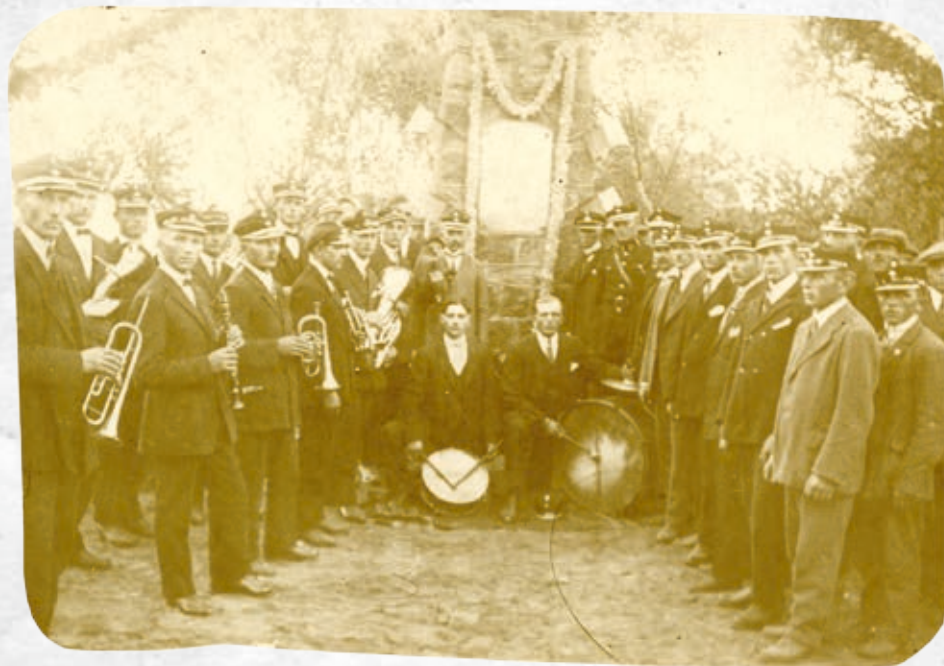
Pomnik poległych - okres międzywojenny

Ogólny zarys pomnika nawiązuje do mogił powstańców styczniowych. Chciano w ten sposób oddać hołd wszystkim bezimiennym ofiarom walk narodowyzwoleńczych. Charakterystycznymi elementami postumentu są trzy płaskorzeźby: Jezusa Cierpiącego autorstwa Marcina Rożka, św. Floriana ufundowana przez miejscową OSP w 1936 roku oraz Orła Białego w koronie. Płaskorzeźby są niejako symbolami najwyższych wartości, którymi kierowały się pokolenia naszych przodków, czyli: Boga, Honoru, Ojczyzny. Postać Jezusa odzwierciedla przywiązanie narodu polskiego do wiary katolickiej oraz jego cierpień w dobie rozbiorów. Święty Florian jest symbolem