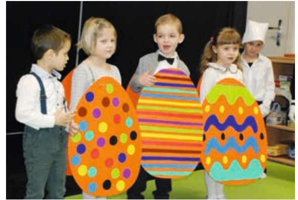
Występ przedszkolaków z Ociąża

Spotkanie zakończyło się świątecznym poczęstunkiem. Stoły przepełnione były wielkanocnymi babkami, barankami z masła, jajkami faszerowanymi oraz swojskim chlebem. Wszyscy goście otrzymali świą-