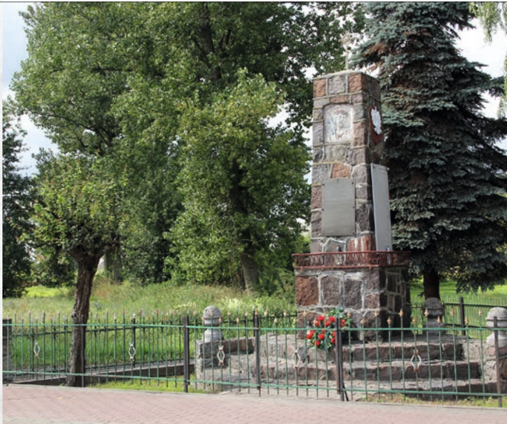
Pomnik przed pracami renowacyjnymi