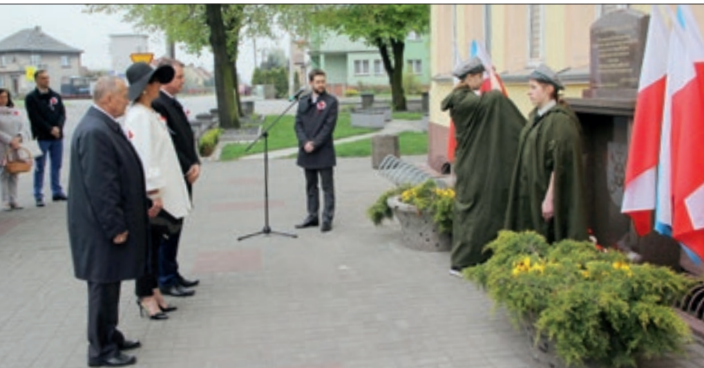
Złożenie wiązanki kwiatów przy tablicy upamiętniającej 100-lecie miasta