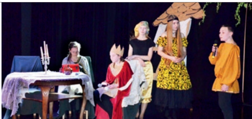
„Balladyna” w wykonaniu uczniów gimnazjum