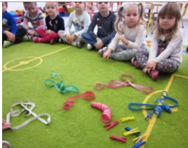
Dzieci z przedszkola w Ociążu podczas zajęć

Najbardziej aktywni uczestnicy kursu otrzymają nieodpłatne zaproszenie na konferencję lub całonocne, stacjonarne szkolenie z zakresu edukacji technicznej, które zostaną zorganizowane w siedzibie organizatora. Nie bez znaczenia jest również formuła kursu. E-learning pod postacią filmów edukacyjnych - wykładów oraz zajęć z dziećmi w przedszkolu to innowacyjne rozwiązanie, które nie tylko ma bardziej przyjazną formę, ale także pozwala na większą swobodę w planowaniu nauki przez