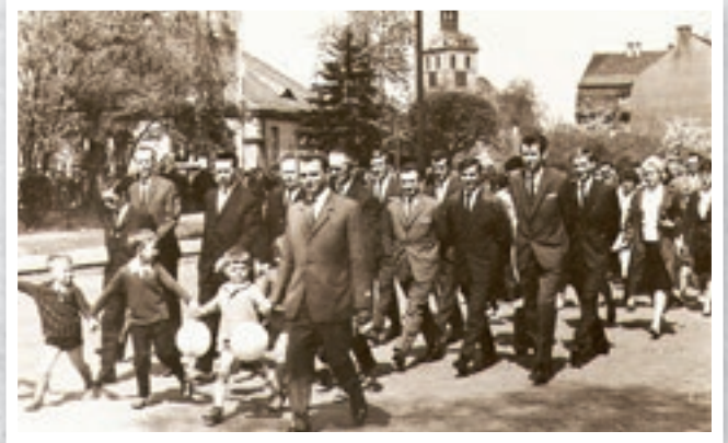
Pochód pierwszomajowy ulicami miasta