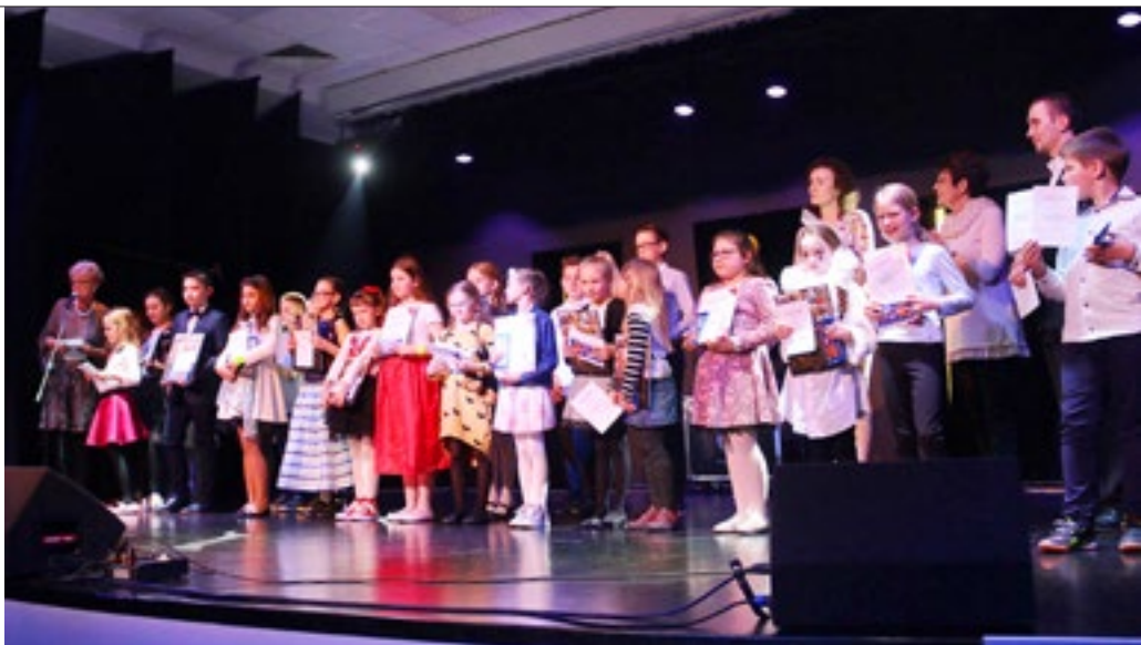
Nagrodzeni wokaliści na scenie „Starego Kina”