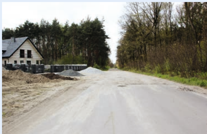
Śliwniki - ul. Spacerowa