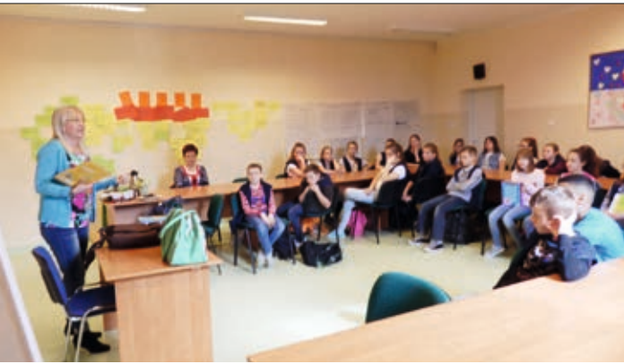
Pisarka zaprezentowała dzieciom swoje wiersze

W spotkaniach, które odbyły się w filii bibliotecznej w Biskupicach Ołobocznych oraz w Szkole Podstawowej im. Powstańców Wlkp w Nowych Skalmierzycach, wzięło udział około 80 dzieci z klas V i VI.