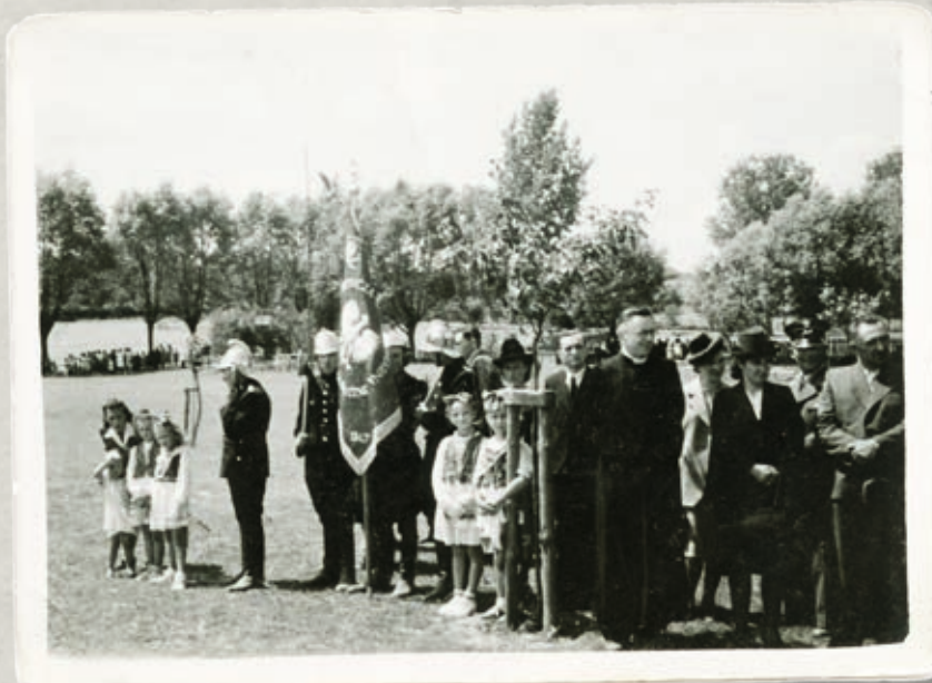
Poświęcenie sztandaru OSP w Biskupicach w 1947 r.

Stworzona wspólnym wysiłkiem przy ogólnym zrozumieniu społeczeństwa tak pożyteczna organizacja rozwijała się z roku na rok, a praca druhow przynosiła piękne owoce. W roku 1927 straż liczyła 43 członków, rok później już 50. Pierwsza remiza, drewniana, która znajdowała się na małym skrawku ziemi przy skrzyżowaniu ulic Środkowej i Bilczewskiej, służyła tylko do przechowywania sprzętu strażackiego. Na wyposażeniu straży znajdowała się między innymi sikawka konna, dwie kufy konne do przewożenia wody, drabiny, trąbki alarmowe, skrzynka sanitarna, 20 mundurów, 12 hełmów szeregowych i 2 hełmy oficerskie.