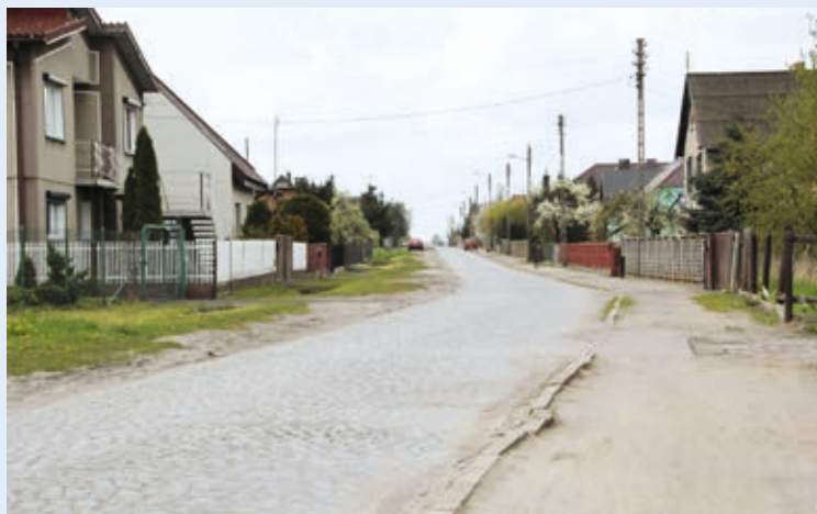
Biskupice Ołoboczne - ul. Śródkowa