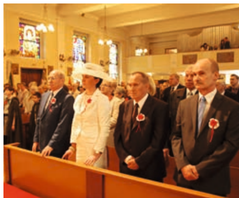
Msza święta w intencji Ojczyzny

W kościele pod tym właśnie wezwaniem odbyła się następnie uroczysta msza święta w intencji Ojczyzny z udziałem Miejsko-Gminnej Orkiestry Dętej, Chóru