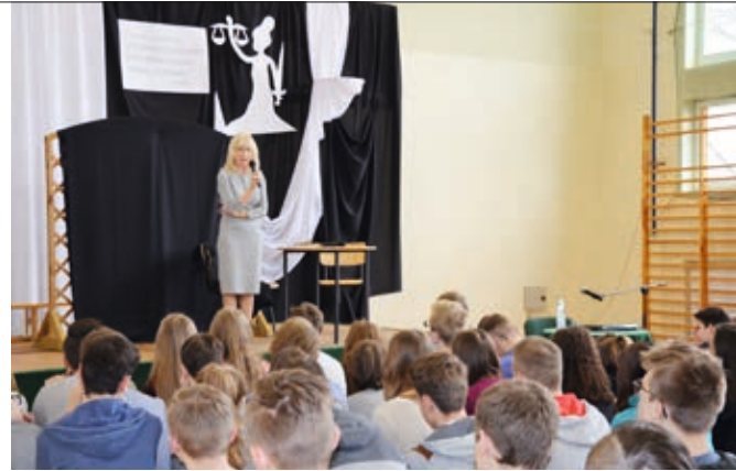
Sędzia odpowiadała na pytania zadane przez młodzież

Tego samego dnia odbyło się również spotkanie z rodzicami, przedstawicielami władz, pedagogami, dyrektorami szkół, Policją i pracownikami pomocy społecznej. Zarówno spotkanie z młodzieżą, jak i z dorosłymi rozpoczął występ uczniów, którzy zaprezentowali scenki rodzajowe dotyczące niewłaściwych zachowań dzieci wobec siebie oraz wpływ alkoholu na rozwój rodziny. Anna Maria Wesołowska przekonywała, iż najważniejsza jest profilaktyka i zapobieganie zagrożeniom. Rodzina i szkoła mają współpracować w celu ochrony młodego człowieka.