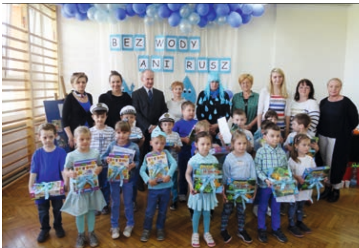
Przedszkolaki rozwiązywały zagadki i wykonywały zadania związane z ekologią

Pozostaje wierzyć, że cel konferencji przyniesie w przyszłości pozytywne skutki poprawiając bezpieczeństwo młodych ludzi zarówno w szkole, jak i w domu.