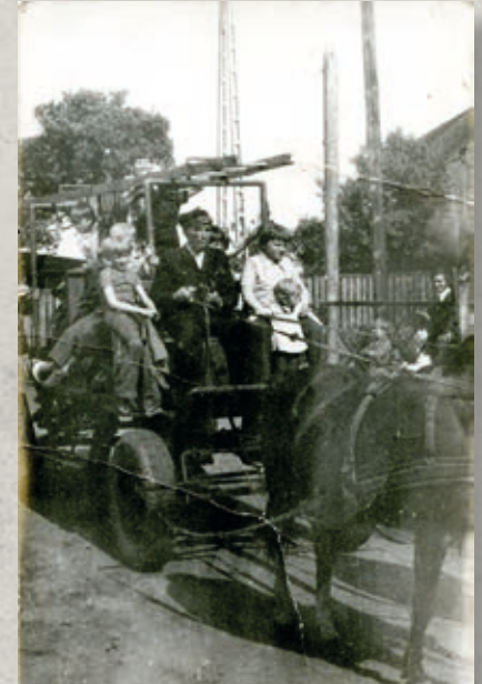
Wóz konny z lat 60-tych XX w.