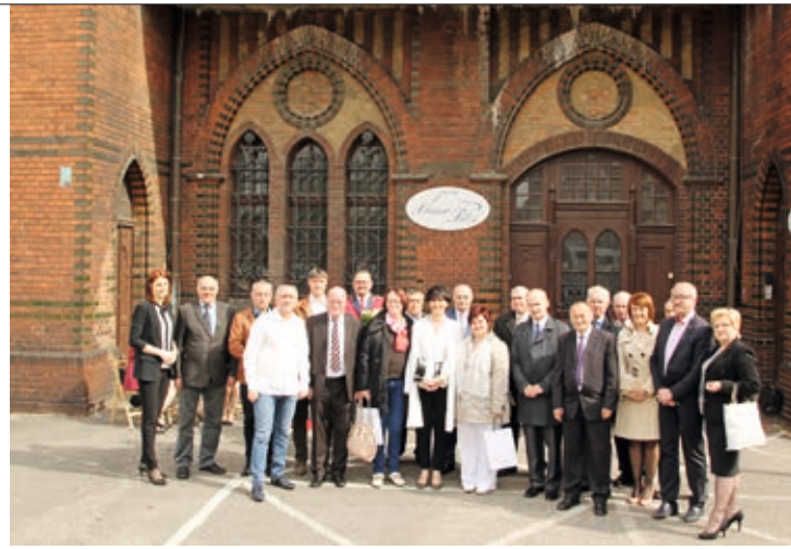
Delegacja z Sonnebergu wraz z polskimi gospodarzami