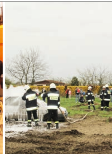
Akcji towarzyszyły liczne atrakcje

Ogólnopolska akcja zbiórki krwi przeprowadzana od ośmiu lat pod hasłem Motoserce z roku na rok zatacza szersze kręgi i zyskuje coraz więcej zwolenników.