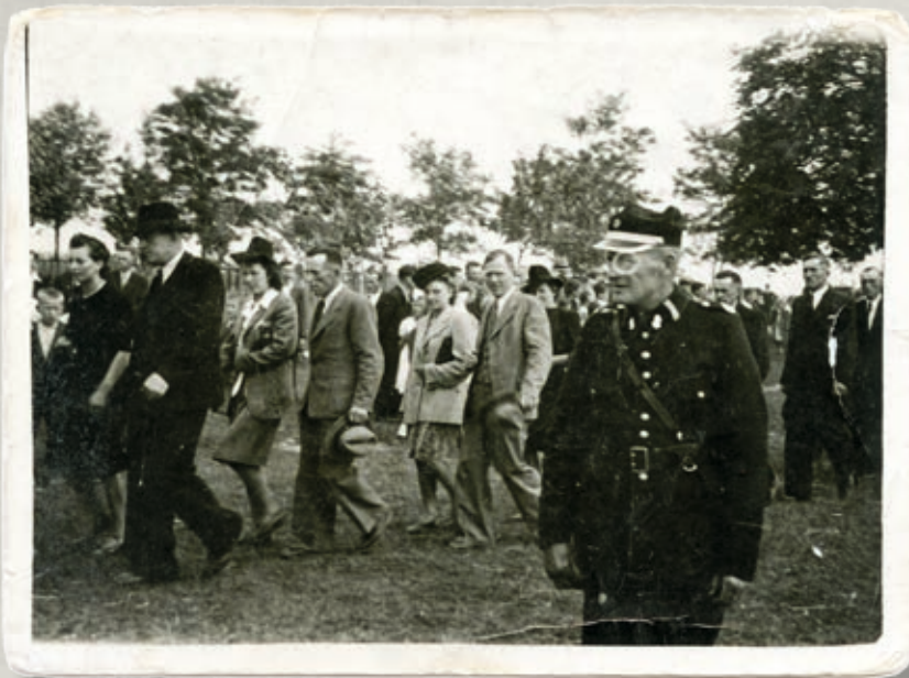
Poświęcenie sztandaru OSP w Biskupicach w 1947 r.

Na początku lat osiemdziesiątych pojawiła się nadzieja na otrzymanie pierwszego w historii straży samochodu gaśniczego ze zbiornikiem na wodę. 27 kwietnia 1982 roku rozpoczęto kopać fundamenty w celu rozbudowy i przedłużenia garażu dla nowego samochodu strażackiego. 15 czerwca 1985 roku Ochotnicza Straż Pożarna otrzymała samochód ga-