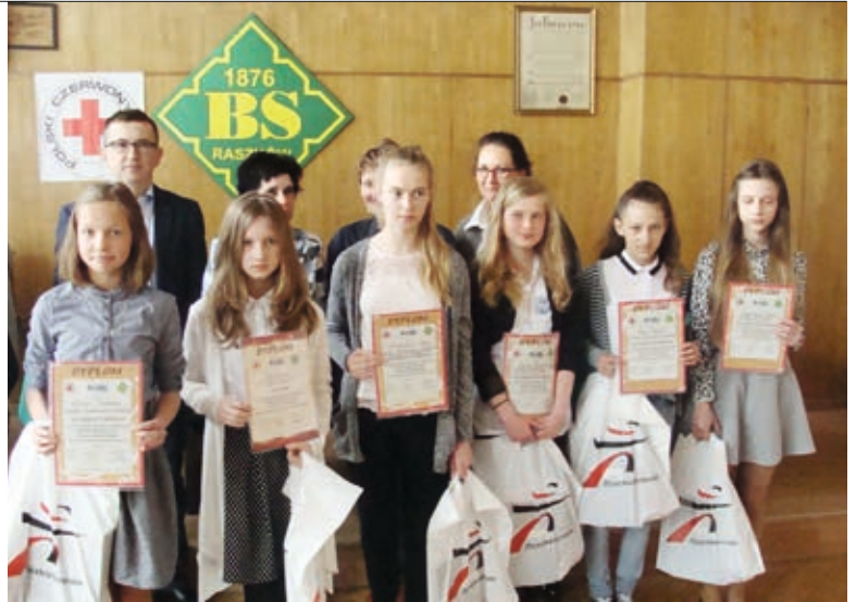
Uczestniczki konkursu PCK wraz z opiekunami

Sukces Mai jest kolejną okazją, aby promować zdrowy styl życia zgodnie z zasadami: zdobądź wiedzę o samym sobie, bądź aktywny fizycznie, ucz się walczyć ze stre-