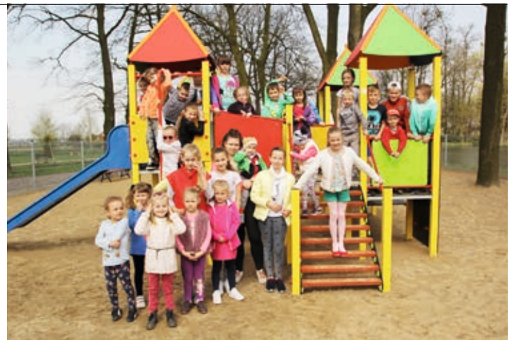
Dzieci na nowym placu zabaw w Ociążu

Sołtys zapewnił, iż plac spełnia wszelkie normy bezpieczeństwa, jest monitorowany przez całą dobę i mogą z niego korzystać