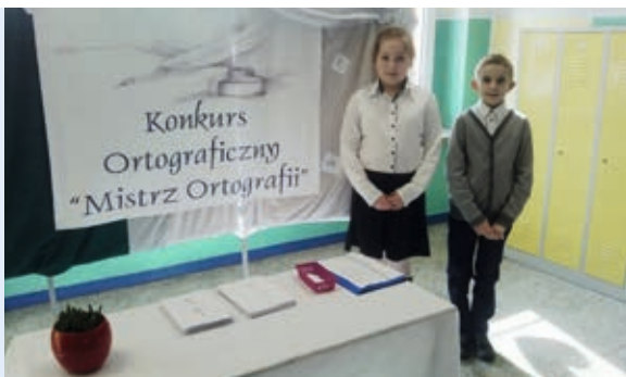
Młodzi mistrzowie ortografii

sem, odżywiaj się prawidłowo, hartuj się i bądź życzliwy dla innych. Wszystkim życzymy zdrowia i optymizmu. Mai także, a ponadto dalszych sukcesów i wytrwałości w zdobywaniu wiedzy!