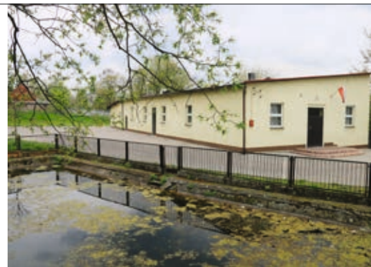
Świetlica w Biskupicach Ołobocznych