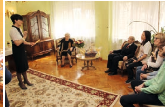
Uroczystość Kamiennych Godów

nalnym czekoladowym torcie oraz kawie chętnie dzielili się z organizatorami uroczystości oraz rodziną wspomnieniami z przeżytych wspólnie siedemdziesięciu lat. Miłym zaskoczeniem była dla wszystkich możliwość zobaczenia zeskanowanego oryginału aktu małżeństwa jubilatów.