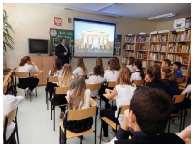
Spotkanie było ciekawą lekcją historii

wej lekcji historii uczestniczyli uczniowie klas VI szkoły podstawowej w Biskupicach Ołobocznych, Droszewie oraz Nowych Skalmierzycach, którzy z zainteresowaniem słuchali niezwykłych opowiadań podróżnika. Po spotkaniu każdy miał możliwość rozmowy z autorem oraz kupna jego książki z autografem.