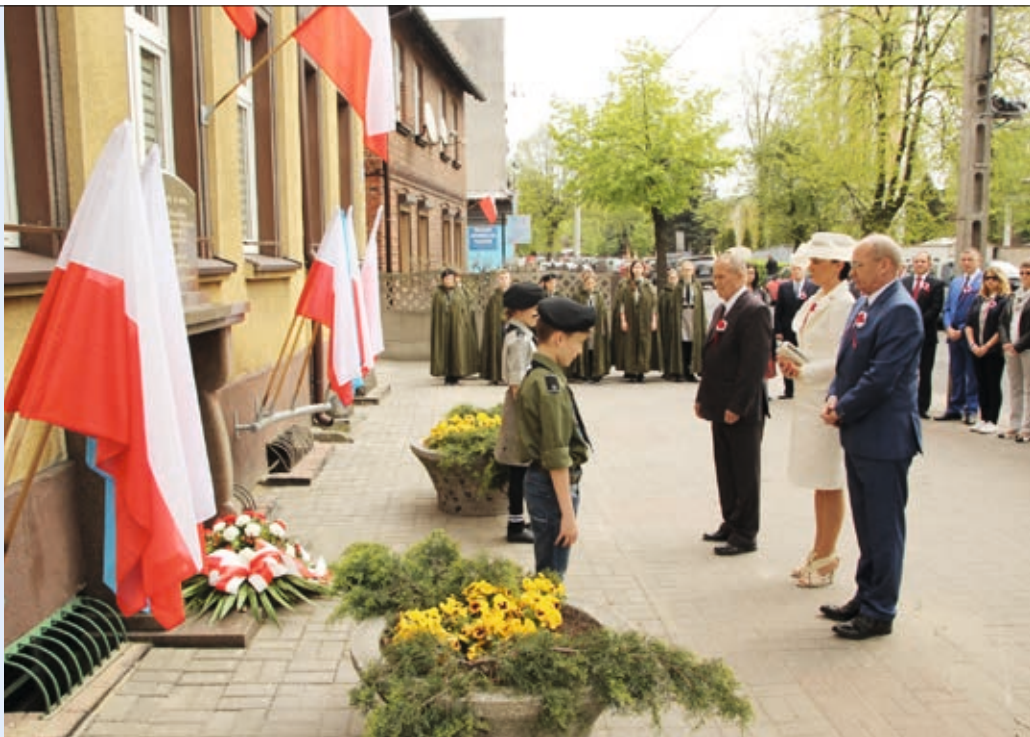
Złożenie wiązanki przez władze samorządowe