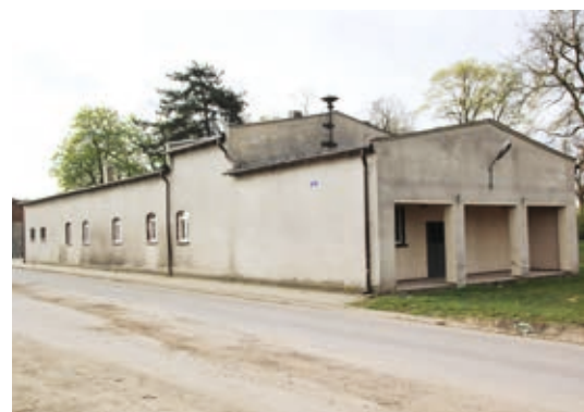
Świetlica w Boczkowie