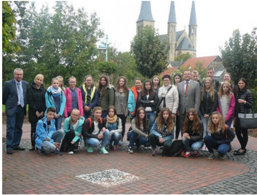
W wyjeździe wzięło udział ponad 20 uczniów Gimnazjum w Skalmierzycach