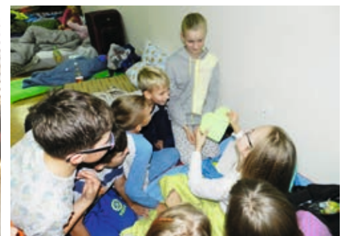
Uczniowie przygotowywali wspólne posiłki oraz miejsce noclegowe