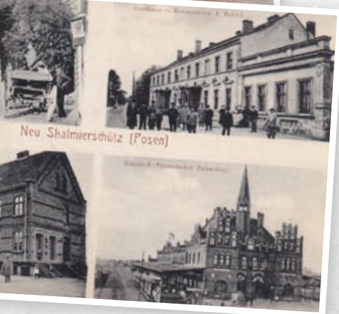
Pocztówki z XX wieku

komunikacji. W rezultacie późniejszych decyzji powstał imponujący neogotycki dworzec oddany do użytku w 1909 roku. Dziewięć lat później, w 1918 roku, kiedy Polska odzyskiwała niepodległość, Wielkopolska, podobnie jak pozostałe ziemie zaboru pruskiego nie weszła automatycznie w skład niepodległego państwa polskiego. Wpływ na dalsze losy Nowych Skalmierzyc miał wybuch i szczęśliwy finał Powstania Wielkopolskiego, które zakończyło erę niemieckiej dominacji na tym terenie.