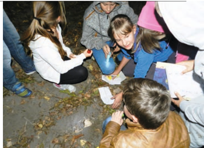
Największą atrakcją były zadania terenowe