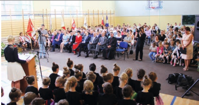
Inauguracja odbyła się na nowo powstałej sali gimnastycznej

Uroczystość rozpoczęło przecięcie wstęgi, a zakończył mecz pomiędzy pracownikami urzędu oraz firmy Brawix-Bud