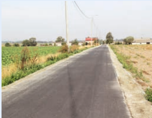
Droga w Gałązkach Małych