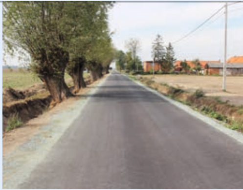
Droga w Gałązkach Wielkich