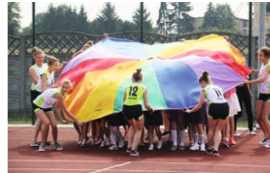
Na nowym boisku odbyły się występy artystyczne uczniów