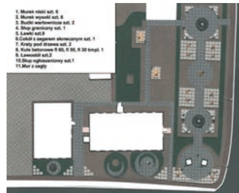
Aranżacja skweru będzie dopełnieniem rewitalizacji budynków dawnego cła

Skalmierzycami wytyczono granicę pomiędzy Prusami a Rosją. To właśnie tu mieściły się budynki jednego z dziewięciu granicznych urzędów celnych a przejście z roku na rok systematycznie się rozbudowywało i rozwijało, co w konsekwencji doprowadzi-