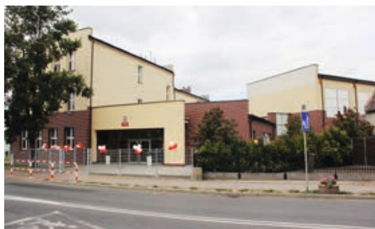
Modernizacja trwała 3 lata i kosztowała ponad 4,7 mln złotych

otwieramy i oddajemy do użytku budynek, którego generalna przebudowa i rozbudowa pochłonęła ponad trzy lata naszego samorządowego życia: naszych nerwów, zaangażowania i przede wszystkim ciężkiej pracy – nie kryła satysfakcji burmistrz Bożena Budzik, która w podziękowaniu za zaangażowanie