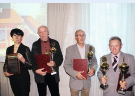
Wyróżniono 19 budynków z terenu południowej Wielkopolski