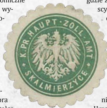
Znak Głównego Urzędu Celnego w Skalmierzycach