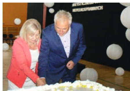
Gości poczęstowano urodzinowym tortem