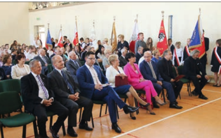
Goście zgromadzeni na uroczystości

Nie bez przyczyny w tym roku odbyła się ona właśnie w tej placówce oświatowej, bowiem uroczystość połączono z oddaniem nowego boiska wielofunkcyjnego, które w sierpniu powstało za budynkiem szkoły.