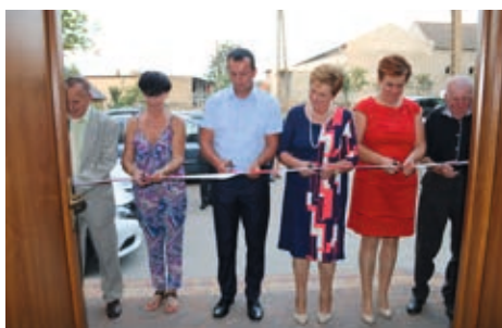
Przecięcie wstęgi w świetlicy

Zwiedzanie rozpoczęto od chodnika przy ulicy Ostrowskiej, następnie udano się na zmodernizowaną ulicę Środkową, a podróż zakończono w odnowionej świetlicy, w któ-