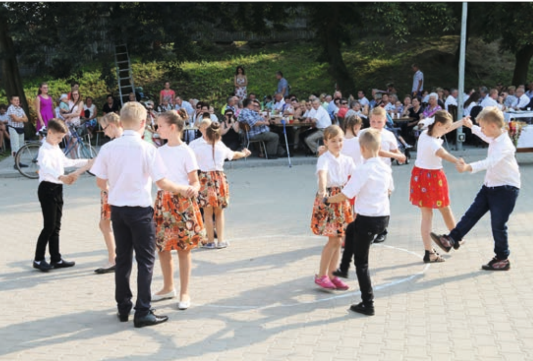
Występ dzieci ze szkoły podstawowej w Biskupicach Ołobocznych