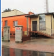
Kolejna rozbudowa „Jarzębinki” s. 2-3