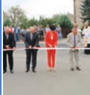
Otwarcie ulic w Śliwnikach s. 3