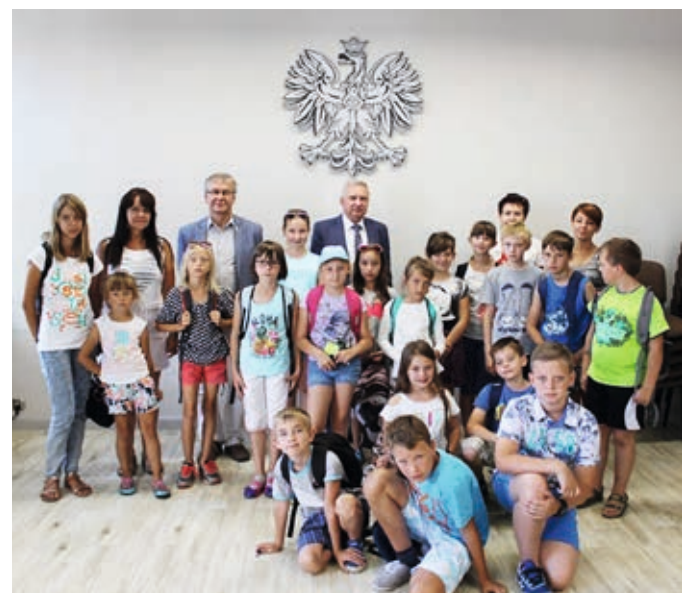
Uczestnicy wakacyjnego wyjazdu w Urzędzie MiG w Ostrzeszowie