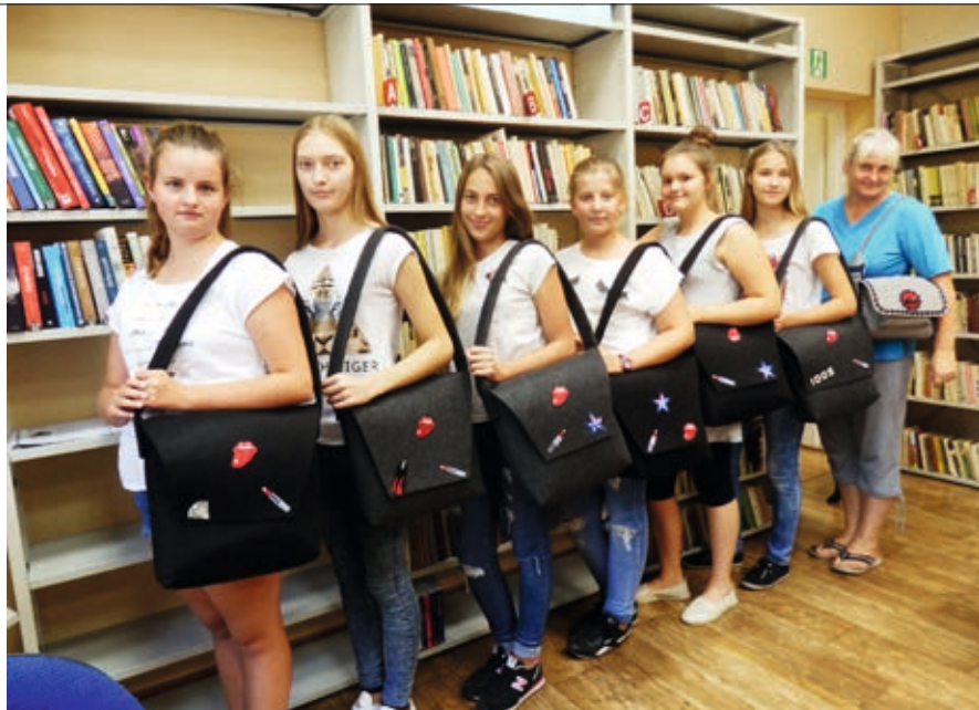
Uczestniczki i ich własnoręcznie wykonane torby