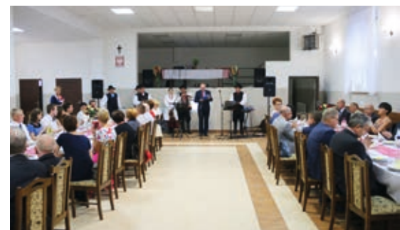
Wnętrze odnowionej świetlicy

Ostrowskiego, samorządowców i firm, które realizowały te inwestycje – dziękował w swoim przemówieniu sołtys Mirosław Nowacki.