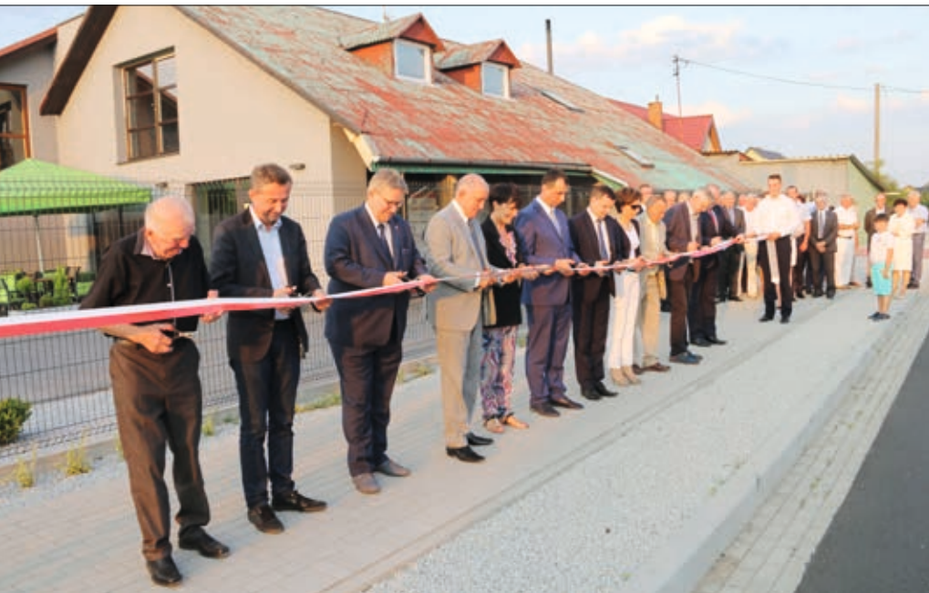
Uroczyste przecięcie wstęgi podczas oddania nowego chodnika