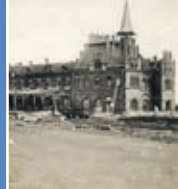
110-lecie budowy dworca w Nowych Skalmierzycach s. 6