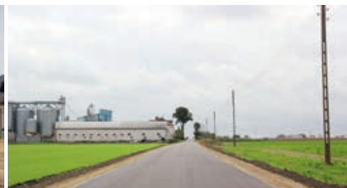
Droga po remoncie