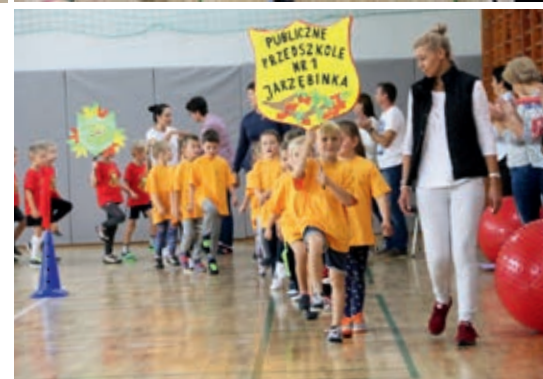
Wspólna rozgrzewka i przemarsz drużyn

Najlepsi okazali się przedszkolacy z Jarzębinki w Nowych Skalmierzycach, którym puchar wraz z medalami wręczył Zastępca Burmistrza Gminy i Miasta Nowe Skalmie-