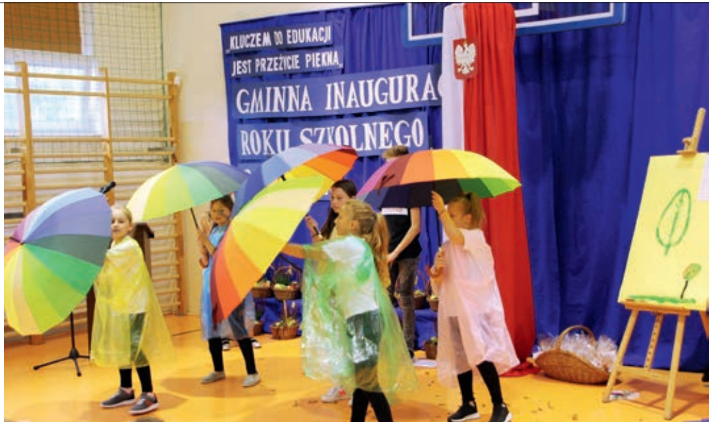
Część artystyczna pt. „Jesienne pejzaże”