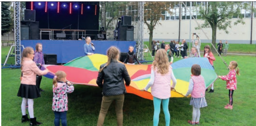
W czasie festynu nie zabrakło licznych atrakcji dla dzieci

Wprowadzeniem do wspólnej zabawy był spacer nordic walking, którego uczestnicy przez blisko półtorej godziny wędrowali ulicami miasta, by tuż przed godziną piętnastą pojawić się na płycie boiska. Tu zaś rozpo-