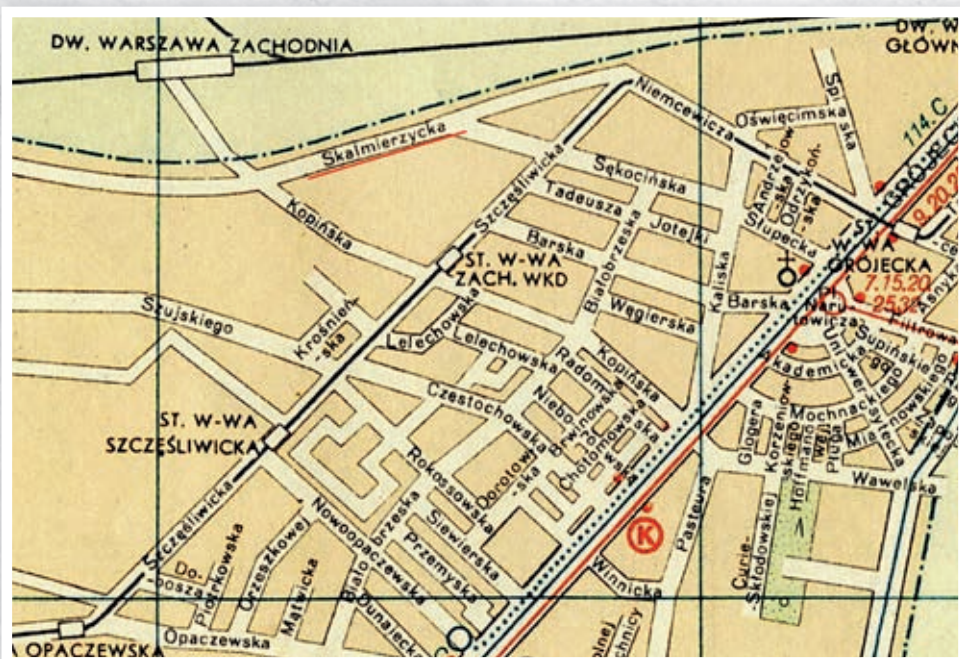
Mapa z 1958 roku

Prace inżynieryjno-budowlane przebiegły w iście ekspresowym tempie, gdyż już w roku 1902 przejechały tą linią pierwsze pociągi. 15 listopada 1902 roku o godz. 8 00 z Warszawy i Kalisza wyjechały dwa pociągi, inaugurując na tej trasie regularne połączenia kolejowe. Pociąg z Kalisza dojechał do Łodzi o godz. 12 24 , przywożąc 72 pasażerów. Nieco później, bo o godz. 13 28 przyjechał do Łodzi pociąg z Warszawy ze 150 pasażerami. Można sobie tylko wyobrazić trud, jaki podjęto realizując budowę tak długiego odcinka drogi żelaznej w ówczesnych realiach technicznych, gdy trzeba było wykonać kilkadziesiąt przepustów wodnych z dwoma wielkimi wiaduktami nad Wartą w Sieradzu oraz nad Prosną pod Kaliszem. Zastosowanie szerokiego rozstawu szyn wymusiło