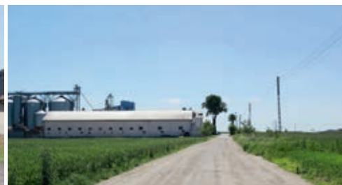
Droga przed remontem