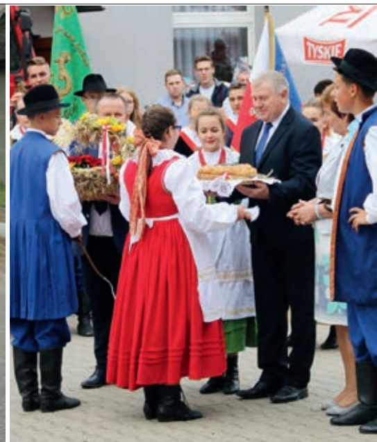
Korowód oraz obrzęd dożynkowy