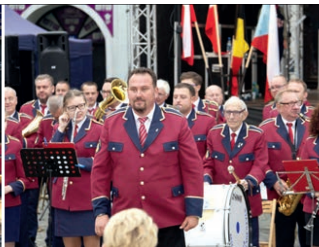
Miejsko-Gminna Orkiestra Dęta zajęła w konkursie drugie miejsce