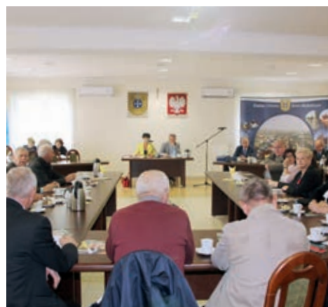
Sołtysi odebrali nagrody za najciekawsze dekoracje dożynkowe

Chylę czoła przed wszystkimi sołectwami, które wykonały dekoracje. Przerosły one moje najśmielsze oczekiwania. Dziękuję również tym wsiom, które przygotowały wieńce dożynkowe. Z wieńcami przyjechały również delegacje reprezentujące trzydzieści trzy dekanaty z naszej diecezji. Dzięki temu mogliśmy w piękny sposób po-