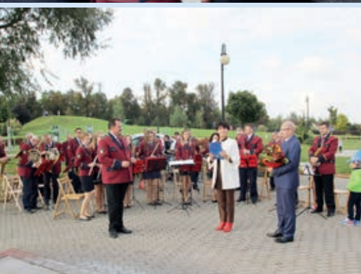
Koncert odbył się w parku miejskim