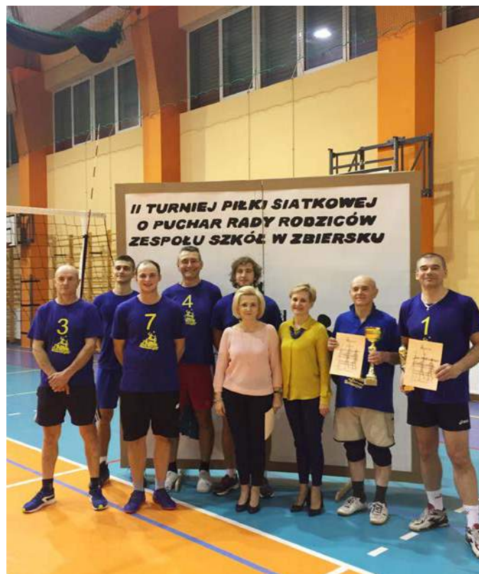
Legion św. Katarzyny