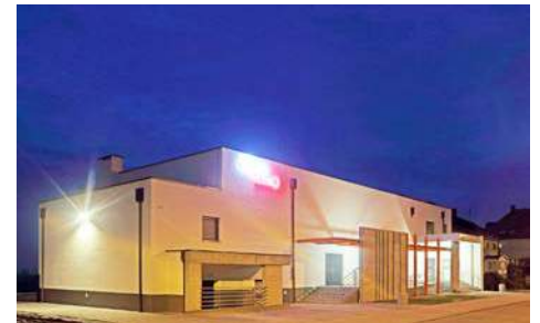
Stare Kino w Nowych Skalmierzycach