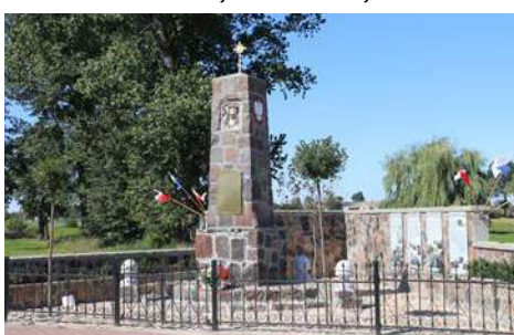
Pomnik ofiar wojen światowych w Biskupicach Ołobocznych