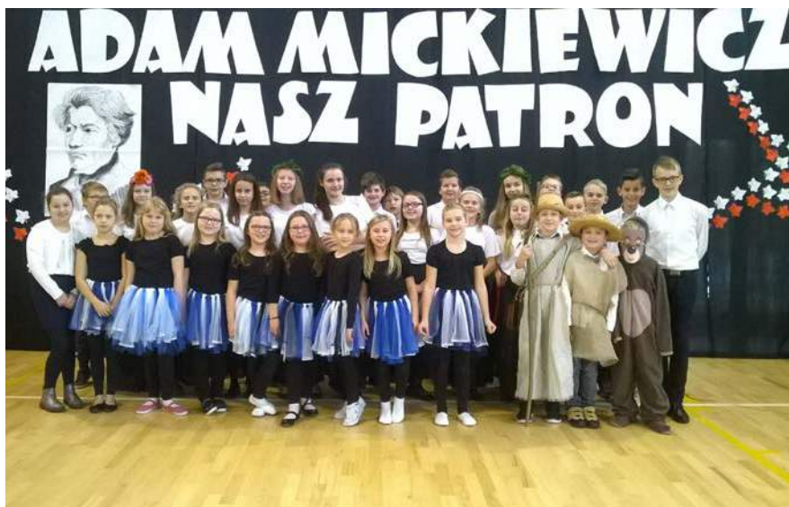
Uczniowie przygotowali program artystyczny wykorzystując dzieła patrona szkoły

z jego życia oraz podziwiać śpiew i taniec młodych artystów. Dzień Patrona po raz kolejny udowodnił, jak ważna dla społeczności szkolnej jest jej tożsamość, tradycja. Pokazał, jak praca z patronem może być źródłem działań wychowawczych, dy-