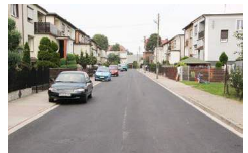
ul. Mertki w Nowych Skalmierzycach