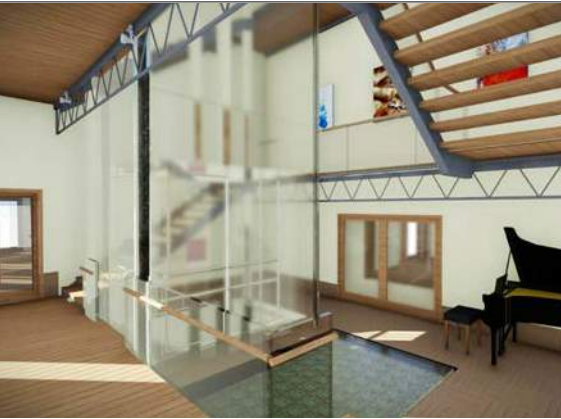
Koncepcja zagospodarowania wnętrza - hol obiektu