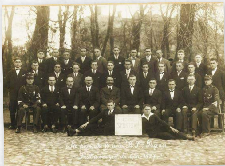
Skalmierzyce 6 XI 1927 r.