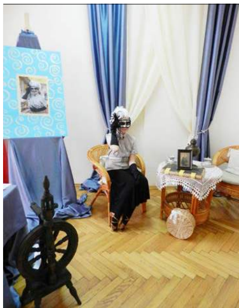
Scenografia przygotowana przez uczniów