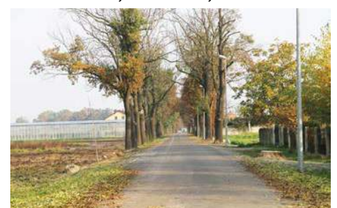
ul. Zapłocie w Boczkowie