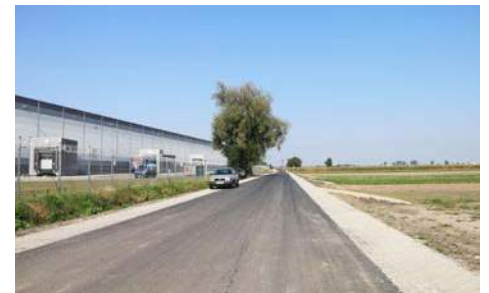
ul. Bielawska w Skalmierzycach