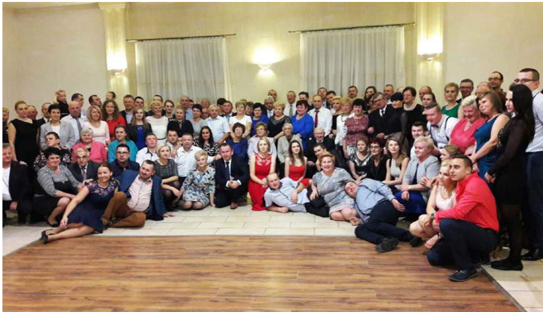
W zjeździe wzięło udział ponad stu potomków rodziny Gaszczyńskich

„To, co przeminęło, tego nikt nie zmieni. Najpierw wiosna, potem próg jesieni. Gdy żyli rodzice, dziadkowie i ciocie, byliśmy wszyscy