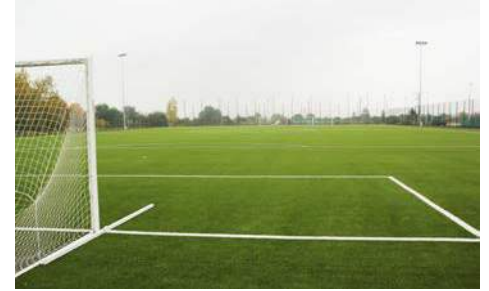
Boisko treningowe przy miejskim stadionie