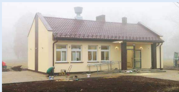
Świetlica w Kurowie