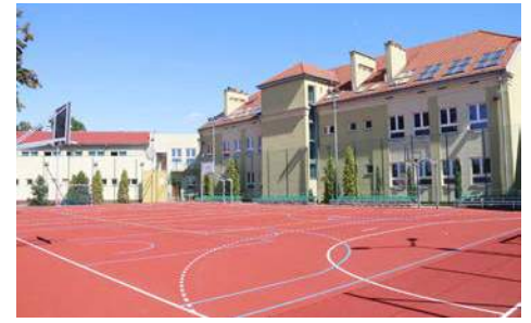
Boisko przy gimnazjum w Nowych Skalmierzycach