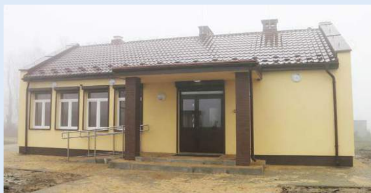
Świetlica w Głóskach