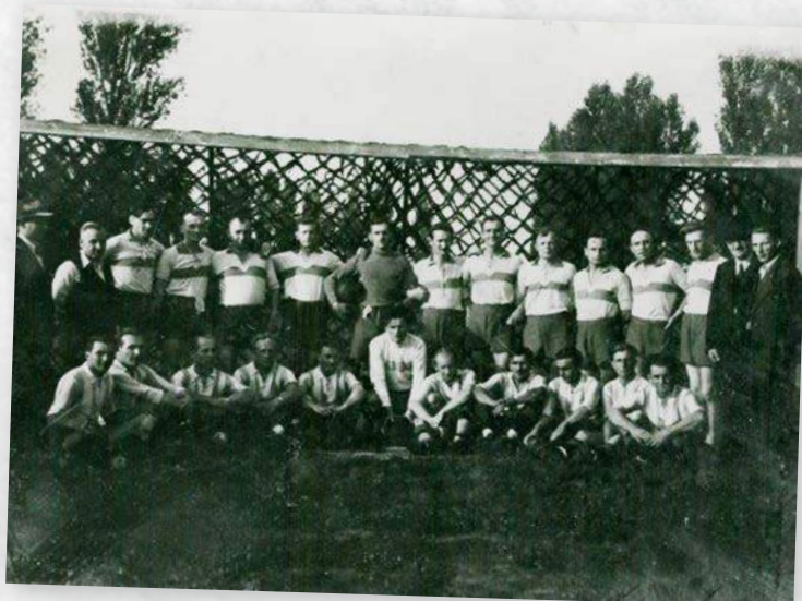
Dla upamiętnienia meczu weteranów i I drużyny KKS Pogoń - 1946