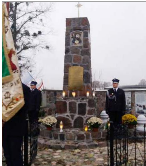
Warta przed pomnikiem Ofiar Wojen Światowych