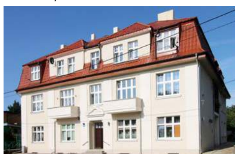
Budynek komunalny przy ulicy Wyszyńskiego w Nowych Skalmierzycach