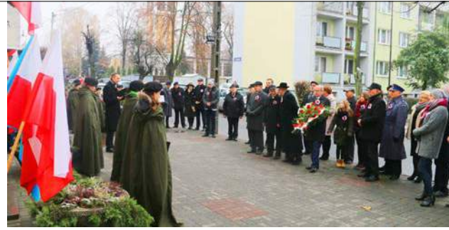
Złożenie kwiatów pod tablicą upamiętniającą 100-lecie miasta