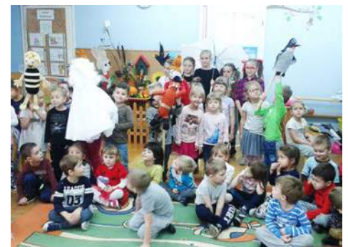
Uczennice ze szkoły podstawowej w Droszewie odwiedziły przedszkole „Jarzębinka”

W imieniu dzieci oraz wychowawczyń bardzo dziękujemy za wspaniały pokaz, zajęcia i niespodziankę.