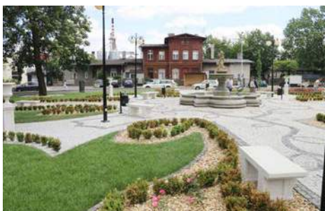
Plac Wolności w Nowych Skalmierzycach